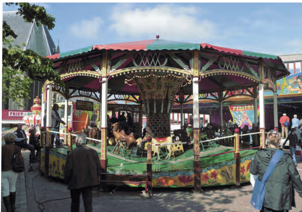
Hobbelende geit of golfbaan in Oldenzaal.