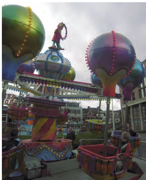
Kermis bij het stadhuis in Hengelo.

Na de grote brand in Enschede in maart 1517 verleende Frederick van Baden, Bisschop van Utrecht, aan de bevolking toestemming om op donderdag na Pasen en op de eerste werkdag na Sint Maarten, 11 november, een jaarmarkt te houden. In bewaard gebleven stukken lezen we hoe de kermis er vijftig jaar voor de grote brand in begin negentiende eeuw werd beleefd door boeren, burgers en buitenlui. Kramen met koek, speelgoed, een poppenkast, een waarzegster en speculanten bepaalden het kermisbeeld rond de Grote Kerk. Voorafgaand aan de kermis was er een bescheiden jaarmarkt waar men 'zijde-, katoenen-, linnen-, en andere stoffen' maar ook vee kon kopen. De eerste Paaskermis in het Volkspark werd in 1875 gehouden. De kermisgangers konden zich vergapen aan de carrousel, het paardenspel, acrobatische voorstellingen en circus Carré. In Hengelo was er naast de septemberkermis vóór 1900 ook een Paaskermis, die voor het