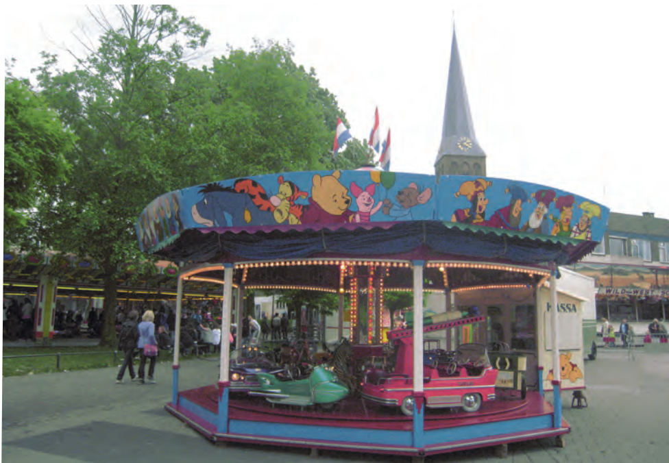
De Draaimolen op het Hengelose marktplein.