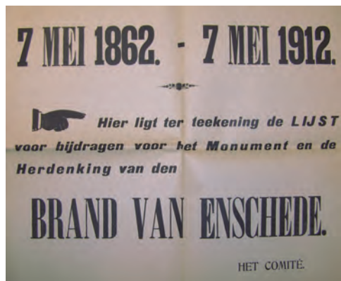
Poster voor de oproep tot intekening.