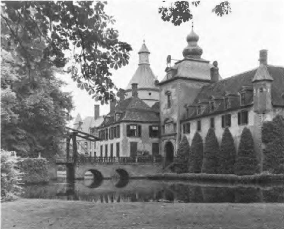
Slot Anholt.

vroegere voorde door een dode Rijn-arm en is in de loop van de eeuwen uitgegroeid tot een machtig complex. De eilanden, waarop de gebouwen thans liggen, worden door brede grachten omspoeld, die gevoed worden door de Oude IJssel en sedert 1651 ook door de zgn. Bocholter Aa. De toegang tot het kasteel is vanuit het westen over verschillende bruggen, eerst naar de voorburcht, vervolgens in oostelijke richting naar het eigenlijke grote slot.