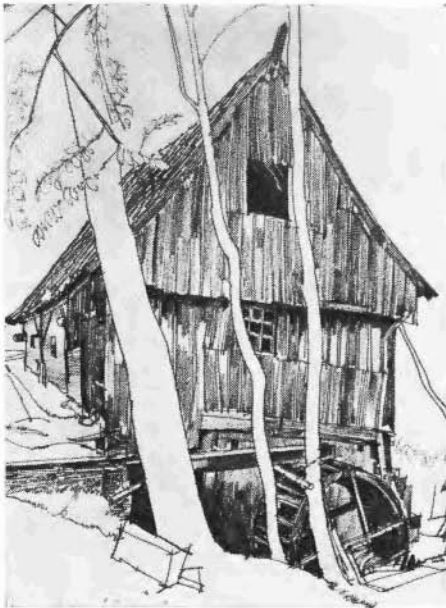
Watermolen Hazelbekke, Nutter, gem. Denekamp. Tekening: Jan Jans.

De steen van het bescheiden Vloedveld-monument zal binnen afzienbare tijd een plaats krijgen in een plantsoen bij de G. B. Vloedveldlaan in de Haghoek te Almelo.