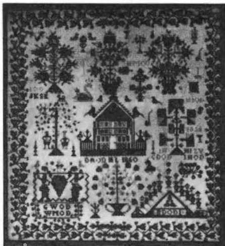
Bruidsdoek anno 1860, tentoonstelling Het Oude Handwerk Markelo.

Uitg. Overijsselsch Regt en Geschiedenis: Het Stadregt van Hardenberg en het Stadregt van Diepenheim