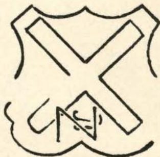
Bourgondisch wapen op grenssteen nr. 22. De N is in 1824 door de vuurslag heen gebeteld.

Deze steen stond eens op een heuveltje, in de buurt van een douanehut. Om een of andere onbekende reden brak hij stuk, en een brok, zwaar beschadigd alsof er met een bijl op ingehakt is, werd gebruikt als hoeksteen van een schuur bij Haar-Jan. Daar is hij nu, op verzoek van de heer Bloemen, onder weggehaald. Nu ligt hij „ergens" op het erf, bijna onherkenbaar verminkt; alleen de letter N is nog zwak te herkennen.