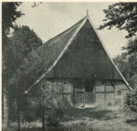
Een gaaf landschap... gave oude bouwkunst... Het (verdwenen) huis „Singers”, Volthe, gem. Weerselo.

Wat is hier nu aan te doen? Nagenoeg niets; tegen onbegrip valt niet te vechten. Het enige wat zij, die deze zaak ter harte gaat kunnen doen, is te zorgen dat de verkeerde voorstellingen de wereld worden uitgeholpen, door het geven van juiste en nuchtere voorlichting. Nuchter , door gewoon toe te geven dát er inderdaad sprake is van beknotting van rechten; juist , door de voordelen te noemen, o.m. van heus niet kleine subsidies, en door erop te wijzen dat men niet het