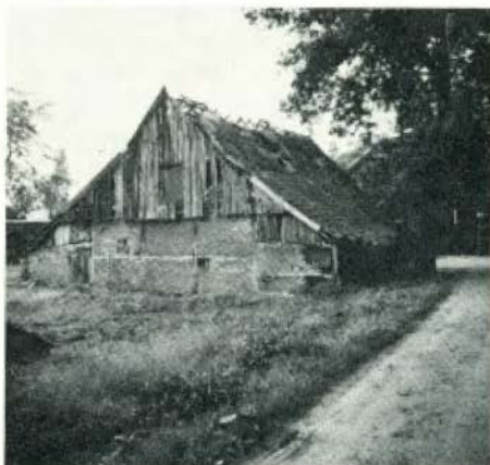
Zeer vervallen schuur te Klein Agelo (thans afgebroken).

Een bevredigende verklaring voor Agelo is tot nog toe niet gegeven. De naam is uniek, en parallellen in Engeland of Duitsland, die zo verhelderend kunnen werken, zijn me niet bekend. Het grote Toponymisch Woordenboek van M. Gyseling (Tongeren, 1960), dat alleen die plaatsen opneemt die voor 1226 vermeld zijn, noemt hem niet, maar J. de Vries in zijn Woorden-