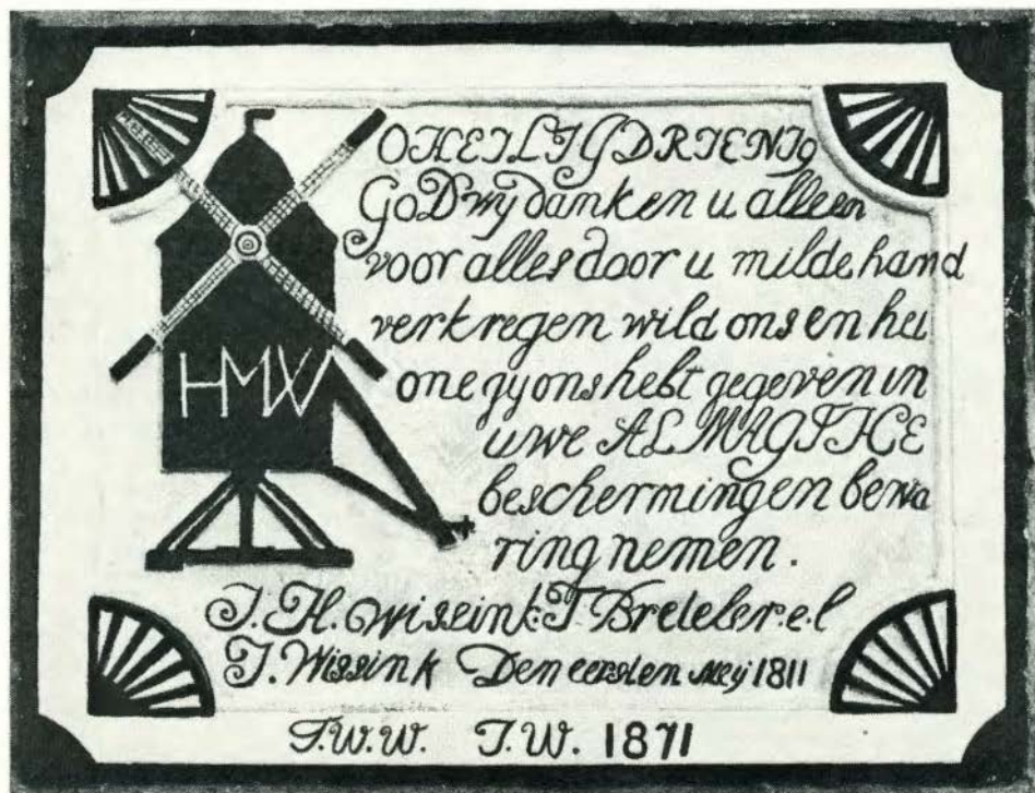
Stenen stenderkast.