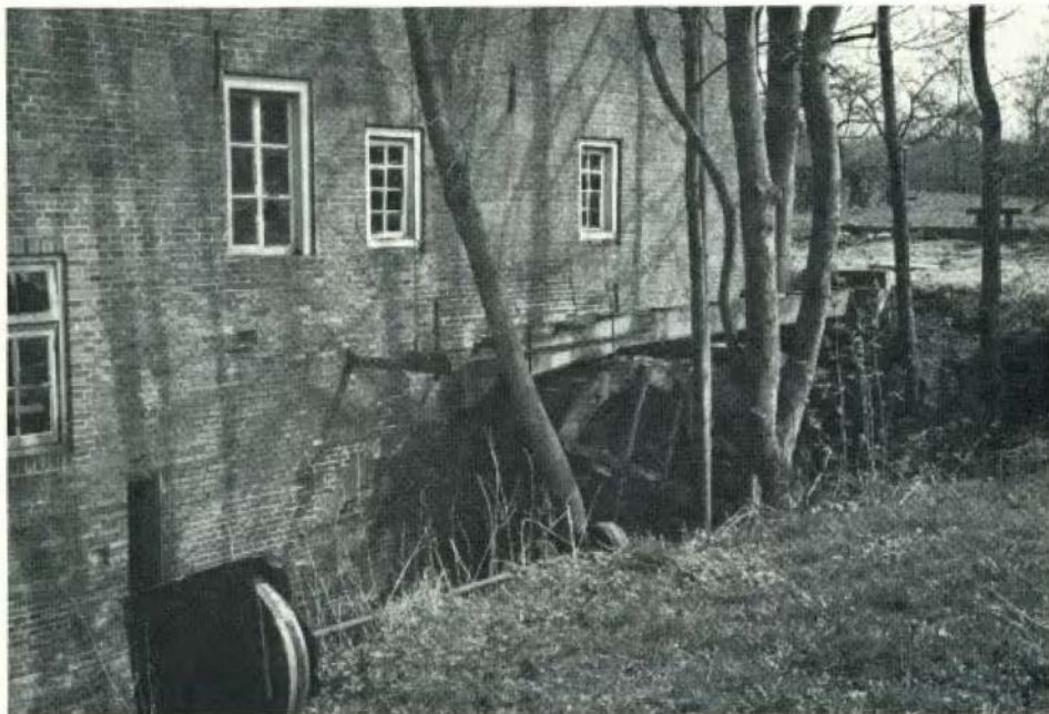
Watermolen van Frans, Mander.

Rijssen. De collectie Van Heel, geschonken aan de Oudheidkamer Riessen en in bruikleen gegeven aan het Rijksmuseum Twenthe te Enschede, hoort naar Rijssen terug te keren. Dat is de mening van de bestuurders van de plaatselijke oudheidkamer. Om de belangstelling voor deze zaak warm te houden wil men pogen van tijd tot tijd exposities ter plaatse in te richten met het materiaal van deze kostbare collectie. De inwoners van Rijssen gaan er niet voor naar Enschede, meent het bestuur. „Riessen“ is door de schenking Van Heel de rijkste oudheidkamer van het land, maar zij bezit geen geld, zelfs niet om een onderkomen in te richten voor de al eerder verzamelde oudheidkundige voorwerpen.