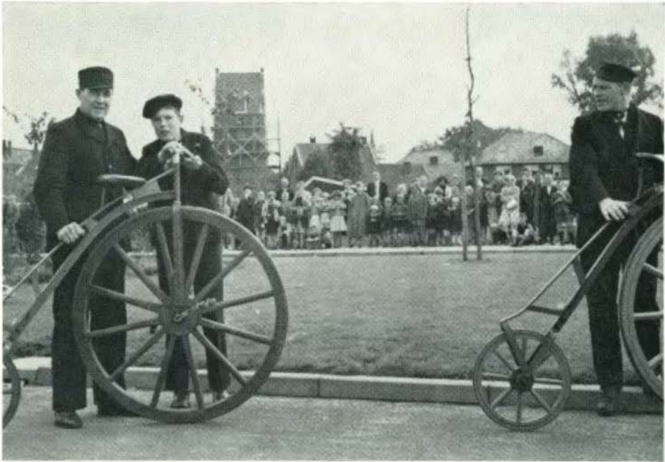
Böggelrieders voor de oude St. Maartenstoren, hier juist in de steigers.

grond van de begraafplaats liet aanleggen, zal weer aan de begraafplaats toegevoegd worden, zodra de moeilijkheden over de oude toegangsweg (men hoopt in ruilverkavelingsverband) opgelost kunnen worden.