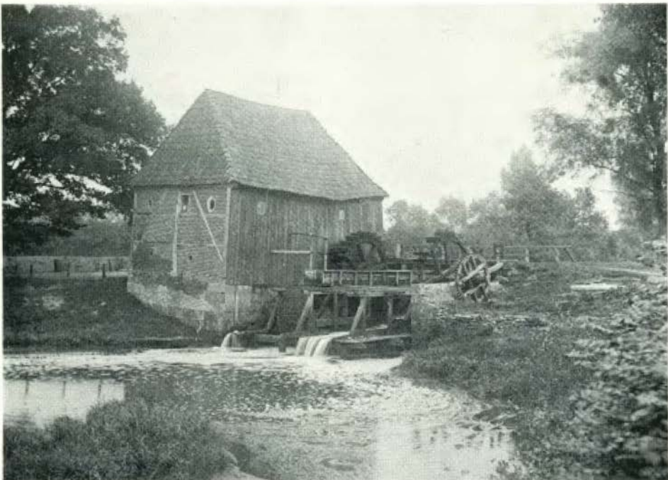
De watermolen te Oele.

lijkheid, en daar dit jaar zeker(?) voor twee van onze Twentse matermolens („Frans” te Mander en „Oldemeule” te Oele) restauratie een feit zal gaan worden, is het goed, hierbij even stil te staan. Is het werkelijk noodzakelijk, dat alle watermolens, zoals ten onzent tot dusver het geval is geweest, ook inwendig geheel in „oude staat” worden hersteld? Van deze draait er geen enkele meer, dan alleen Den Halter te Diepenheim (hoe lang nog?) en Bels te Mander (alleen voor toeristen af en toe). We behoeven ons toch geen enkele illisie meer te maken: de in oude staat zijnde molens hebben