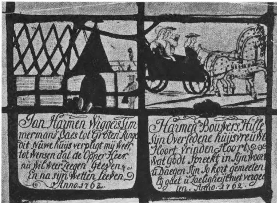
„Glas” uit Schonebeek, gedateerd 1762.