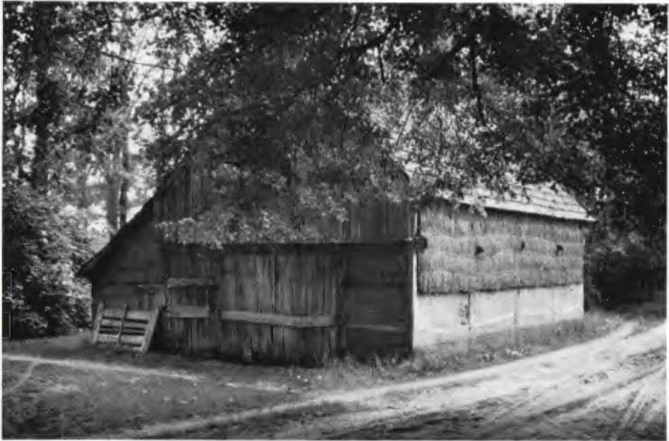
Het erve De Brager te Geesteren.

dervindt veel belangstelling. De bijeenkomsten zullen voortaan op huize Holterhof gehouden worden. Een zomerexcursie voerde naar de interessante grenssteen tussen de marken Esmarke, Buurse en Usselo, en naar enkele historische boerderijen. Bij het gemeentebestuur is het behoud van meer monumenten bepleit.