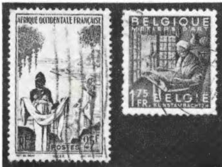
Textiel op postzegels.

Stichting Twents-Gelders Textielmuseum W. F. Schweitzer, secretaris