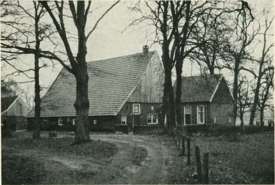
De Wesseler, Twekkelo

der werden er bij het nabijgelegen Dorpshuis demonstraties in het klompenmaken gegeven. Al met al een tentoonstelling waar zeer veel te zien viel en die de organisatoren zeker tot eer strekte.