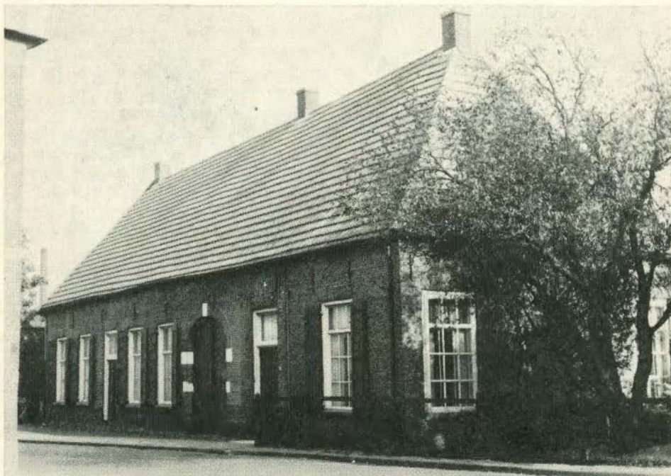
’t Kipshuis te Borne