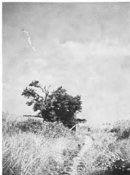
Vleerbos op de Usseler-es ± 1950.

Uit de toelichting op dit ontwerp mogen we concluderen dat in Almelo bijna geen onvermijdbare schade aan het landschap wordt toegebracht. Bij Delden zal helaas een uitloper van het landgoed Twickel doorsneden moeten worden. Dit is noodzakelijk i.v.m. de bebouwing van Borne, een dubbele hoogspanningsleiding, een hoge-druk-