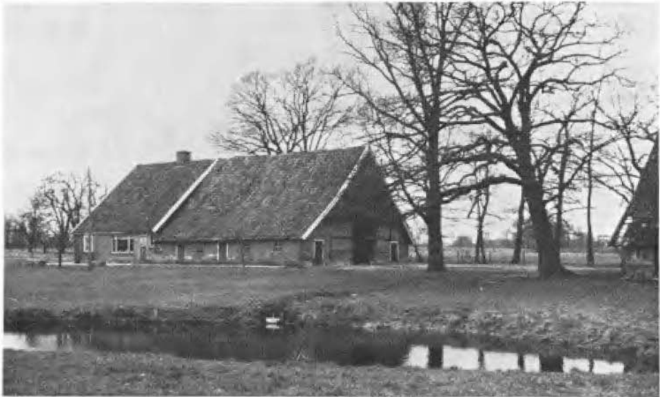
Scholte Splinterink, kort vóór de afbraak

was gekomen, kwamen de hoven en onderhorige goederen onder beheer van het college van Ridderschap en Steden van Overijssel te Zwolle, dat voortaan als leenheer optrad. Het uit 1601 daterende Verpondingsregister van de Hollandse Rekenkamer te Den Haag 6) vermeldt onder de Buerschap Nutter unde olden Othmerssen: „Splinterinck 10 mudde landes, noch 4 mudde woeste in heit stoppelen, 2 dachmal hoies giffit die 3de garve gehoret Antonio Hueskens”. In 1630 werd het erve verpand aan de heer van Almelo tegen 1680 goudgulden en een jaarlijkse pachtsom van 90 gulden 7) . Het pandschap gold voor 20 jaren en werd in 1650 verlengd; twaalf jaren later werd het ingelost. In 1716 vatten „de Ordinaris Heren Gedeputeerden deser Provincie” het plan op, de erven Splinterink, Haave, Aarnink, Vaarwijck en Oosterhoff te verkopen, waartoe weer de nodige specificaties werden opgemaakt 8) ; zo onder meer: „Splinterinck met het Watermoletien... het halt (= hout) 640 gl daarenboven