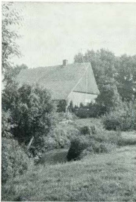
Het 'Olde Mulder' te Berghuisen

Het belangrijkste uit de geschiedenis van Het Hulsbeek is hiermee wel verteld. We willen daarom besluiten, maar gaarne eerst een suggestie doen aan het Recreatieschap Twente. Immers, in Tubantia van 12 mei 1970 stond in een artikel over het Structuurplan van Het Hulsbeek te lezen 'De ruimte voor