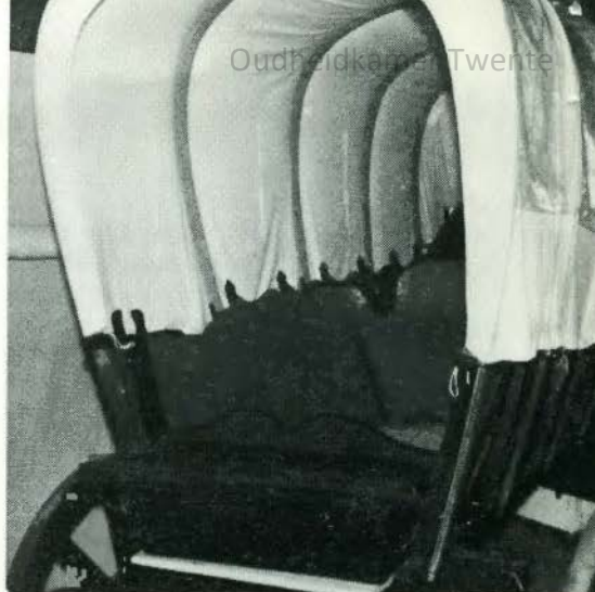
Met deze hulfkarren ondernamen vroeger de Vriezenveense kooplieden de lange tochten naar het tsaristische Rusland.