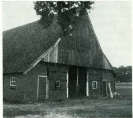
De Brandehof 1961