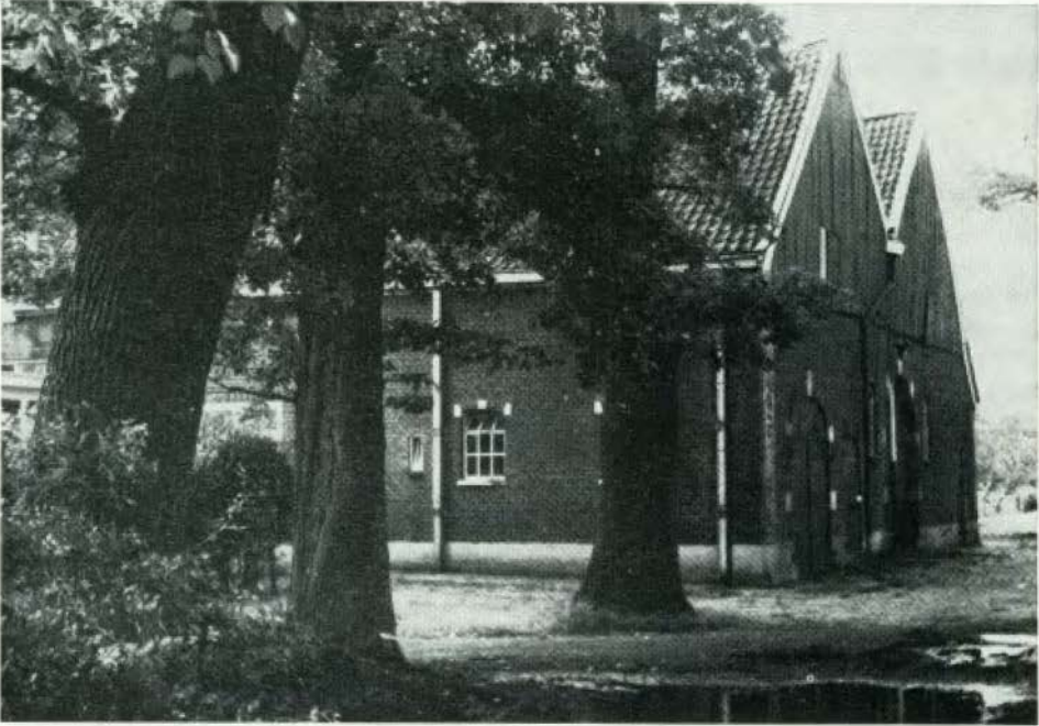
Achterzijde van de boerderij Spiele (afgebroken sept. 1971)