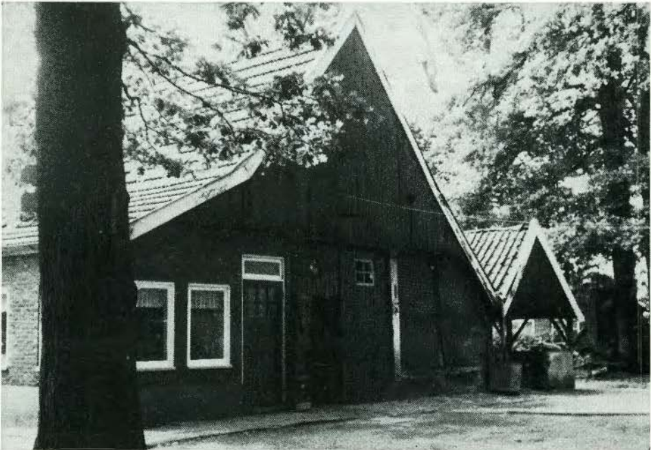
Wönnershoes op het erva Spiele (afgebroken sept. 1971)

Hagilo is door een verkleiningsuitgang gevormd van Hago, waarin we het Nederlandse 'haag' herkennen. Dit woord betekende oorspronkelijk 'omheinde, beschermde ruimte'; waarschijnlijk was dat idee van bescherming het voornaamste element in dat soort namen. Iemand die bv. Hagubald heette, zou dan 'bald' of moedig als beschermer geweest zijn, een aanvaardbare betekenis.