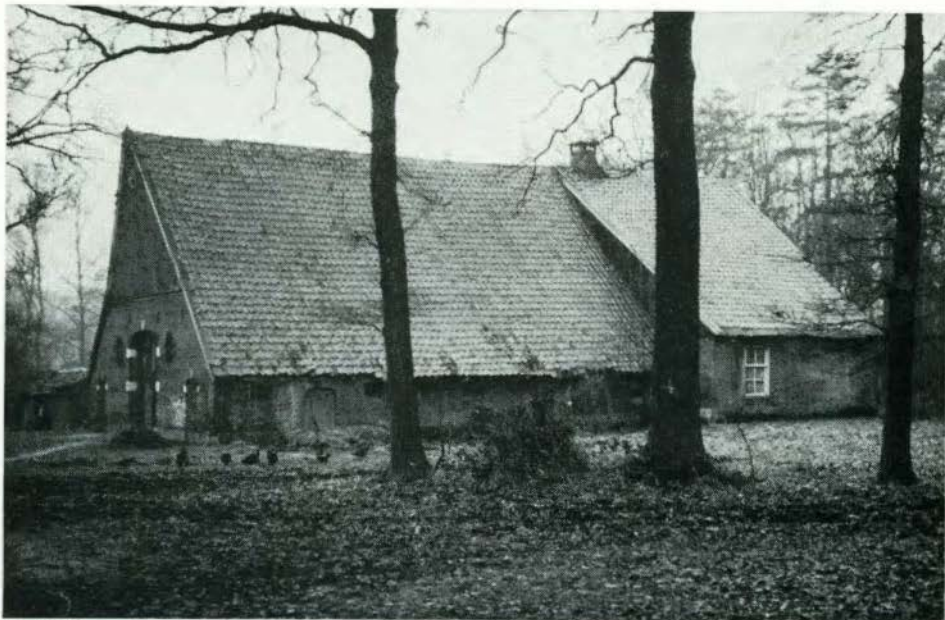
Het Wönnershoes van De Kuper

maar dit lijkt ons niet waarschijnlijk aangezien het in 1475 genoemde erve Krop in tegenstelling tot De Kuper een volgewaard erf was, terwijl dit erve Krop bovendien nog gelegen was tussen de erven Beuker en Veger in Lonneker.