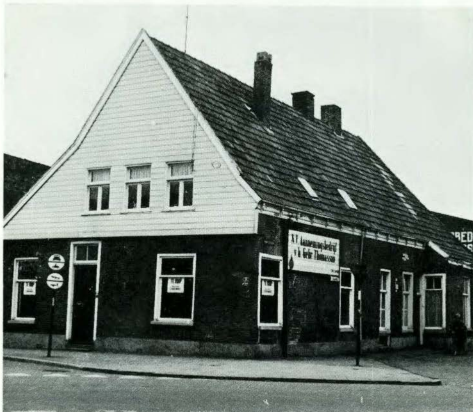
Het pand Thomasson, rechts bij de aanbouw zijn de besproken kloostermoppen verwerkt.

Het doet mij genoeg dat de Gemeenteraad van Hengelo heeft besloten om f 15.000,- uit te trekken voor 'n opknapbeurt van het pand Thomasson. Lange tijd heeft dit pand er vrij verwaarloosd bijgestaan en wat met de meeste oude panden gebeurt zou ongetwijfeld ook met dit wel bijzondere huis gebeuren n.l. om in verband met uitbreiding en herstructurering gesloopt te worden.