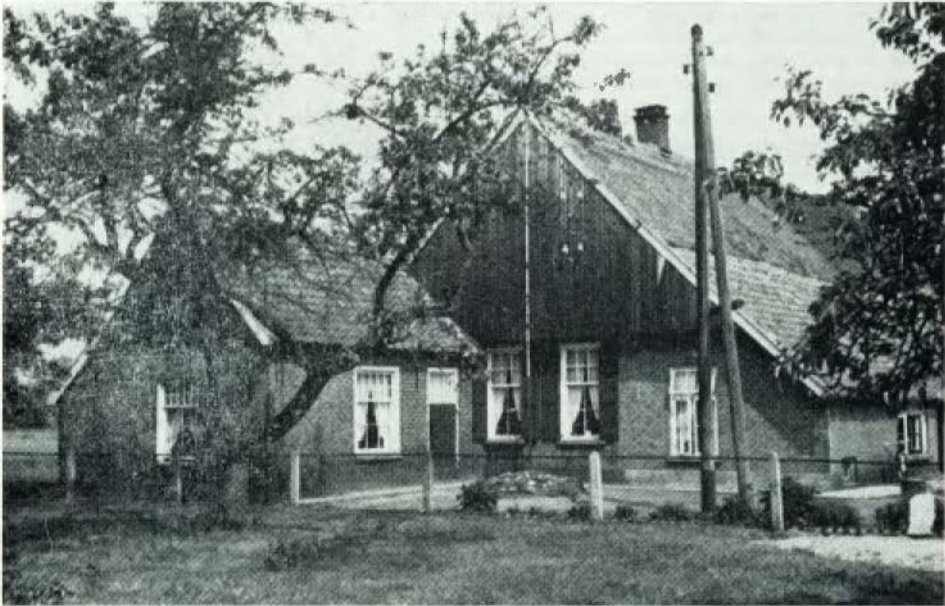
Het erve Hagreis Zeldam (Wiene)

Hiermee waren de oorspronkelijk bisschoppelijke en later keizerlijke erven provinciale of dominiale erven geworden. De pachters, in die dagen meiers genoemd, bezaten het zogenaamde erf- en bouwrecht, wat betekende, dat zij en hun erfgenamen het recht had-