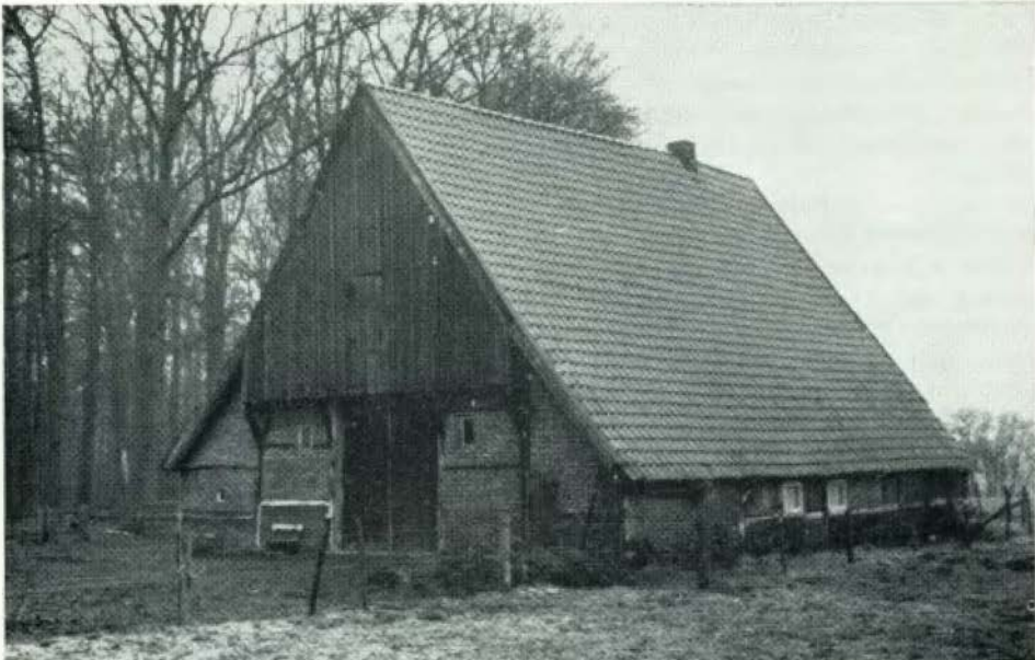
Het op de Monumentenlijst staande erve De Kuper te Lonneker

Snuif (C. J. Snuif, Verzamelde Bijdragen tot de geschiedenis van Twente), veronderstelt, dat de eveneens in het Schattingsregister genoemde boerderij Krop identiek is met De Kuper,