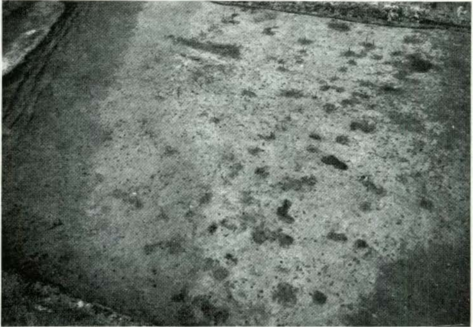
Denekamp 'De Borghert'. Twee gedeeltelijke huisplattegronden.

den namelijk een achttal veeboxen van twee meter breedte waargenomen. Dat betekent, dat de stal ruimte bood voor 16, toendertijd vrij kleine runderen. Dit aantal lijkt betrekkelijk groot voor een prehistorisch bedrijf. Mogelijk zijn daarom een aantal boxen voor andere doeleinden gebruikt, zoals voor het onderbrengen van varkens en de opslag van dierlijk voedsel. Verschillende malen zijn duidelijke ingangen, één maal met drempels, waargenomen, en wel twee brede-, enige meters achter de scheidingswand in de lange zijden tegen-