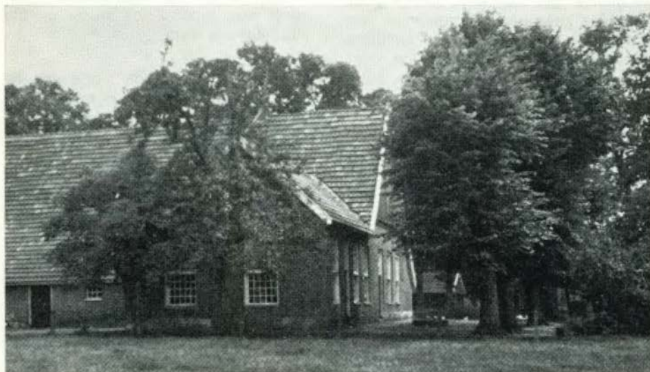
Het erve Zwartkate in de Esmarke