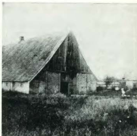
De 'Veddeler' 1924

Vanzelf vraag je direkt, wat moet dat worden en welke boerderij is er voor afgebroken. De eerste vraag is gauw beantwoord, een grote feestzaal in saksische stijl. Waar het vandaan kwam kon mij niet worden verteld.