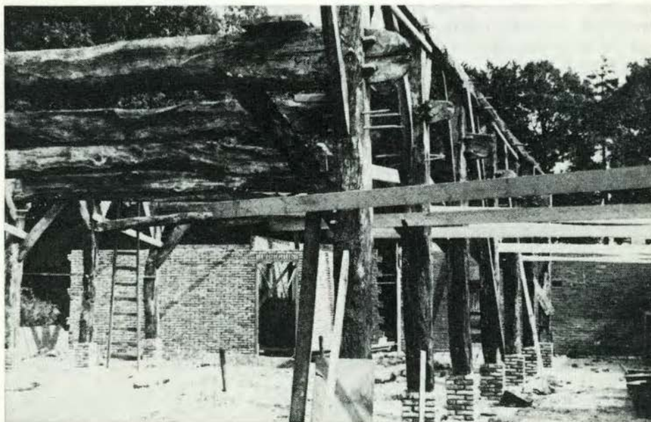
De oude gebinten te Beckum

De boerderij was bijna 300 jaar oud. H. J. Eising