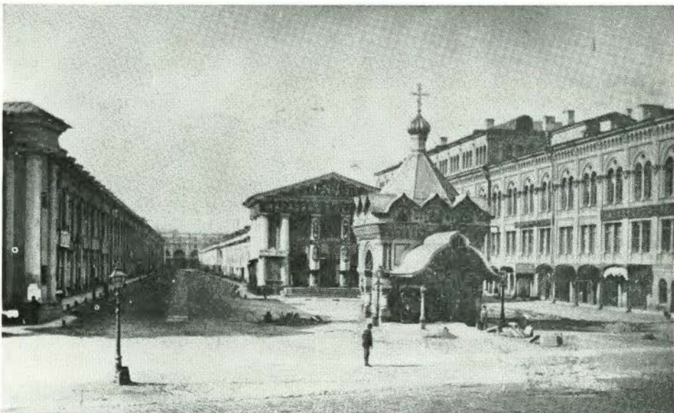
POTEMKIN met zijn schitterend gevolg verdrong zich voor de Vriezenveense winkels aan de Newski Prospekt. Links op de foto de zgn. Hollandse linie, waarin de Rusluie zich hadden gevestigd.

Nog voor de stichting van Sint Petersburg dreven de Vriezenveense kooplieden handel o.a. Oost Pruisen en de Oostzeelanden en toen ze op zoek naar nieuw afzetgebied omstreeks het begin van de 18e eeuw met hun linnen huishuishoudings-producten in de nieuwe Russische stad kwamen, moet het