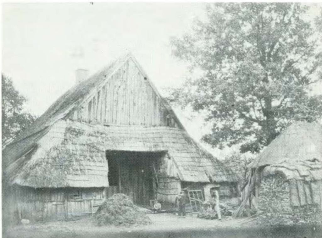
Boerderij op het erve De Hork te Buurse (gem. Haaksbergen)

Twènter laand en Leu en Lèven Aaltied wazzen ze ow leef Mag, dee van dit dreetal schreef Ow dit book dan gewwen, in de hop Dat 't um oale kunnigheid en noaber- schop Mag gevallen en i-j mangs bi-j 't lèzen In de goeë oale tied weerum magt wèzen