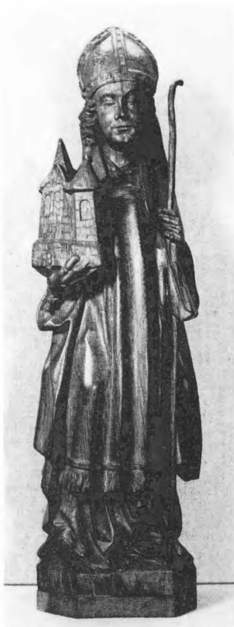
St. Liudger. Houten beeld, 16e eeuw. Propstei St. Ludgerus, Essen/Werden (Dld.)

all. 8: dat Liudger in Twente geen kerk gesticht en dat Twente nooit tot zijn missie heeft behoord, wie bewijst dat? En wie of wat bewijst het tegendeel? Er is inderdaad geen enkele oorkonde