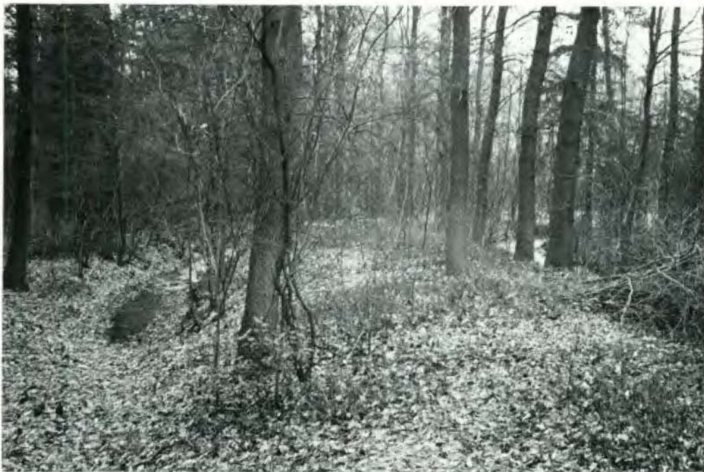
Het wallen- en grachtenstelsel aan de west-zijde.