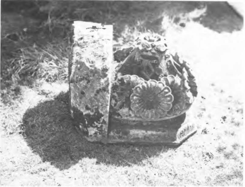
De kraagsteen, toen deze nog buiten in het gras lag.