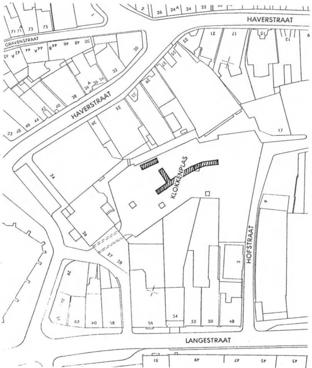
Fig. 3. Enschede, Kadastrale situatie rondom de Klokkenplas, ca. 1960. Opmeting naar G. v.d. Ziel, gem. Enschede. Zoeksleuven gearceerd.