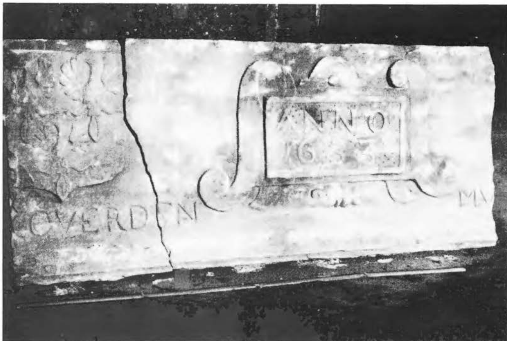
Gewelsteen 't Rouwenhorst