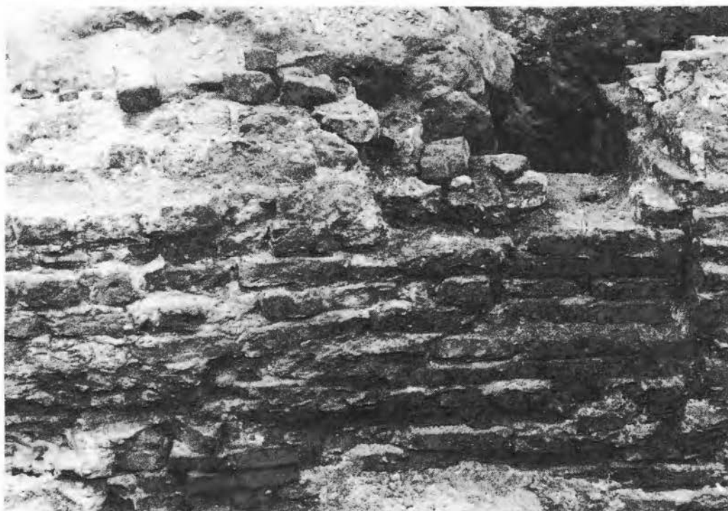
Afb. 3. Detail van de binnenzijde van de rechter poortwang: de reparatie vlak voor de blokvormige verbreding.

De smalle doorvaart is op één punt tot op de vaste grond uitgegraven. De grachtbodem bleek, evenals elders reeds enige malen gemeten was, op ca. 38,5 m NAP te liggen (exact op 38.58 m). De gracht blijkt hier dus, bij een der laagste punten van de binnenstad, slechts 2,5 m diep te zijn. In de opgraving bij het van Heekplein, een