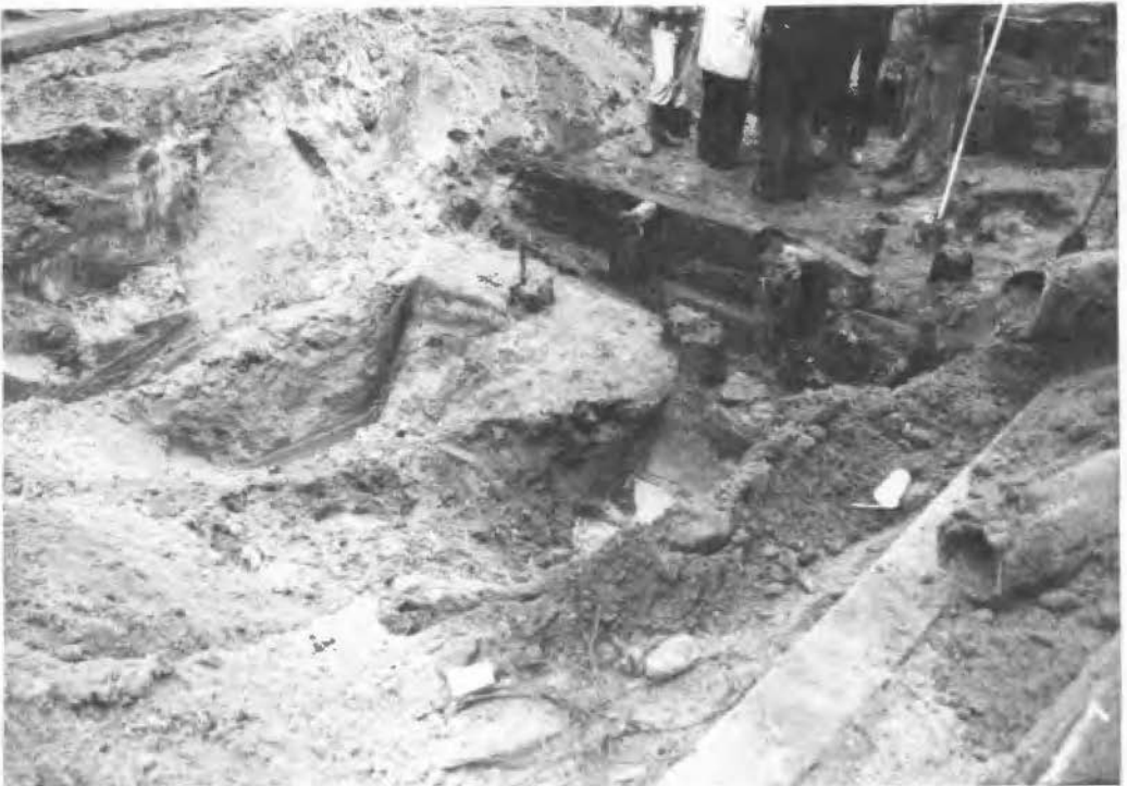
Afb. 6. Het bruggehoofd a', gezien vanaf de buitenzijde.

Het bruggehoofd a' werd gerepresenteerd door een drietal rijen vierkante heipalen, alsmede enige liggende, hoekige balken. Dit bruggehoofd lag precies op de buitenbegrenzing van de