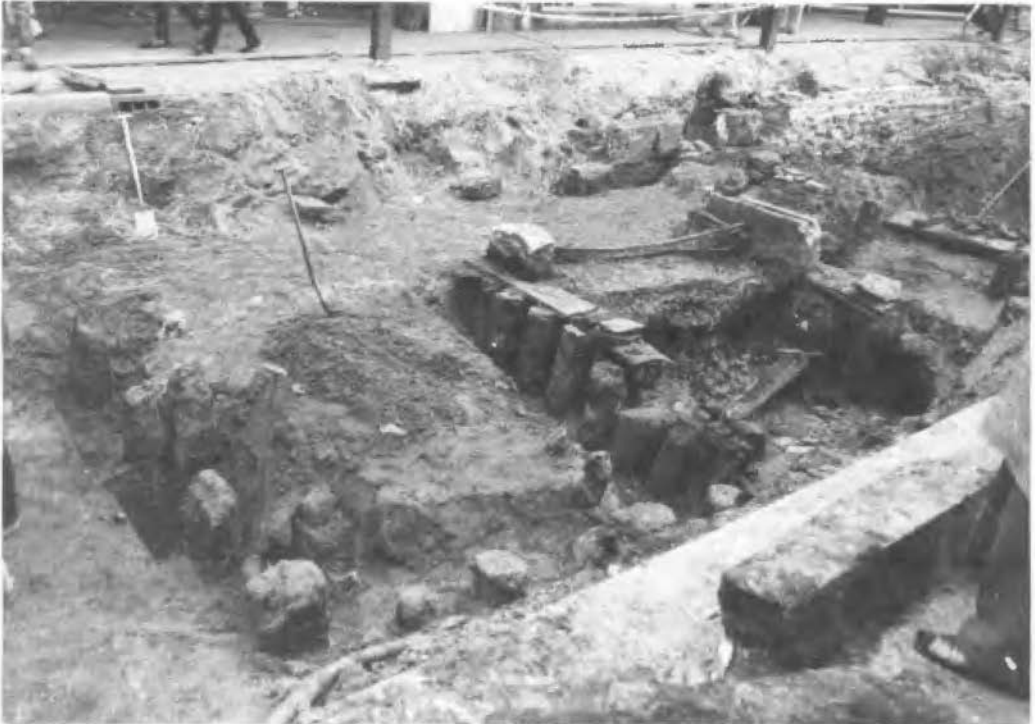
Afb. 5. De resten bij de doorvaart en links ervan beschoeiing b', gezien vanaf het linker trottoir.

der hogere punten van de binnenstad, bleek dezelfde gracht 3,75 m diep te zijn. Het is nu dan ook duidelijk geworden, dat het probleem van het hoogteverschil binnen Enschede door de gravers van de gracht is opgelost, door in hoog Enschede de gracht dieper uit te graven dan in laag Enschede, waarbij de grachtbodem overal op gelijke NAP hoogte is aangebracht (verg. 't In-schrien 1976, p. 51 en 54/55).