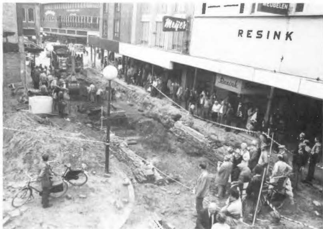
Afb. 2. Overzicht van de opgraving vanaf de stadszijde.

poortfundering, die omstreeks 1500 geplaatst moet worden. Deze tijd is mogelijk te preciseren, wanneer wij een tweetal historische gegevens bij Benthem (1920, p. 61 en 62) aanhalen. Hij vermeldt, dat in 1517 Enschede grotendeels is afgebrand en in 1518 is 'ontvestet ende ter aerden geslecht'. Op basis van deze gegevens is de bouw van een nieuwe poort kort na 1518 alleszins aannemelijk. In ieder geval echter moeten de gevonden poortfunderingen afkomstig zijn van de poort, die omstreeks 1560 op de kaart van van Deventer staat aangegeven. De gevonden funderingen kunnen namelijk zeker niet na 1560 aangelegd zijn. Het is bekend, dat de Veldpoort ná de stadsbrand van 1862 is gesloopt (van Deinse 1925, p. 355 - 358 en 298). De Veldpoort en zijn gevonden funderingen zijn dus te dateren van ca. 1520 - 1862. Er is niets gevonden van een