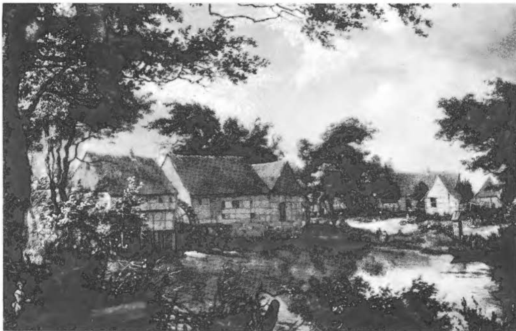
M. Hobbema, Watermolens (detail) Singraven? Dulwich College.

molens zijn alleenstaande rechthoekige gebouwen, Hobbema's molens - althans de mogelijke Singravens - zijn steeds (onderdeel van) complexen, waarbij het gebouw links van de stroom altijd een L-vormig grondvlak heeft. Er is dan ook nauwelijks een andere slotsom mogelijk, dan dat Ruisdael op de beide schilderijen in het Mauritshuis nóch Singraven nóch Haaksbergen uitbeeldde. Iets voorzichtiger gezegd: er bestaat zeker t.a.v. de Haaksberger molens geen enkele mogelijkheid, iets te bewijzen, positief of negatief.