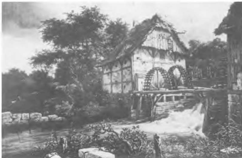
J. van Ruisdael (part. coll). Watermolen