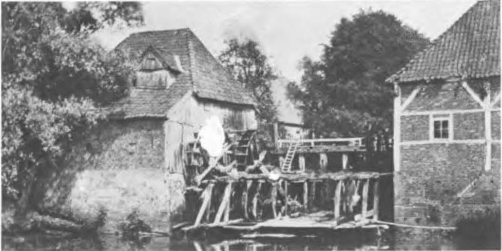
De Watermolens te Haaksbergen ± 1910

Wie de Ruisdael-tentoonstelling in het Haagse Mauritshuis heeft bezocht, heeft een keur van de mooiste denkbare schilderijen te zien gekregen en bovendien nog een groot aantal etsen e.d. Maar dat niet alleen. De belangstellende bezoeker werd ook een zaaltje getoond onder het opschrift: 'De werkelijkheid die Ruisdael zag'. Zeker de Twentse bezoekers zullen zich hier wel even de ogen hebben uitgewreven. De kunsthistorici, zich begevend op het pad van de topografie, hebben ons voorggehouden, dat Ruisdael de watermolens van Haaksbergen en de sluis van de Omvloed bij Singraven heeft geschilderd. Nee, ze zeggen of schrijven het er niet bij, maar laten het de foto's in hun plaats doen.