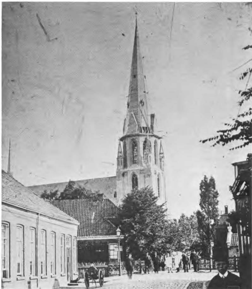
Toen de kerk in op 25 september 1894 werd ingewijd, was de torenbouw nog niet geheel voltooid. Deze foto dateert derhalve vermoedelijk van het voorjaar 1895.