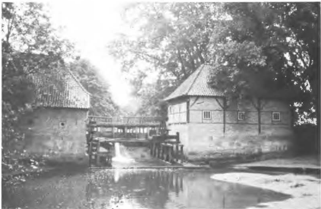
De Watermolens te Haaksbergen