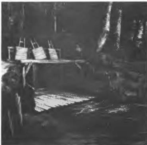
De sluis van Jacob v. Ruysdael