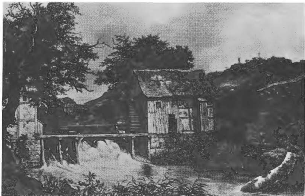
J. v. Ruisdael. (Nat. Gallery, Londen) Watermolens