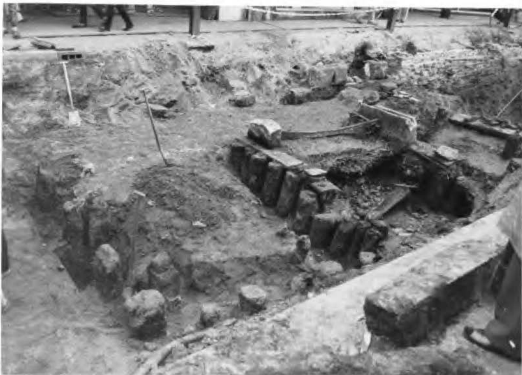
Afb. 5. De resten bij de doorvaart en links ervan beschoeiing b', gezien vanaf het linker trottoir.

der hogere punten van de binnenstad, bleek dezelfde gracht 3,75 m diep te zijn. Het is nu dan ook duidelijk geworden, dat het probleem van het hoogteverschil binnen Enschede door de gravers van de gracht is opgelost, door in hoog Enschede de gracht dieper uit te graven dan in laag Enschede, waarbij de grachtbodem overal op gelijke NAP hoogte is aangebracht (verg. 't In-schrien 1976, p. 51 en 54/55).