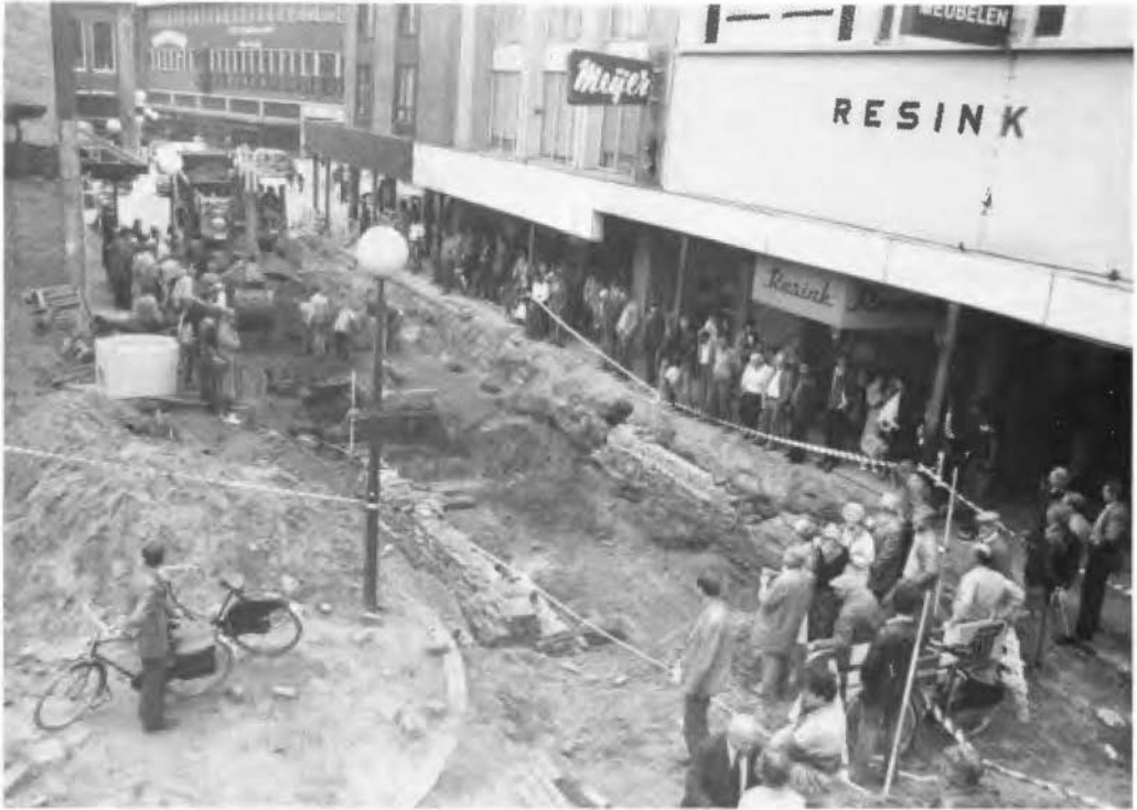
Afb. 2. Overzicht van de opgraving vanaf de stadszijde.

poortfundering, die omstreeks 1500 geplaatst moet worden. Deze tijd is mogelijk te preciseren, wanneer wij een tweetal historische gegevens bij Benthem (1920, p. 61 en 62) aanhalen. Hij vermeldt, dat in 1517 Enschede grotendeels is afgebrand en in 1518 is 'ontvestet ende ter aerden geslecht'. Op basis van deze gegevens is de bouw van een nieuwe poort kort na 1518 alleszins aannemelijk. In ieder geval echter moeten de gevonden poortfunderingen afkomstig zijn van de poort, die omstreeks 1560 op de kaart van van Deventer staat aangegeven. De gevonden funderingen kunnen namelijk zeker niet na 1560 aangelegd zijn. Het is bekend, dat de Veldpoort ná de stadsbrand van 1862 is gesloopt (van Deinse 1925, p. 355 - 358 en 298). De Veldpoort en zijn gevonden funderingen zijn dus te dateren van ca. 1520 - 1862. Er is niets gevonden van een