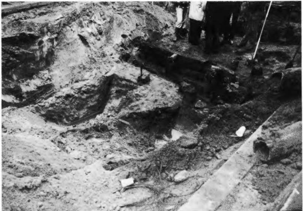
Afb. 6. Het bruggehoofd a', gezien vanaf de buitenzijde.

Het bruggehoofd a' werd gerepresenteerd door een drietal rijen vierkante heipalen, alsmede enige liggende, hoekige balken. Dit bruggehoofd lag precies op de buitenbegrenzing van de