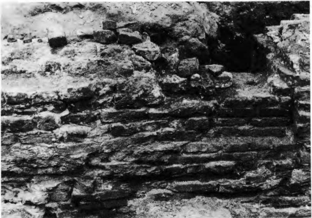
Afb. 3. Detail van de binnenzijde van de rechter poortwang: de reparatie vlak voor de blokvormige verbreding.

De smalle doorvaart is op één punt tot op de vaste grond uitgegraven. De grachtbodem bleek, evenals elders reeds enige malen gemeten was, op ca. 38,5 m NAP te liggen (exact op 38.58 m). De gracht blijkt hier dus, bij een der laagste punten van de binnenstad, slechts 2,5 m diep te zijn. In de opgraving bij het van Heekplein, een