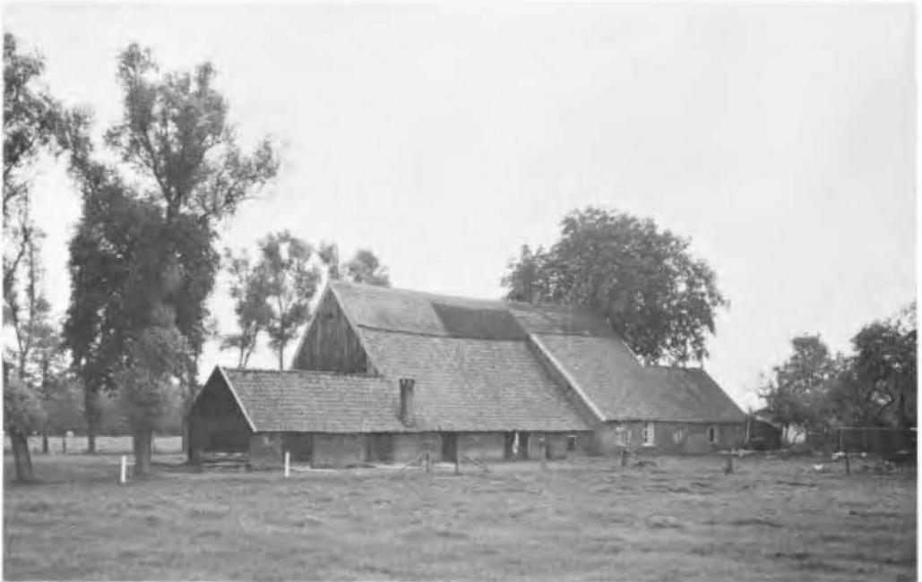
Het erve Houwhedde, Kerspel Goor.

Het erve Houwhedde ligt tegenwoordig in de buurtschap Kerspel Goor, gem. Markelo (Fam. ten Thije, Oude Needseweg).