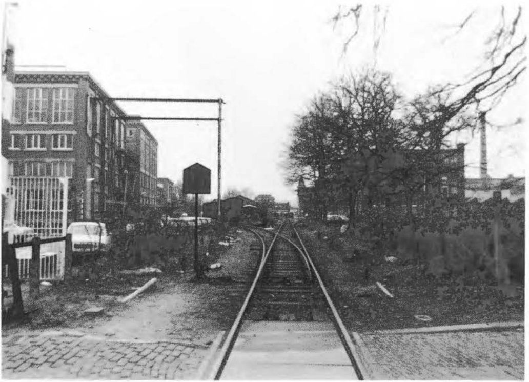
foto 3 Enschede, vm spoorlijn Enschede-Haaksbergen met fabrieksporen naar de vm spinnerij Oosterveld (links) en naar het kompleks Rigtersbleek (rechts). Foto: Wim de Natris 1976.