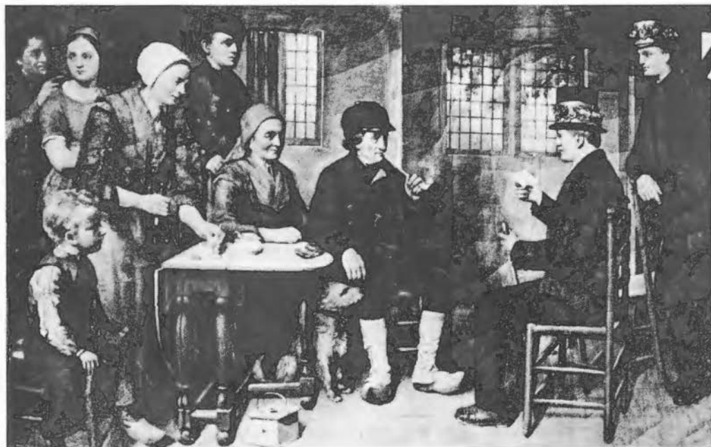
Het schilderij 'Brulften Neugers' door L.J. Bruna in 1868 geschilderd. Dit doek geeft een karakteristiek beeld van de klederdracht en het interieur omstreeks 1870, waarbij o.a.a de typische versiering van de hoeden opvalt.

In mijn bezit is een knipmuts van een vrouw uit de stad, die deze tot haar dood, in 1943, heeft gedragen. De mode was (dat blijkt bij vergelijking met Bruna's doeken) intussen wel veranderd, maar Twente, zelfs een grote stad als Enschede dus, behoorde tot de gebieden met een levende klederdracht. Nog geen halve eeuw later is het beeld totaal anders geworden. Alleen in Rijssen zie je de dracht nog als onderdeel van het normale dagelijkse leven, maar dan wel als