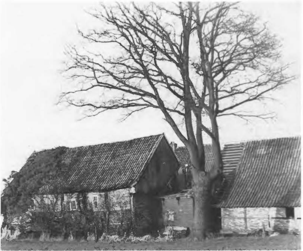
Foto 1: Vicarie Weerselo. Foto T. Hesselink-v.d. Riet, jan. 1984.

Maar omdat ze zo hard gezwoegd hadden, ontving de eerste 10 hornse guldens en de tweede die later kwam, twee philipsguldens en een paar nieuwe schoenen. Drie à vier knechten kwamen proberen om pannen te maken, hetgeen zwaar werk was. De klei werd eerst met voeten getreden en daarna met de hand gekneed, om ze geschikt te maken voor dakpannen.