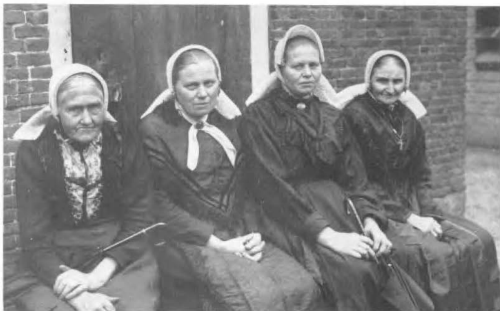
Een viertal boerinnen uit Saasveld.

wit, zachtblauw of blauwgroen in verscheidene tinten kan vertonen. Dat het verschil in mutsontwikkeling soms een keuze was van persoonlijke smaak, valt niet te ontkennen. De foto van een viertal boerinnen uit Saasveld toont dit. De twee middelste dames lijken zusters te zijn. Klaarblijkelijk koesterden zij niet dezelfde gedachten over het al of niet meegaan met de nieuwe mode, de voorstrook te verhogen. Bij de retraitegroep toont ook het dragen van sieraden verschil. Dit is een kwestie van welstand. Ook spreekt welstand een woordje mee in het gebruik van kantbreedte en kantsort. Wie 't breed heeft kan 'breed laten hangen'. Katoenen machinale kant was voor de geldelijk minder bedeelenden. Smalle echte kloskant konden de wat beter gesitueerden zich veroorloven en de brede tot zeer brede kanten waren voor de 'dikste' boeren en hen die dachten ertoe te behoren. Van een boerin onder Twikkel en van zijn grootmoeders nicht Siena Wooldrik-Klein Wiecherink van de Zweerinkhoekweg in Enschede heb ik een zeer rijke