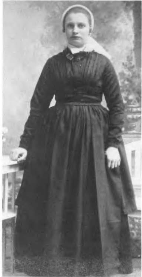
Een Rijssense jonge vrouw in 't beste pak, met zwart zijden schort (± 1927).

werken. Met haar is een van de bekwaamste mutsenopmaaksters verdwenen. Niet alleen hield ze zich bezig met de Rijssense mutsen, vele draagsters en verzamelaars wisten de weg naar haar te vinden. Dat heeft ertoe bijgedragen, dat deze vrouw eigenlijk wel alle typen knipmutsen en niet te vergeten plooiemutsen, kaapjes enz. onder haar vingers door heeft laten gaan en wel uit heel Overijssel en half Gelderland. Ik heb weinig mutsenwerk gezien, dat kan wedijveren met het hare. Ze had een enorm gevoel voor alle soorten kant en stof, dat in de mutsen verwerkt was. Het