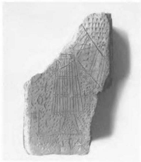
Foto 2: Kloostermop Vicarie. Foto T. Hesselink-v.d. Riet, 9-4-1984.

Dr. J. Hollestelle schrijft in 'De Steenbakkerij in de Nederlanden tot omstreeks 1560' op blz. 24 over de gereedschappen van de vormer. Om de overtollige aarde weg te strijken van de vorm werd een strijk-