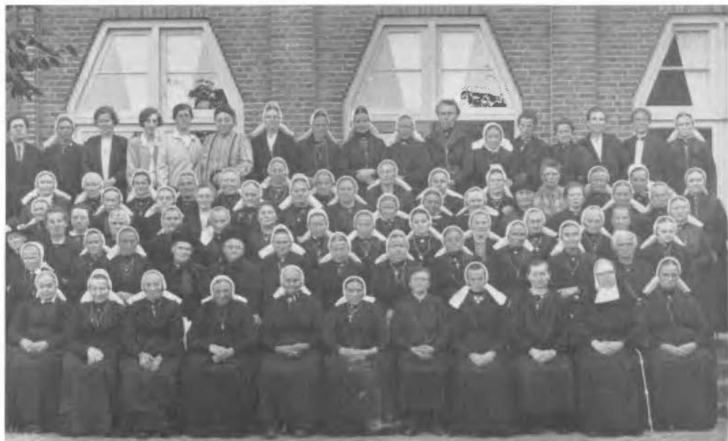
Oktober 1933. Een scala aan Twentse mutstypen op deze vrouwenretraite in 't klooster te Isidorushoeve bij Haaksbergen.

Hoe groot de verscheidenheid aan knipmutstypen gaat worden, is niet te zeggen. In 1933 was er in het klooster in Isidorushoeve een vrouwenretraite. Welgeteld staan er op de foto 56 vrouwen met 'de muts'. Verschillen in voor- en achterstroken te over. En dan vertelt de foto nog niets over het kleurgebruik in de tule, welke gestippeld, effen, dubbel, enkel kan zijn, en