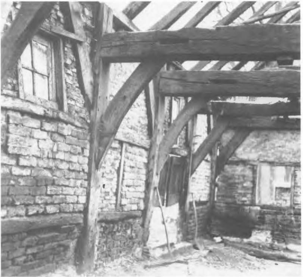
Foto 3: interieur Vicarie Weerselo.

hout gebruikt. Mogelijk is het horizontale voorwerp over het lichaam van de man op de steen een strijkhout met rechtsonder een kleivorm.