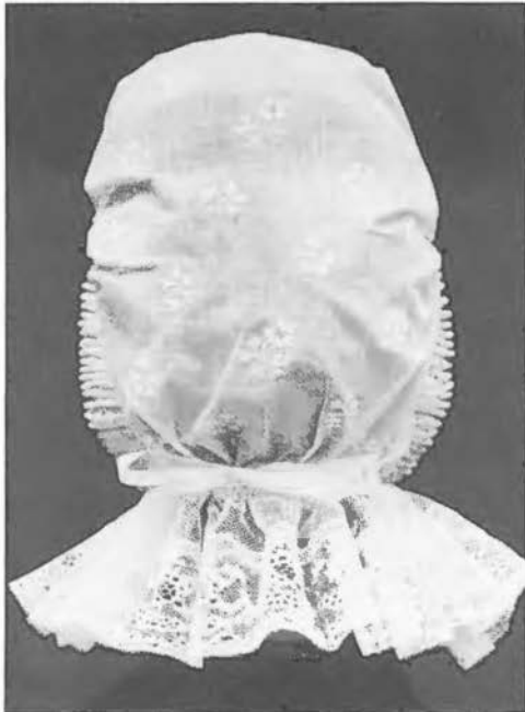
Achterzijde van een cornet van oud model met hoge bol.

sprak dan van 'hoge' en 'lage' knippen, naarmate de plooiën resp. meer of minder diep waren. Hoewel wij in Twente de naam 'cornetmuts' niet bewust hebben afgeschaft is hij toch bij ons verdwenen. Alleen het vissersdorp Huizen in 't Gooi kent de naam 'cornet' tot op de huidige dag, want tussen de oorijzermutsdragende vrouwen aldaar lopen tot heden nog 5 of 6 vrouwen met 'cornet', die tot het typische Huizer model is geëvolueerd.