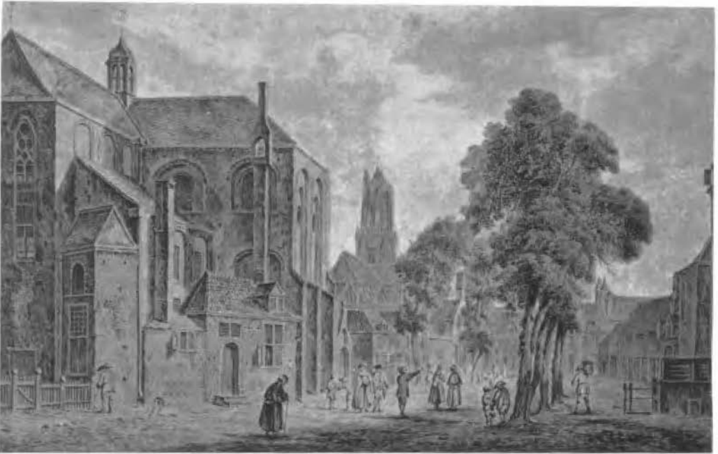
Gezicht op de St. Pieterskerk te Utrecht met het Pieterskerkhof. Op de achtergrond de Dom.

Aquarel uit 1774 van Pieter van Liender. (Gemeentelijke archiefdienst Utrecht, nr. I.b.3.17.)