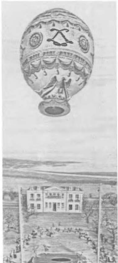
Opstijging dd. 21-11-1783 in het Bois de Boulogne door Pilâtre de Rozier en een passagier. De ballon was, volgens het principe van de gebroeders Montgolfier, met hete lucht gevuld. Het uitstapje boven Parijs liep goed af.