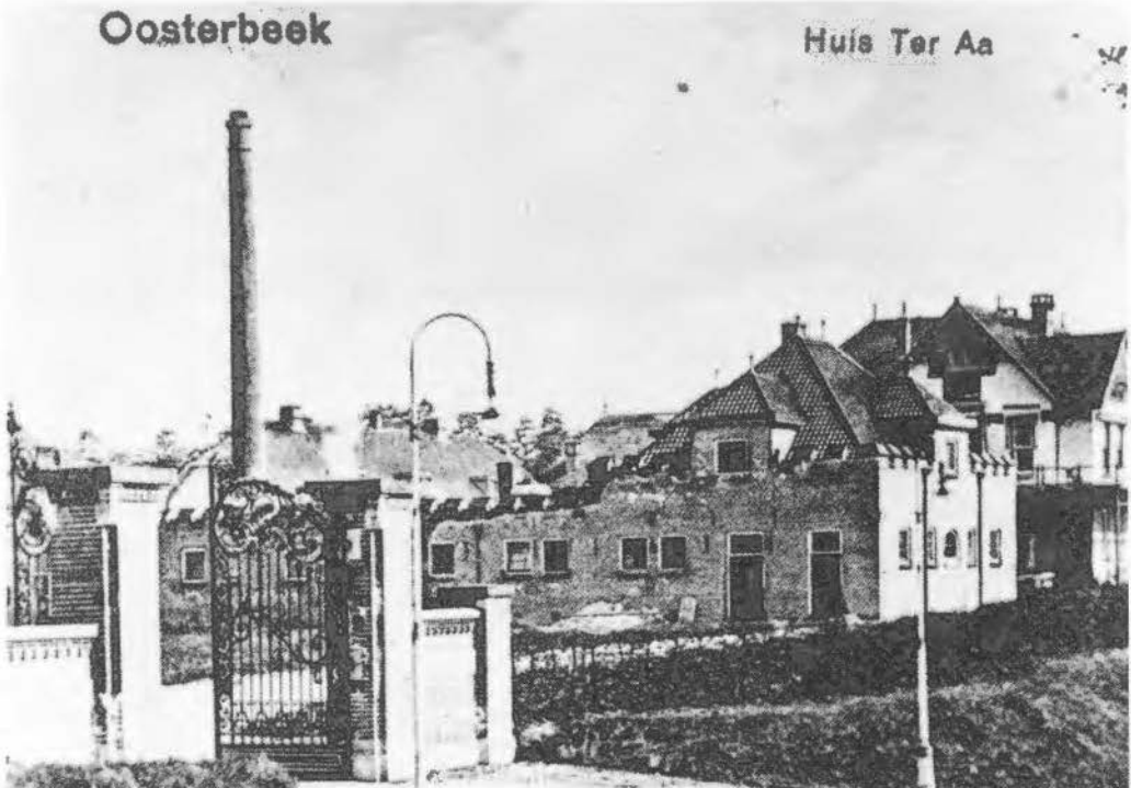
Oosterbeek Huis Ter Aa Poort van Huis ter Aa, Oosterbeek ± 1914. Reproductie Herman Dalenoort. Ansichtkaart ± 1914 Heveadorp (Vredestein).

Bij het jaarlijkse uitstapje van de 'platte-landsvrouwen' te Usselo werd besloten het nuttige met het aangename te verenigen, met een tochtje naar Arnhem, de 'Bedriegtjes' in het park Rozendaal en de Westerbouwing, (dit vaste patroon van 'pot-verteren' der diverse verenigingen was voor de 2e wereldoorlog zeer bekend!) en daarmee de 'bezichtiging' van de Hevea-fabriek. In de nabijheid van de Westerbouwing lag deze fabriek en daar, op het fa-