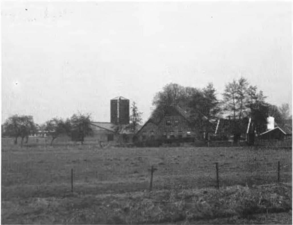
'Wilderinck' vanuit het zuiden.

In het Markeboek van Woolde 3) komt men het erve Wilderinck door de jaren heen zeer regelmatig tegen, terwijl tot 1837