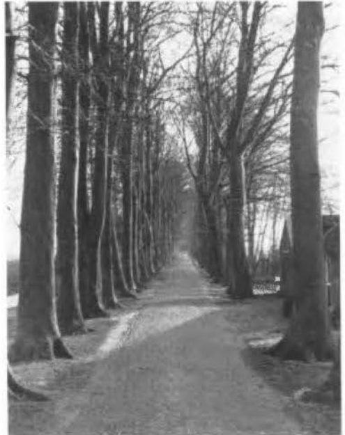
Beuken oprijlaan naar het kerkje Kolderveen-Dinxterveen. (aan het einde de kerkdeur).