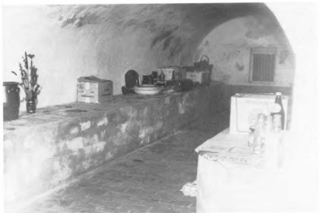
De rechter bierkelder van boerderij Het Molenbeld bij Haaksbergen.

De oudste vermelding van bier in Twente dateert voor zover mij bekend uit de late middeleeuwen (men bedenke wel, dat ik hiernaar geen systematisch onderzoek heb verricht). In 1469 is er sprake van Deldens bier 'in eene aantekening in een oud handschrift, waarbij tegen betaling van een ton 'Deldenner Hoppe' op het eerstvolgende holtgericht onder leiding van den Markerigter Johan van Twickelo door de gemeene erfgenamen van de Marke van Delden toestemming gegeven