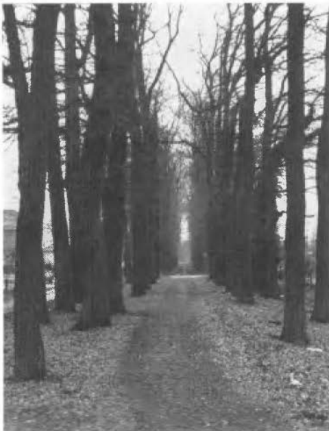
Dubbelrijige eiken oprijlaan naar erve 'Wilderink'.

De afgevaardigden behoefden dus uitsluitend te constateren dat de autographa aanwezig waren.