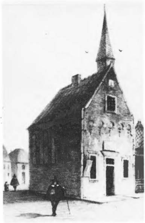
Hend. Klijn. Het oude stadhuis te Goor, vóór 1854. (Particulier bezit).

Al met al bleef de hoeveelheid tekenwerk tot 1900, van hoeveel kunstenaars ook afkomstig, overzichtelijk. Bij lange na is ook niet alles tentoongesteld, het zou hier en daar het toch al wankele evenwicht nóg meer hebben verstoord. Ook is er nog