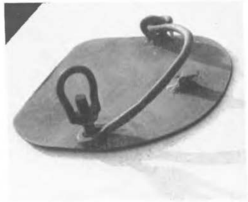
Houten plank met ijzeren hekje. v.d. heer Rekers-Tilligte.

In de (bijna Twentse) gemeente Eibergen (Rekken) gebruikte men vroeger – en dat is zo tot in het begin van deze eeuw geweest – trippen met een, de hoeven omsluitend, leren bovenstuk op een houten zool. Dit