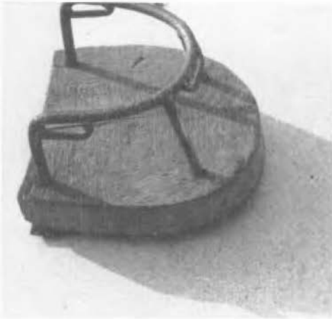
Ijzeren plaat met scharnierende beugel. (Vriezenveen).

maar ook in de Hollandse polders zijn ze – vooral in de vorige eeuw – veel gebruikt.