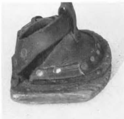
Leren bovenstuk op houten plank. (Duits grensgebied).

Stichting Twickel en het Museum van Historische Landbouwtechniek in Wageningen.