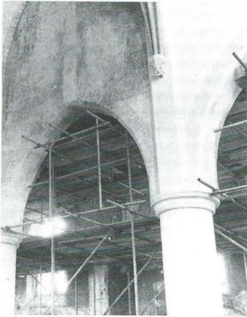
Ned. Herv. Kerk in Winterswijk. Interieur naar het noordwesten (oosterlijke traveeën middenbeuk) tijdens de restauratie van 1967-1972.

'aansluiting (zochten) bij de gotiek van de 15de en 16de eeuw en dan nog voornamelijk in zijn regionale Nederrijnse vorm, waarin de gedrukt basilicale opbouw en de hallekerk overheersen.' 7)