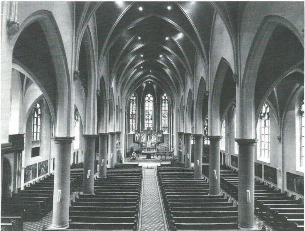
R.K. Kerk te Delden. Interieur naar het noorden. Toestand 1964-1983.

De bestaande Nederlands Hervormde kerk te Winterswijk is in verschillende fasen tot stand gekomen: ca. 1470-1474 werd het koor gebouwd, omstreeks 1480 het schipgedeelte van twee traveeën lengte, dat aansluit aan het koor, en omstreeks 1490 het daaropvolgende schipgedeelte van drie traveeën lengte; in 1507 werd be-