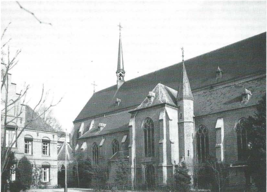
R.K. Kerk te Delden vanuit het zuidwesten.

De dateringen van deze bedehuizen zijn intussen een eeuw opgeschoven, zodat Rosenberg terecht kan zeggen, dat Van Heukelum en zijn kring, die zich naar goed middeleeuws gebruik met de naam 'St. Bernulphusgilde' hadden getooid,