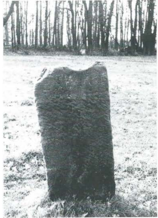
Andere zijde van de eerder afgebeelde steen.

Een en ander is reden tot een onderzoek dat de Oudheidkamer Twente dezer da-