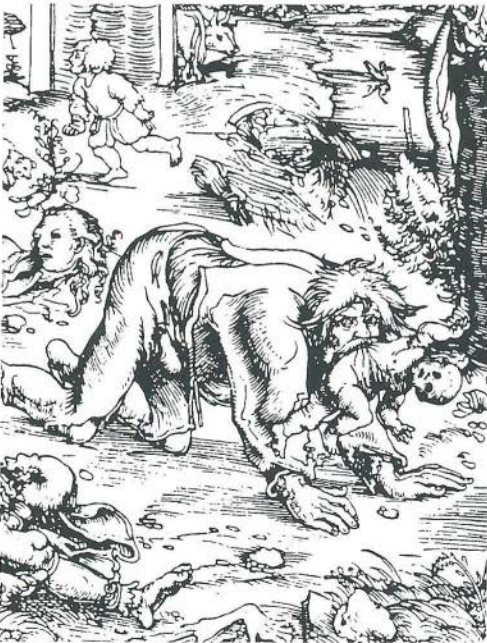
Deze houtsnede uit 1512 heeft als onderwerp een weerwolf ('Der Waldgänger') en is gemaakt door Lucas Cranach. De voorstelling richt zich op het aspect van kinderrover.

Het gaat hierbij om het bij elkaar brengen van de tot nu toe schaarse publicaties in samenhang met nieuw materiaal. Deze eerste inventarisatie zou vervolgens een