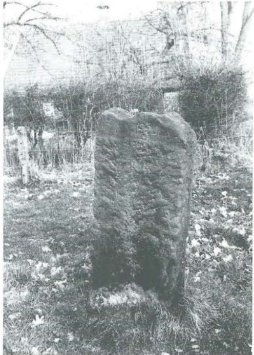
Grenssteen, waarop te lezen: ESMARK, ter eenre en TWEKLO, ter andere zijde. (Nabij: Van Heeksbleeklaan te Enschede).

De markeringen, aangebracht bij onze provinciale grenzen, hebben al een decoratieve functie in het landschap, evenals de schilden aan de gemeentegrenzen, die