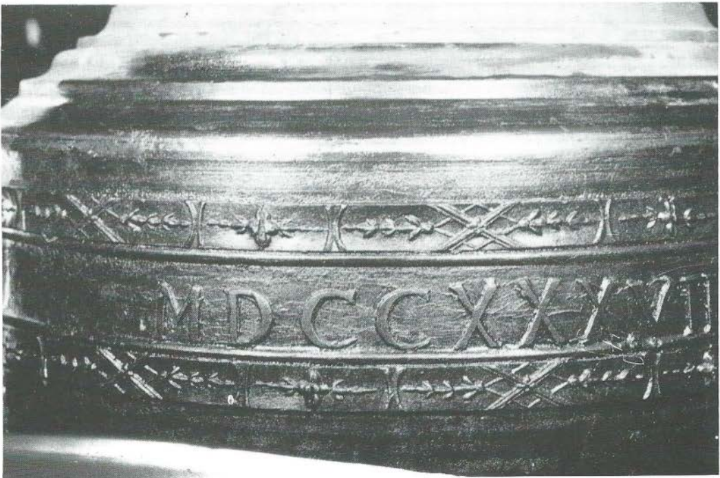
Friezen van twee der in 1943 geroofde klokken te Markelo. II.

1. De klok met toonhoogte e1, die zuidelijk