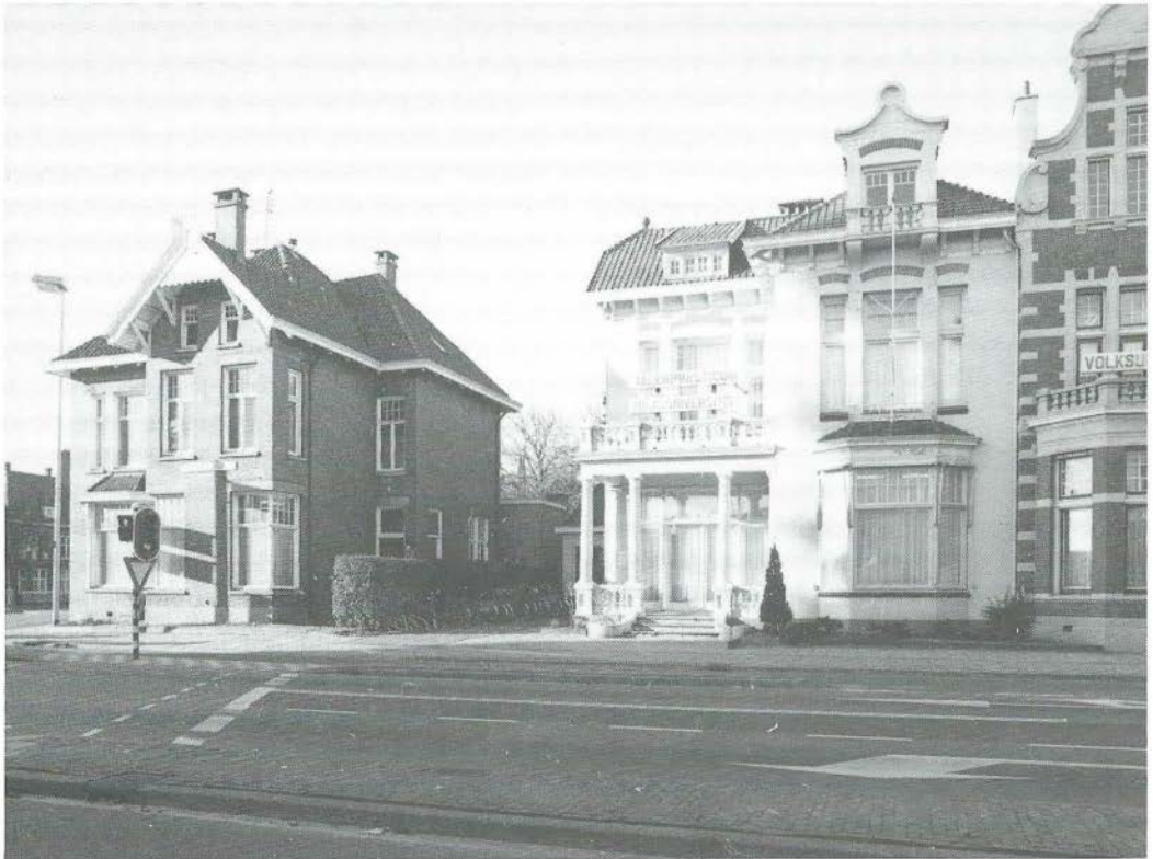
'Herenhuizen' Haaksbergerstraat 68 (hoek Ripperdastraat), 66 en 64 (gedeeltelijk), Enschede (resp. 1911, 1905 en ?). Arch.: G. Beltman AGz. Foto: R. Kampman Almelo 7-12-'87.

Okerbruin geglazuurde baksteen is eveneens toegepast boven de ingang en ramen van hoekhuis nr. 68. Hier kan men echter niet van ontlastingsbogen spreken omdat de openingen een zuiver rechthoekige vorm hebben en worden overspannen door strekken van grijsgele natuursteen, waarop een rollaag van geglazuurde baksteen 'rust'.