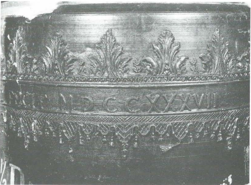
Friezen van twee der in 1943 geroofde klokken te Markelo. I.