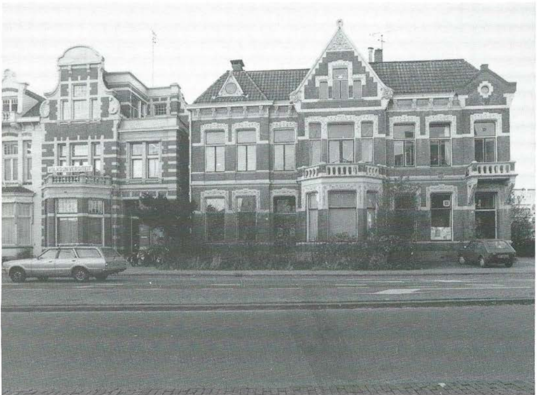
'Herenhuizen' Haaksbergerstraat 66 (gedeeltelijk), 64, 62 en 60, Enschede (resp. 1905, ?, 1901 en 1900). Arch.: G. Beltman AGz. Foto: R. Kampman Almelo 7-12-'87.