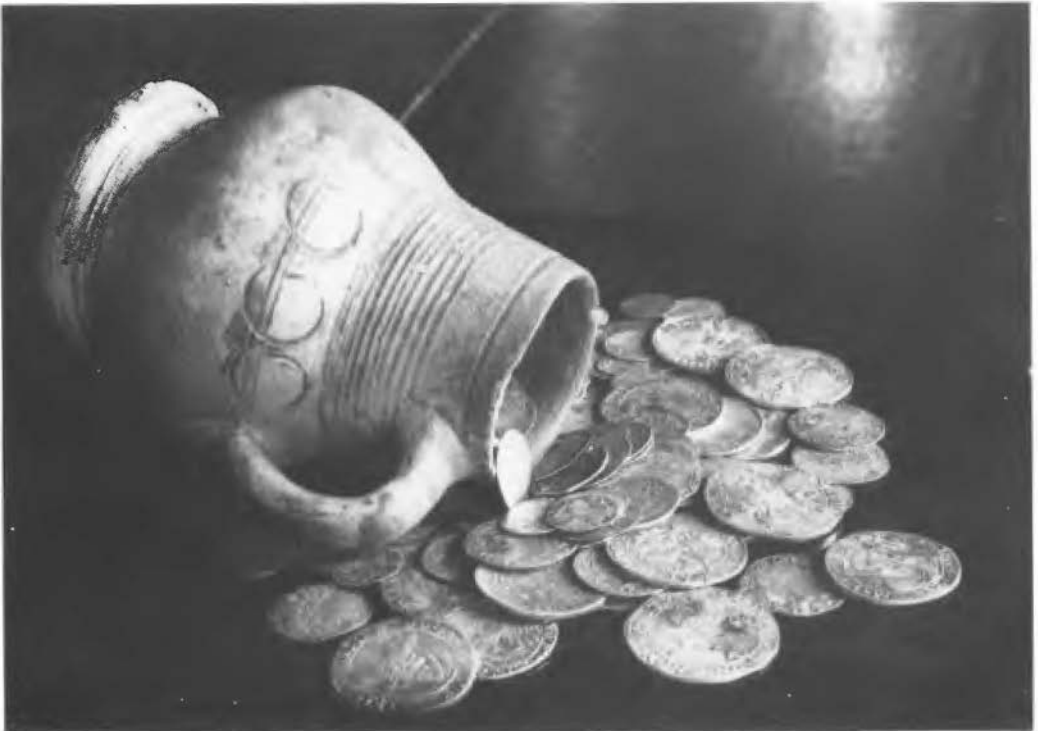
De muntvondst van Buurse, gem. Haaksbergen.