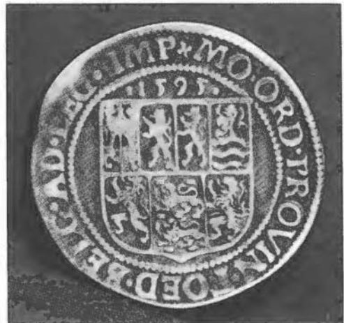
Leicester Daalder of Unie Rijksdaalder, achterzijde.

Voorzijde: Concordia Res Parvae Crescunt . Kleine dingen groeien door eendracht.