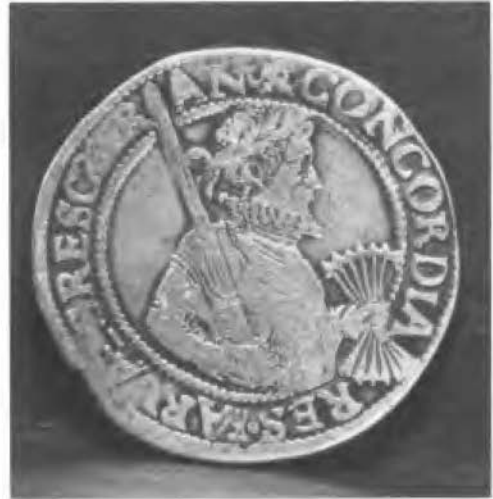
Op de omslag: Leicester Daalder of Unie Rijksdaalder, geslagen in 1595.

Voorzijde: Concordia Res Parvae Crescunt . Kleine dingen groeien door eendracht.