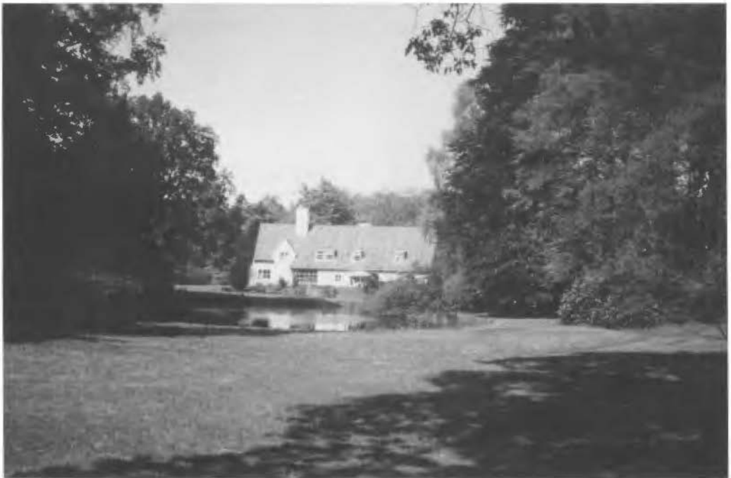
Landhuis met vijver in het Oldenzaalse Veen

Voor het voeren van dit proces had de gemeente n.l. goedkeuring van Gedeputeerde Staten nodig en dit college geeft duidelijk te kennen dat het de kansen op succes uitermate laag inschat en weigert de goedkeuring te verlenen. Maar het Oldenzaalse uithoudingsvermogen kent geen grenzen. Men gaat in beroep bij de Kroon en met succes. G.S. moet alsnog haar goedkeuring verlenen en dit besluit komt