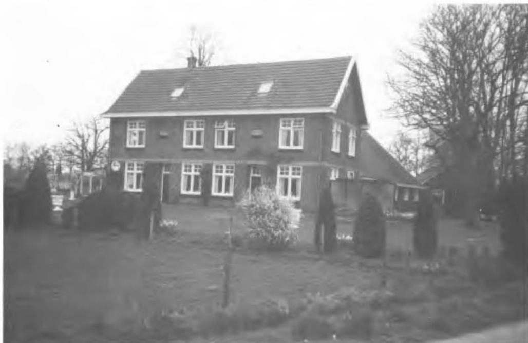
Boerderij Lubberink te Boekelo, Ganzenbosweg 80. Eig. H.B.J. Slaghekke