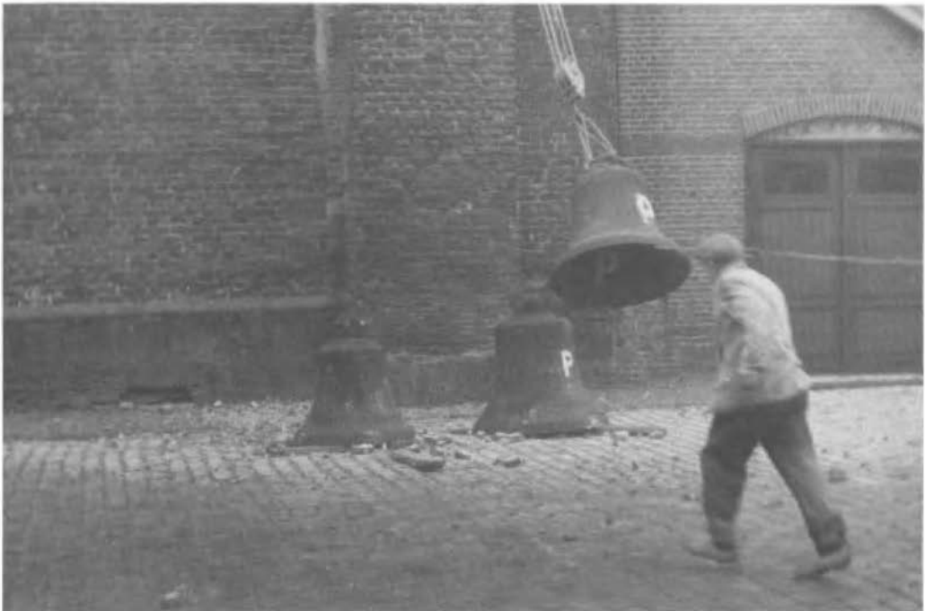
Het verwijderen van de klokken uit de St. Maartenstoren te Losser.

De heer Hijzeler werd op 7 augustus 1902 te Winterswijk geboren. Hij studeer-