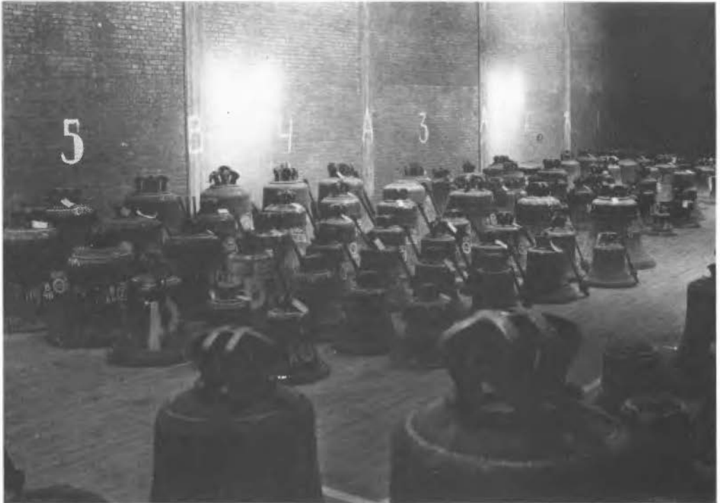
Carillonklokken uit de St. Georgiuskerk, te Almelo opgeslagen en met een 'P' gemerkt.