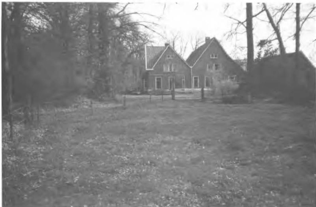
Boerderij Overbeek te Tweekelo, Gerinkhoekweg 31. Eig. G.H. Overbeek