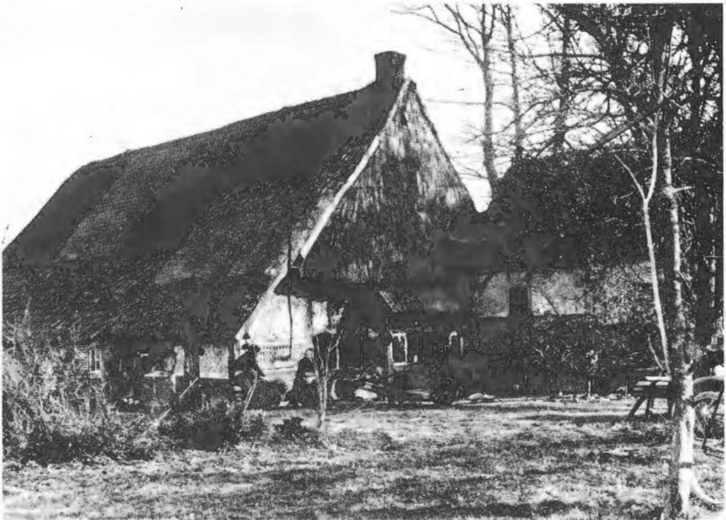
Schöppert of Wilms in Tilligte. Situatie in 1910, kort voor de afbraak. Aanzicht van het gehele boerenwoonhuis.