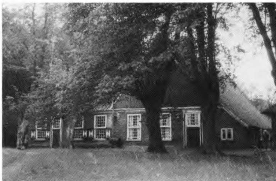
Boerderij 't Berenbroek

Het is, gemeten naar de belastingaanslag, iets groter dan het 'Groote Berenbroek'.