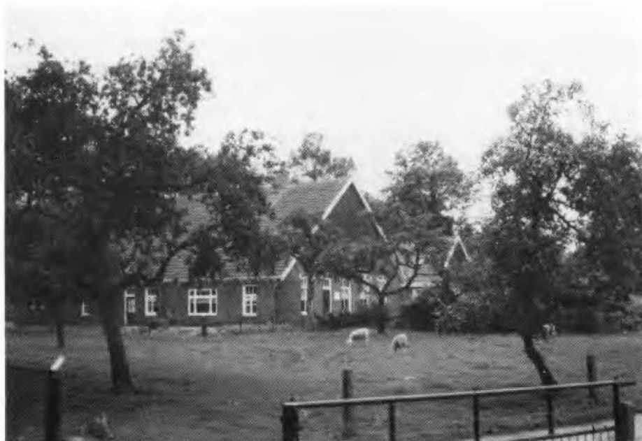
De huidige boerderij de Arends, Arendsweg 60

Op 11 oktober 1750 doet Berenbroek evenwel 'uitleijdinge tegen al zodanige inleijdingen door de Praebsdij van St. Lebuïnus ondernomen' 5). En hij, dat wil zeggen zijn advocaat, komt goed beslagen ten ijs. In de eerste plaats wil hij vaststellen dat onder het gericht Enschede 2 erven met de naam Berenbroek bekend zijn, namelijk het Groote en het Kleine Berenbroek.