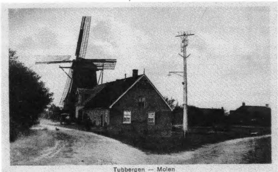
Afb. 1 Ansichtkaart uit plm. 1900 van de molen en het in 1849 gebouwde molenaarshuis. Uiterst rechts is het huis Veldwijk te zien.