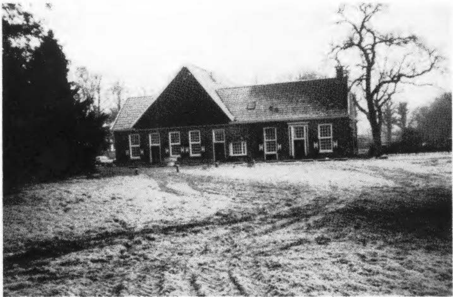
Boerderij 't Smalenbroek