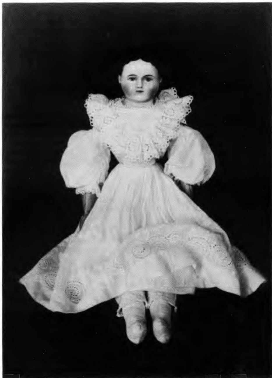
Porceleinen pop in witte jurk, een lady- of fashiondoll