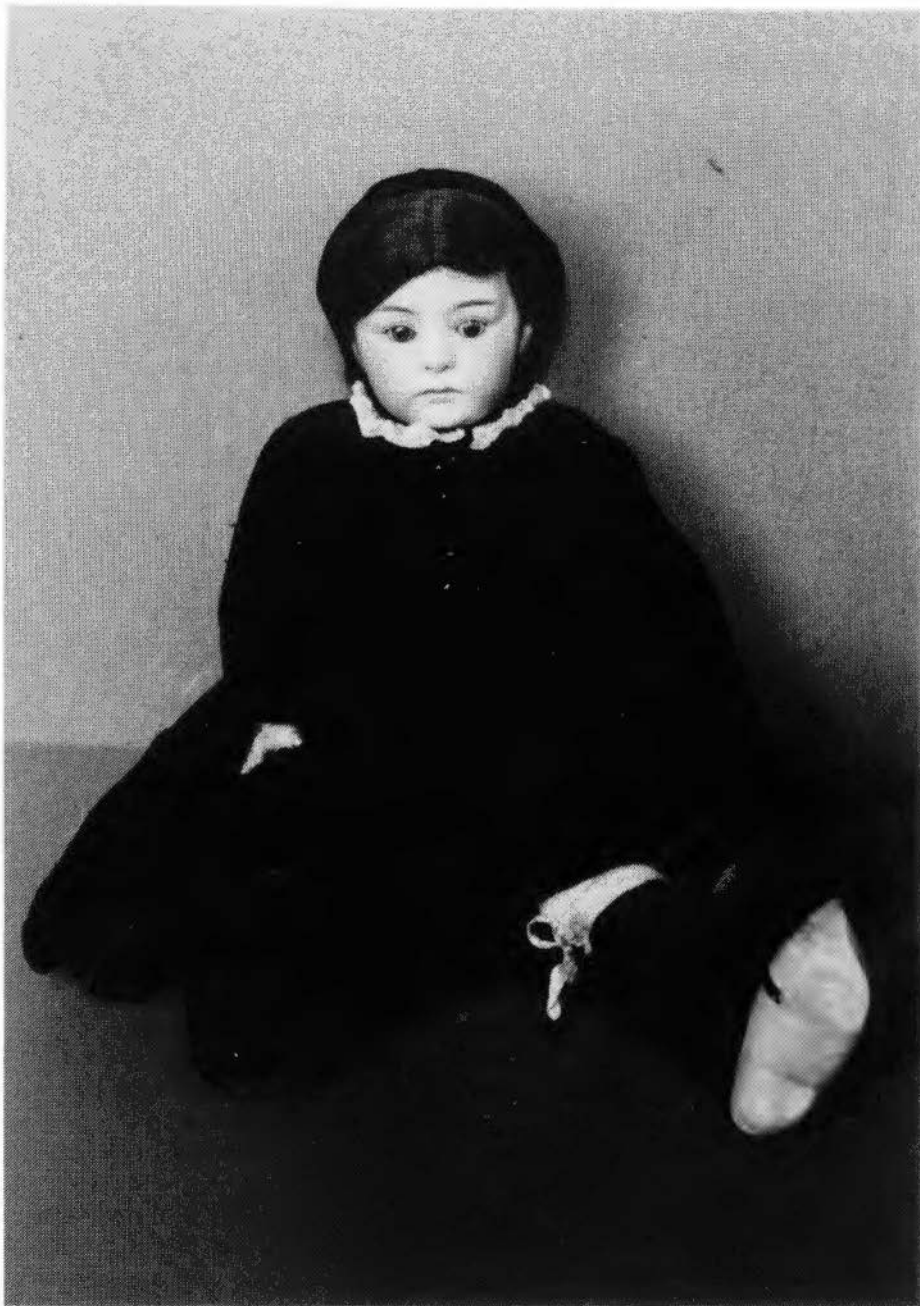
Porceleinen pop in klederdracht, gemaakt door Gebr. Neubach