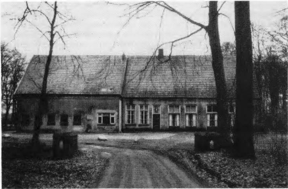
Hof Espelo, situatie 1969.