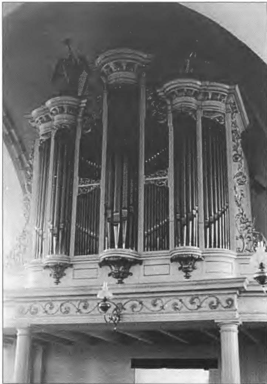
Het orgel in de Hervormde Blasiuskerk te Delden.