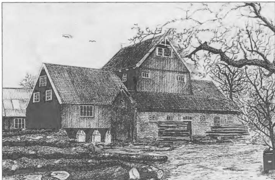
Aquarel door W.J. Bitter, ca. 1880

De molen, die vooral in het zomerseizoen vele toeristen trekt, is te bezichtigen elke dinsdagmiddag van 13.30 – 16.00 uur en elke zaterdagochtend van 10.30 – 12.30 uur. De vrijwilligers geven dan uitleg.