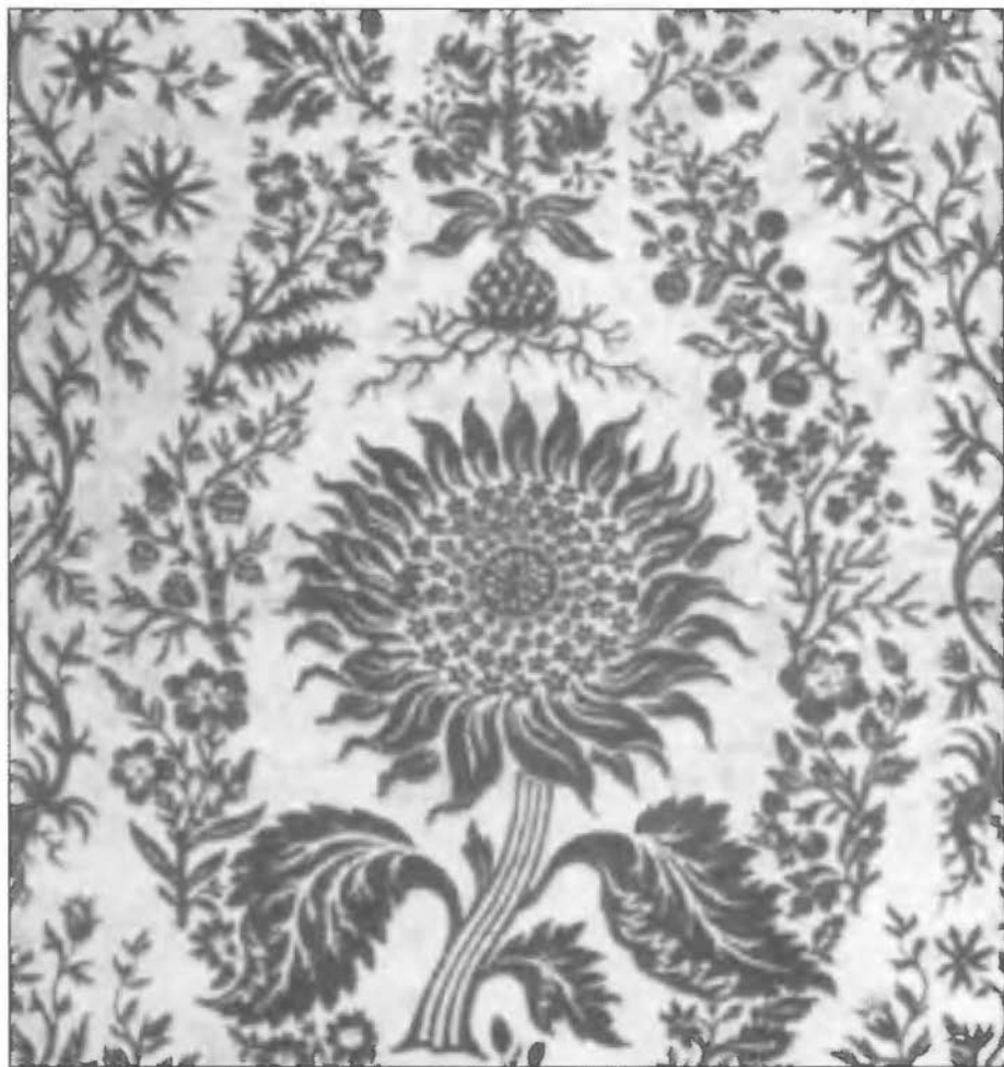
Het 17de-eeuwse zonnebloemdessin

gestarte fabriek, werd velours vervaardigd voor de bekleding van meubels. De pool van deze stof bestond uit haar van de mohairgeit. Deze grondstof, die ook in de fabriek in Haaksbergen werd gebruikt, geeft het velours zijn bijzondere glans en duurzaamheid: de bijna onverslijtbare stoffen gaan veertig tot vijftig jaar mee. Van het geitenhaar komt het grootste gedeelte uit Zuid-Afrika en Texas, waar de klimaatomstandigheden de beste kwaliteit haar opleveren. Na het scheren en weven volgde het verven. De stoffen werden geleverd in een breed scala van kleuren, eigenlijk iedere kleur die maar denkbaar is. Een vroegere klant, die zijn uiteindelijk versleten meubelstof wilde vervangen, kon vragen om exact dezelfde kleurnuance.