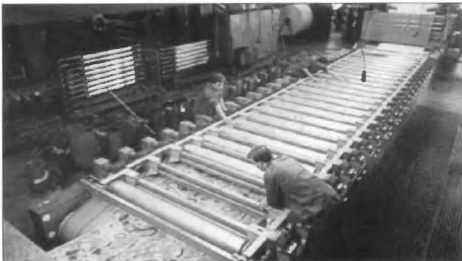
Rotatiepers met sjablonen

Na het drogen worden de gedrukte lappen beoordeeld en maakt men de definitieve keuze voor het betreffende dessin. Een dessin zal in de regel uit een aantal kleuren bestaan.