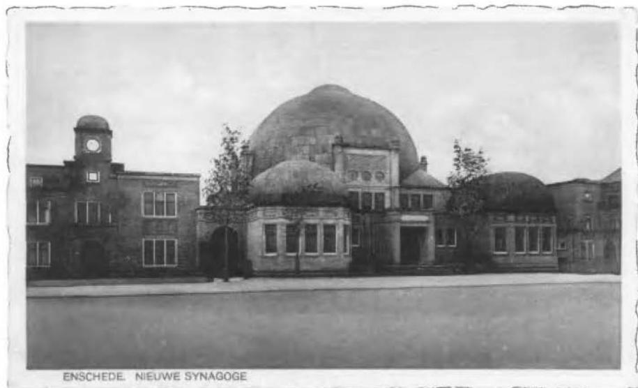
De huidige synagoge van Enschede (1927-1928), gezien vanuit het oosten.

Vanaf 1918 en/of 1919 heeft De Bazel ontwerpen voor de nieuwbouw gemaakt. De realisatie ervan heeft hij echter niet meer mogen meemaken, want voordat met de bouw zou worden begonnen overleed de bouwmeester in 1923 in Amsterdam. Na zijn dood werd de uitvoering opgedragen aan zijn geestverwanten, het architectenbureau