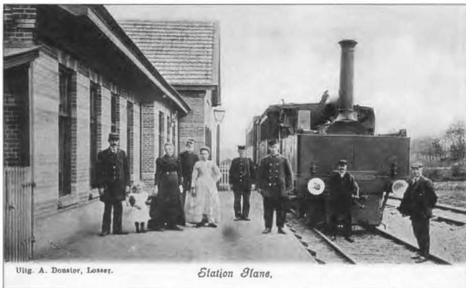
Uitg. A. Donstler, Losser.