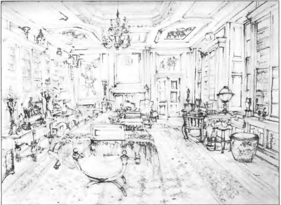
De bibliotheek in kasteel Twickel, pen- en potloodtekening Françoise van Lynden, 1993

Groepen vanaf 30 personen ontvangen f 5,00 reductie p.p. Voor f 15,00 is een picknicklunch verkrijgbaar. Reserveringen kunnen geboekt worden bij het informatiepunt van de Stichting Twickel, tel. 074 - 376 10 20 fax 074 376 4691.