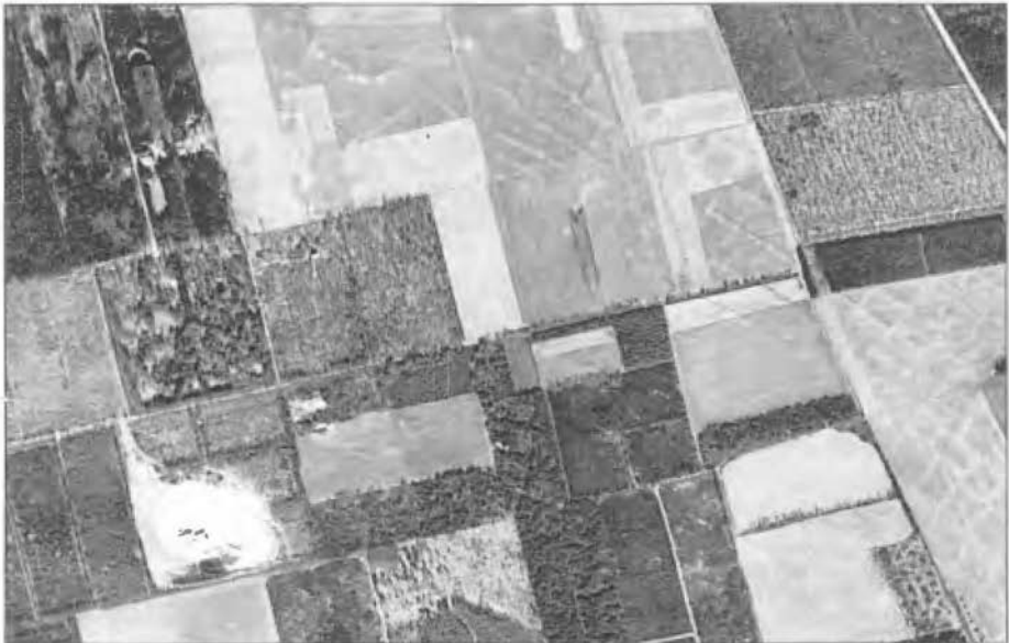
Luchtfoto van een goed herkenbaar celtic field bij Lunteren, gem. Ede

Allereerst is een toelichting op deze term hier op zijn plaats. De Engelse benaming (spreek uit als keltik fields) suggereert ten onrechte een verband met de Kelten. Net als diverse andere naamgevingen, zoals strijdhamers en donderbeitels, is deze term geïntroduceerd in een tijd dat er nog weinig kennis voorhanden was van deze akkercomplexen. Er bestaat trouwens ook een Nederlandse term voor 'celtic fields', te weten 'raatakkers'. Maar deze term is nooit populair geworden en zij is feitelijk ook onjuist. Vandaar dat de Engelse aanduiding algemeen ingang heeft gevonden. Maar wat is nu eigenlijk een celtic field ? In de IJzertijd, vanaf omstreeks 800 v.Chr. maar mogelijk ook al eerder, richtten de boeren hun akkerland op de zandgronden veelal in door tijdens de ontginning, en naderhand bij de latere bewerking van het land, allereerst afval langs de rand van de akkers op walletjes te stapelen. Zo kon gaandeweg een aaneengesloten systeem van vierkante en rechthoekige veldjes met een doorsnede van 20-40 m ontstaan, die werden omsloten door lage wallen. Het geheel is vergelijkbaar met de velden van een dambord, maar dan wel van een reusachtig dambord, want sommige celtic fields beslaan een oppervlak van vele tientallen hectares. De omvang en vorm van de akkertjes zal ongetwijfeld hebben samengehangen met de wijze van grondbewerking. Dat geschiedde met een eergetouw, een voortgetrokken frame met een aangepunte stok en met een handvat, waarmee men de bovengrond kruiselings