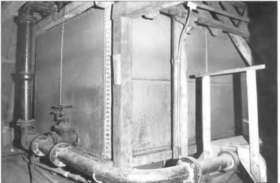
Reservoir op zolder zuidkant, opname 1977