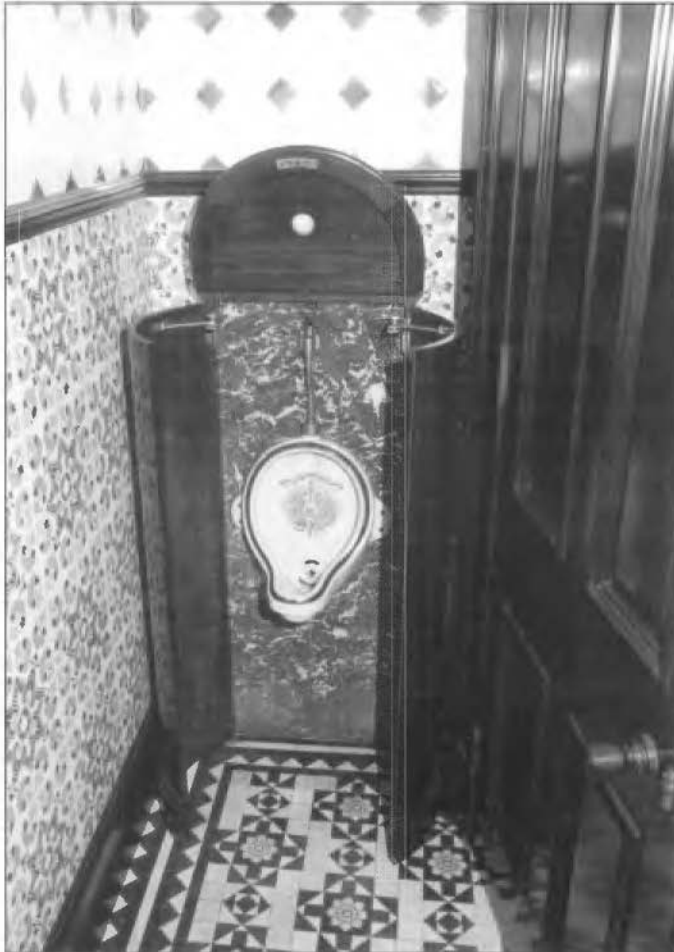
Urinoir, opname 1980