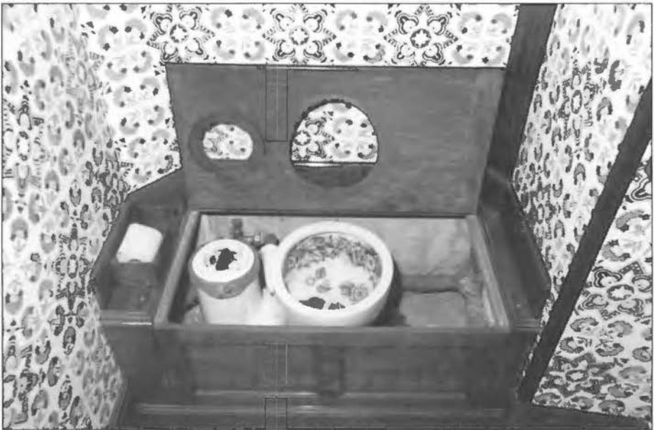
Toiletspot, opname 1980