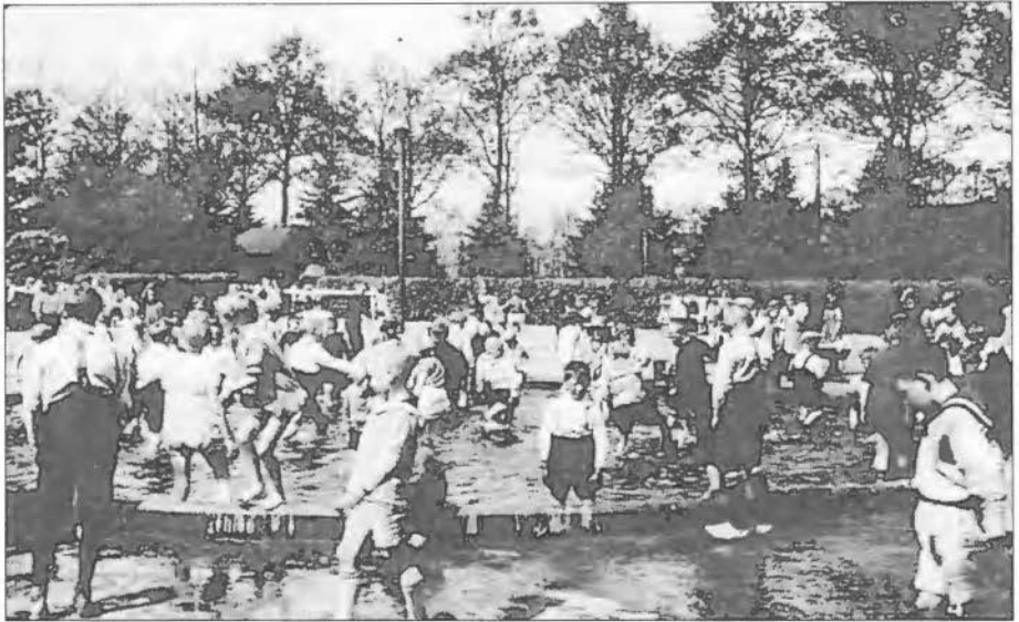
Ansichtkaart uit de collectie van J. Sybrandi

In 1918 schonken de erven Gerrit Jan van Heek een park aan de gemeente Enschede. Dit kreeg de naam van de goede gever en deze naam draagt het nog. Er waren een paar voorwaarden door de familie aan gesteld: het terrein moest altijd een parkachtig geheel blijven met mogelijkheden voor sport en voor een speeltuin. Van dit laatste geeft deze ansichtkaart een beeld. We zien kinderen voorzichtig pootje baden in het pierebadje. Parkwachter Florijn hield er toezicht en als er kinderen van de uloschool het park inkwamen en ze zagen Florijn, dat zetten ze het op een lopen. Helaas is van het speeltuintje niet veel meer over. Het lag ook in een besloten hoekje van het park en dat had aantrekkingskracht op bepaalde figuren. Momenteel zijn er prachtige jeu de boulesbanen en is het terrein open en geëgaliseerd.