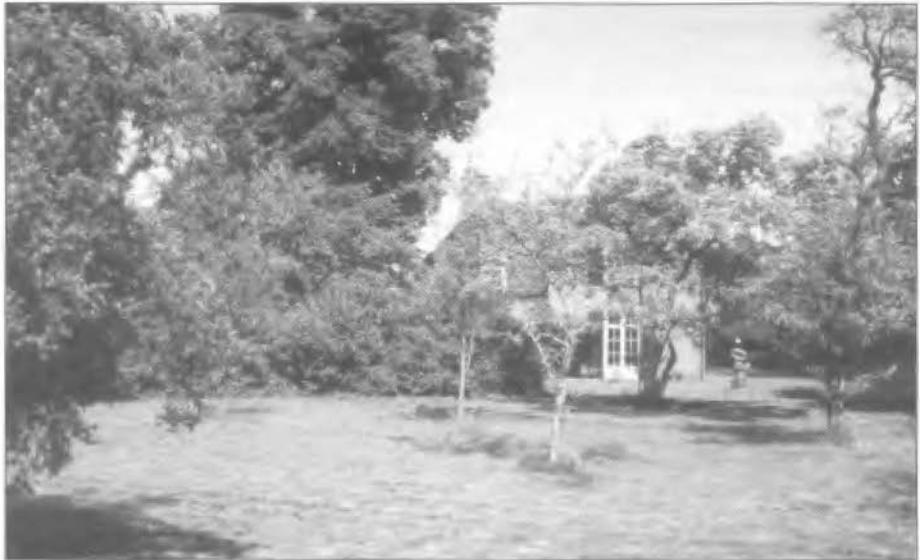
Tuin van de voormalige pastorie in 2002.

Uiteindelijk werd de pastorie in 1895 aangesloten op de Twickelwaterleiding.