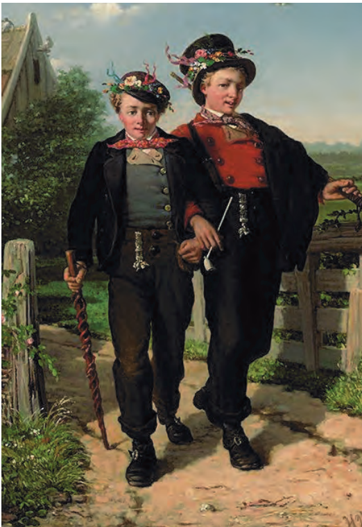
Afb. 5. "De brulftenneugers", Twentse fraai uitgedoste uitnodigers voor een bruiloft die beiden een signetketting dragen, geschilderd door H. Valkenburg.