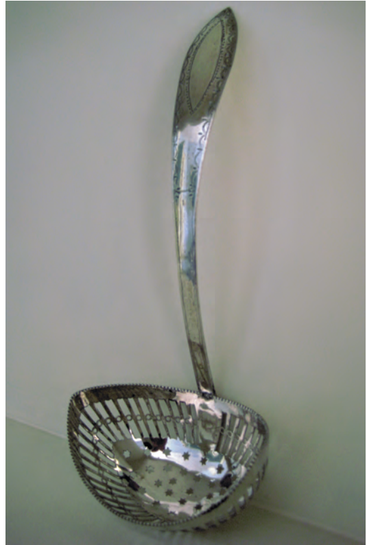
Afb. 3. Strooilepel, Reinier Brugman, Ootmarsum 1820. Merken: meesterteken (twee verschillende meestertekens afgeslagen) RB29 in vierkant en B in gearceerd vierkant, jaarletter voor 1820, kantoorkeur Zwolle en gehaltemerk. L. 18 cm, bak 7,2 x 5,2 cm. Herkomst: Part. Collectie

Jelis Wientjes, die zich ook wel uitgaf als "Egidius" aangezien het in die tijd vaker voor kwam dat een naam verfraaid werd door deze te verlatiniseren [6], was in 1795 meesterzilver-smid geworden in Groningen [7] en is rond 1800