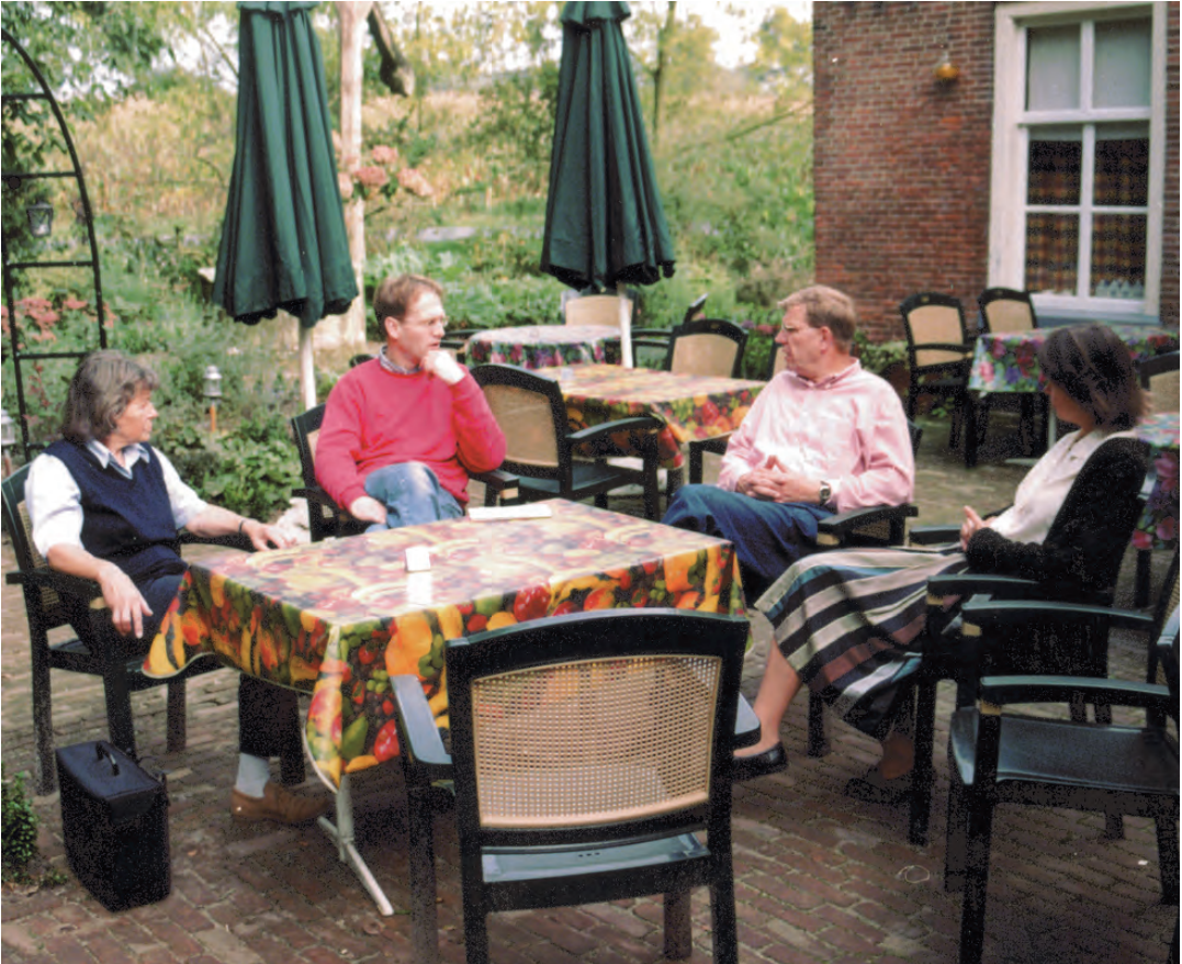
Fietsexcursie naar de molen van Diepenheim.