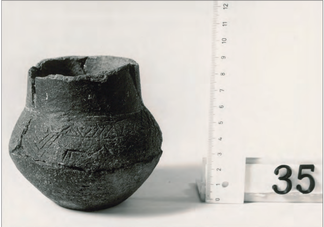
Bijpotje OKT 35 uit de Late Bronstijd, met ingekrast paardenmotief.

Dat zullen ze in het kerkdorp Rossum onder de