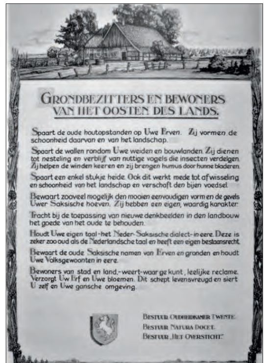
Propagandaplaat door G. van Haeften, in 1930 gemaakt op initiatief van de Oudheidkamer Twente.

Naar het Saksische verleden moest volgens de Twentse regionalisten dus niet alleen op nostalgische wijze worden teruggeblikt, het moest ook op activistische wijze beschermd worden door de Twentse bevolking bewust te maken van de waarde van het regionaal erfgoed. Zo werd op initiatief van de Oudheidkamer Twente in 1933 een 'propagandaplaat' gepubliceerd in het maandelijks tijdschrift De Wandelaar , waarin de 'Grondbezitters en Bewoners van het Oosten des Lands' werden opgeroepen om het Saksische karakter van de agrarische hoeven te bewaren (zie afbeelding hieronder).