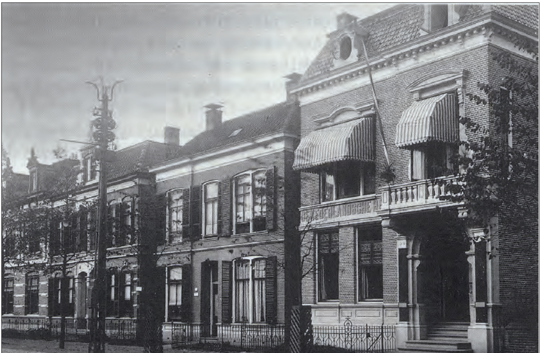
Uiterst rechts het pand van De Nederlandsche Bank aan de Wierdensestraat.

jurist, die de gemeente Borne op 10 april 1897 verzocht om de paters van de lijst te schrappen. De karmelieten waren zijns inziens bedelbroeders. Hoe konden zij met het oog op de gelofte