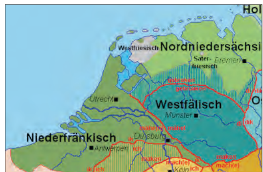
Verspreiding van het Westfaals.

Zoals Canter, Niebaum en Reker al constateren, mikt de schrijver met dit hekeldicht op een publiek aan beide kanten van de grens: anders had hij dit ‘euregionale’ palet van talen niet gekozen. Hij wil én de Münsterlandse onderdanen van de prins-bisschop een spiegel voorhouden én de (Oost-)Nederlanders amuseren. Door het idioom van zijn tekst te kwalificeren als ‘Westphaelsch’ geeft Nipetang te