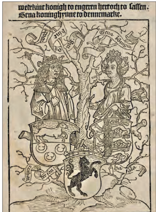
Het zwarte Saksenros van Widukind in de Cronecken der Sassen door Cord Bote, 1492.

Twentse regionalisten waren immers zelf bijna allemaal afkomstig uit de grote Twentse fabrikantenfamilies, die in zekere zin voor de industrialisering van de regio verantwoordelijk waren. De Janninks, Ter Kuiles en Van Heeks konden het zich niet veroorloven om de moderniteit volledig in de ban te doen.