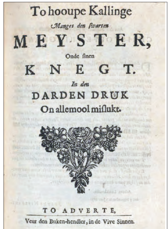
Hekelschrift Te hoope kallinge.

In Groningen spreekt men een Nedersaksisch dialect, bedenk ik, dus ik zoek voor de zekerheid enige biografische gegevens over de man. Die zijn er tot mijn verrassing in overvloed. In zijn tijd was deze medicus een bekend schrijver en oudheidkundige. Als ik lees dat hij de laatste jaren van zijn Latijnse school in een klooster in Westfalen heeft doorgebracht, roep ik 'Eureka!' Smids voldoet aan alle criteria: goed opgeleid, taalvaardig enzovoort. De belegering van Groningen heeft hij waarschijnlijk zelf meegemaakt, want die viel in de zomer van 1672. Smids was van hetzelfde geloof als de bisschop, maar dat bood hem geen enkele bescherming tegen diens kanonskogels. Smids' literaire werk is veel veelzijdiger dan dat van Sluiter. Zo heeft hij wél een aantal hekeldichten[14] geschreven, namelijk tegen een tweetal roomse rechtsgeleerden in Groningen die hem zijn overstap (in 1682) naar de protestante kerk kwalijk namen. Ook is hij in zijn Amsterdamse jaren toneelstukken gaan schrijven, waarvan er verscheidene op de planken zijn gebracht. De eenacter t'Samenspraak zou je dan als een jeugdwerk