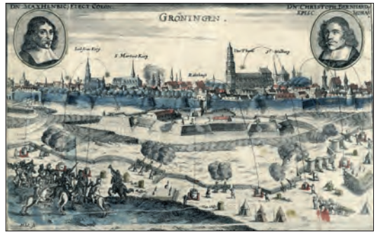
Beleg Groningen door Bommenberend.