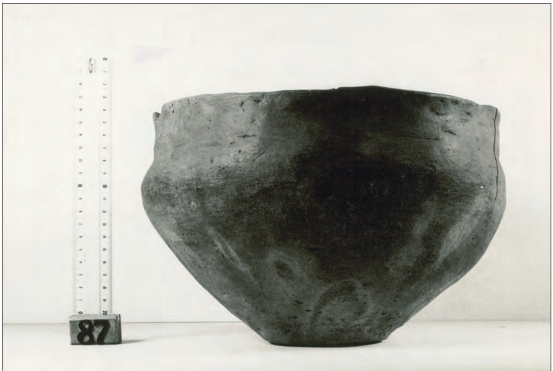
Urn van het type Hallstatt B uit het Vasser Grafveld. Vervaardigd in de IJzertijd, zo'n 800 tot 500 jaar voor Christus (Urn OKT 87).