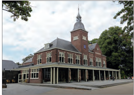
Het Parkgebouw, een van de weinige herinneringen aan Ter Horst in Rijssen.

In 1850 ontsnapt Ter Horst aan de moordende concurrentie op de katoentjesmarkt. De NHM wordt aangeschreven om mee te kunnen dingen naar de markt voor koffiezakken. Voortaan geen