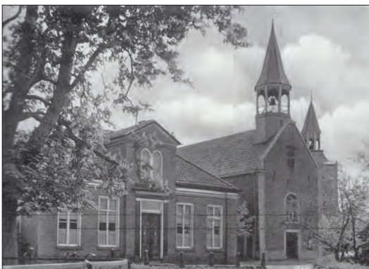
Hervormde kerk en pastorie te Tubbergen.