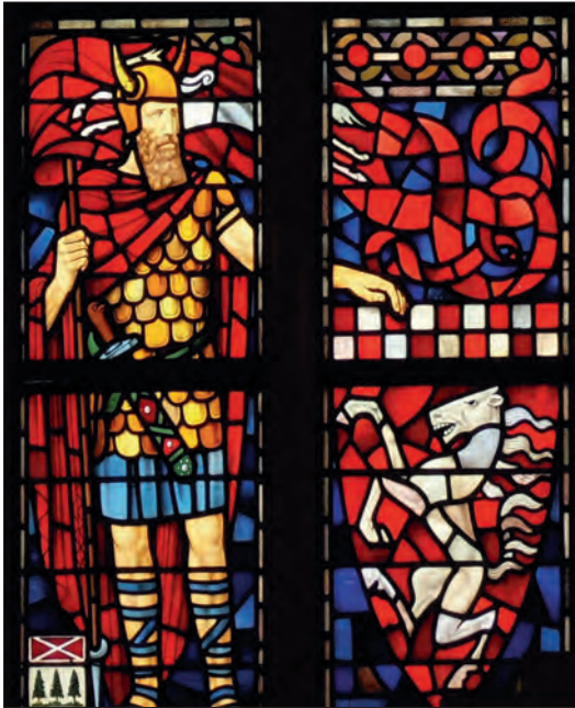
Detail van het Saksenros op het gebrandschilderde raam in de Grote Kerk te Enschede, door Hermanus Veldhuis, 1928.

Twentse tevens de verplichting met zich brengt te houden en hoeden het rijke verleden van het oude Tubantia.”[40]