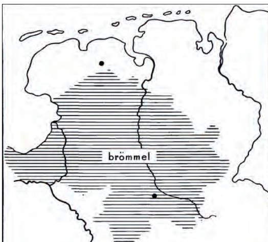
Verspreidingsgebied van het woord 'brömmel'.

Heeroma, de taalkundige die in 1953 de theorie van de Westfaalse expansie[5] lanceerde, zou maar wat blij geweest zijn met deze vroege observatie van Nipetang, want die strookt precies met de essentie van zijn theorie, namelijk dat er in de late middeleeuwen, zo tussen 1200 en 1600, sprake was van een sterke Westfaalse invloed op de dialecten in het oosten van ons land. Werd Heeroma's theorie aanvankelijk met enige scepsis ontvangen, vooral wegens een gebrek aan bewijs – al die Westfalen die hier kwamen lieten amper schriftelijke sporen achter, evenmin als de autochtonen overigens –, inmiddels is er meer bewijs verzameld, ook uit andere disciplines dan de taalkunde, en zijn vooraanstaande taalkundigen uit deze regio zoals Ludger Kremer[6] en Harrie Scholtmeijer[7] helemaal om. Zij achten Heeroma's theorie bewezen, in tegenstelling tot Henk Bloemhoff[8] die in een artikel over de Westfaalse breking zich niet wil uitspreken over de vraag of die gebroken tweeklanken – zoals in het Esmarker vûegel (vogel) en het Vriezenveenese njave (neef) – al dan niet uit Westfalen stammen. Bloemhoff denkt dat ze net zo goed het resultaat kunnen zijn van een 'autochtone' ontwikkeling. Hij is dus nog scepticus.