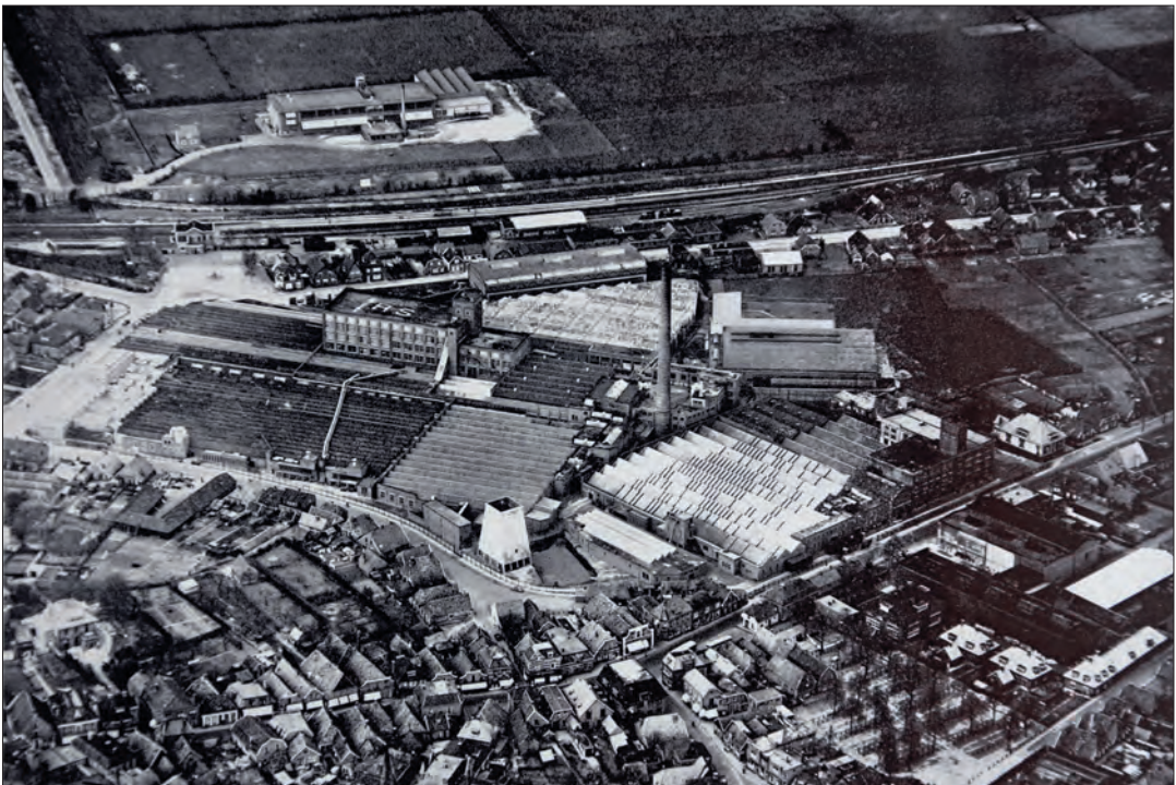
Fabriekscapex Ter Horst & Co, de Koninklijke Jutespinnerij en -werverij te Rijssen. Aan de noordzijde van de spoorlijn Kamgarensponnerij Riessen.

katoen meer in Rijssen maar de grondstof jute, afkomstig uit India. Ter Horst & Co zal zich ontwikkelen tot de grootste jutespinnerij en -werverij van Nederland. In 1900 vindt een op de zes Rijssenaren werk in De Stoom. Na gloriejaren met 1500 medewerkers ging het bedrijf in 2003 als Nederlandse Jute Industrie Groep ten onder.