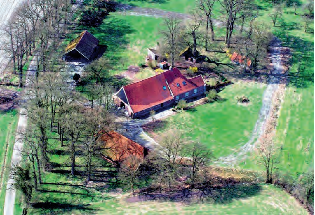
Erve Scholten, tegenwoordig Helman.

bedrijf uitoefenen. Het werd vroeger, naast de bezittingen in Lage, als één geheel beheerd vanuit het 'Forsthaus' in Lage, tegenwoordig vanuit de rentmeesterij in Delden.