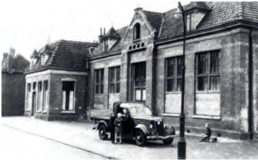
Meestershuis en Radboudschool, circa 1915.