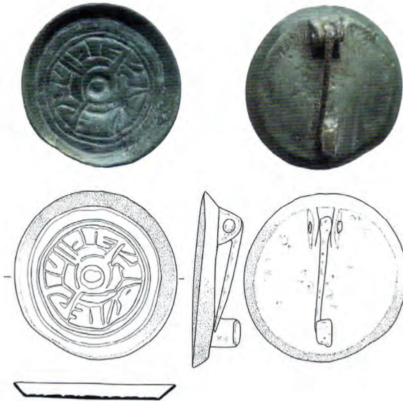
Saksische mantelspeld uit de 6e eeuw na Chr. met de oudste versiering met diermotieven die in Twente is gevonden.

gang. De unieke mantelspeld is een sieraad uit deze 'heidense' periode met zijn veelgodendom en natuurgodsdienst.