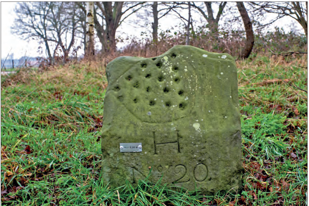
De Duitse kant van grenspaal 20.

In augustus 2007 ontdekte Dick Taat tot zijn schrik dat de grenspaal verdwenen was. Hij stond op een plek waar zandvrachtwagens af en aan reden, en de angst was dat de paal omvergereden was en daarop door iemand meegenomen naar een onbekende bestemming. Dat eerste klopte gelukkig niet, want hij bleek preventief door de gemeente Bentheim te zijn weggehaald. Anderhalf jaar later werd hij volgens het aluminium plaatje 5,00 meter verderop herplaatst. Een rijksgrenspaal, maar opzettelijke niet op de juiste locatie herplaatst. Ook dat maakt deze paal bijzonder.