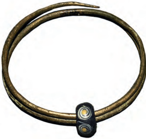
Bronzen spiraalarmband met La Tène-kraal uit de IJzertijd gevonden bij Vriezenveen.

Twente zijn gevonden! En ze maken deel uit van een vroeg-Middeleeuwse 'schatvondst' die tot de grootste van ons land behoort! Een eerste onderzoek op basis van de muntjes leerde dat de vondsten waarschijnlijk dateren uit de periode 675-700 na Chr.