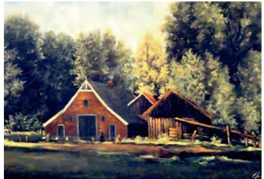
Geboortehuis 't Haghoes.

Zowel op de Lagere School als op de Normaalschool