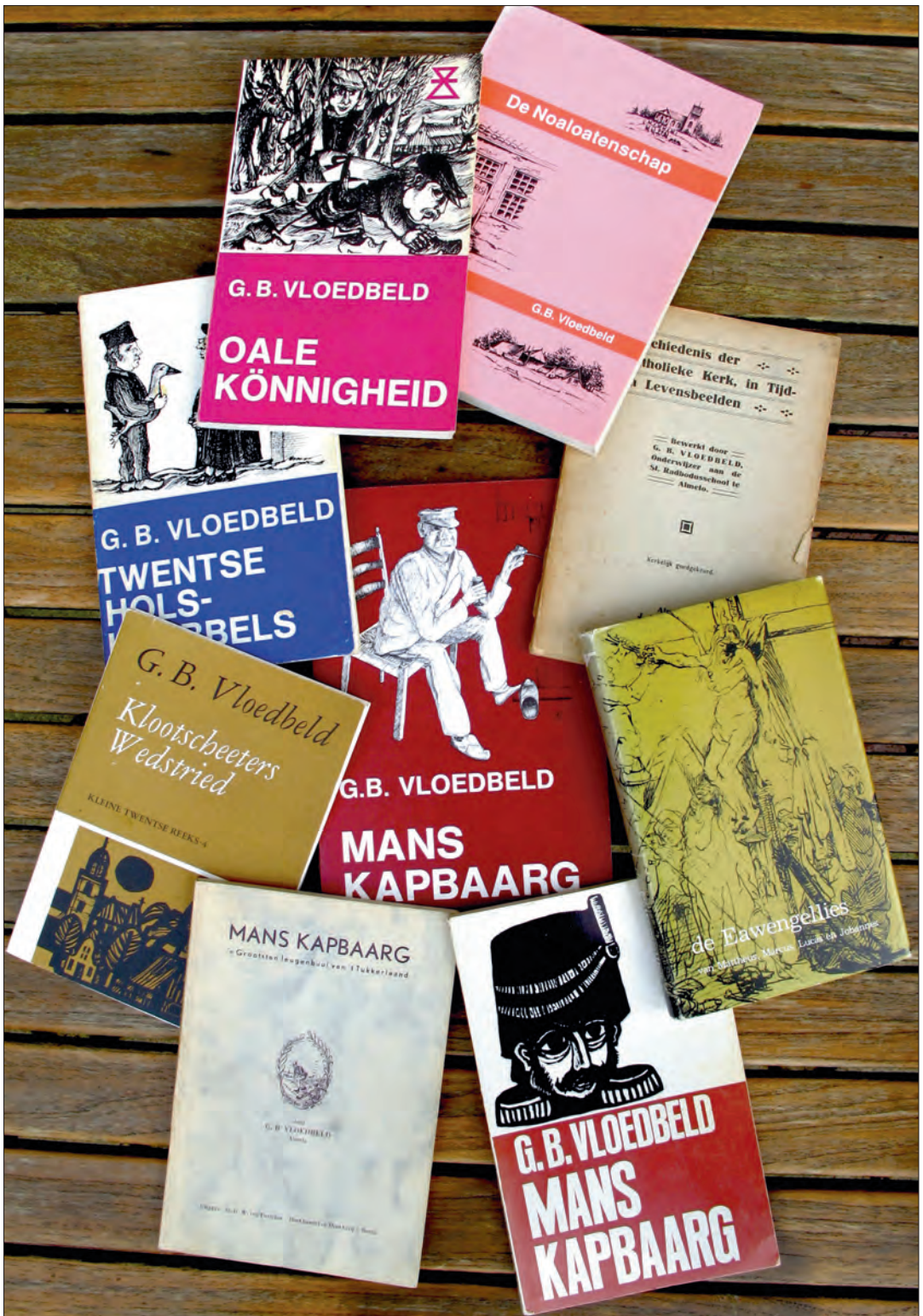
De bekendste uitgaven van meester Vloedbeld.