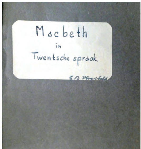
Schrift met vertaalde wereldliteratuur.

De Tweede wereldoorlog is Vloebeld betrekkelijk goed doorgelopen, maar heeft hem geestelijk diep geraakt. Hij was er vooral ontzet over, dat 'de leu van achter 'n poal' , die toch dezelfde taal