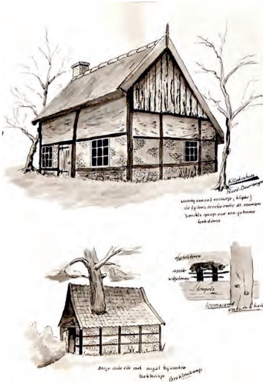
Spieker in Brecklenkamp.