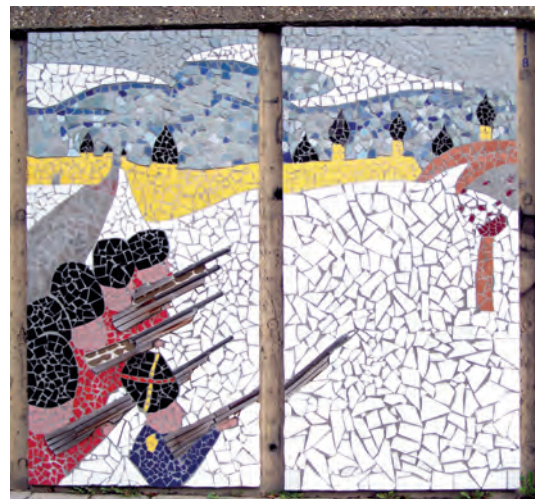
Mozaïek in de Mans Kapbaargtunnel in Almelo: schieten op een rode kool.

In 1921 verhuisde de Twentse Courant van Almelo naar Oldenzaal. De inmiddels 37-jarige Vloedveld kreeg van het episcopaat de opdracht in Almelo een nieuwe katholieke krant te begin-