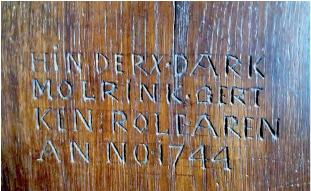
Inscriptie in de rugleuning van de stoel op Het Stroot.