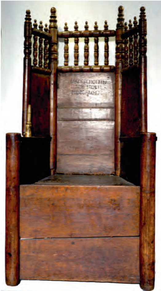
De holtinkstoel.

Deze holtinkstoel is vrijwel zeker afkomstig van het erve Scholten aan de Jonkerhoesweg in