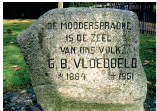
Gedenksteen aan de Krommendijk.