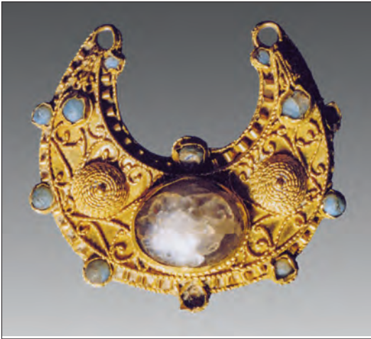
Kostbare gouden oorhanger voorzien van geslepen stenen uit de 11de eeuw. Gevonden bij Weerselo.

hoog. Het gaat om een datering tussen 1030-1070 na Chr. De eigenaresse moet een vrouw van hoge adel zijn geweest. Gert Gesink oppert in zijn boek keizerlijke kringen, maar aannemelijker lijkt de ook door hem aangestipte mogelijkheid van een verband met de oprichting van het Benedictijnerklooster in Weerselo in 1152. In 1142 kreeg ridder Hugo van Buren, afkomstig van de schatrijke Gelderse Heerlijkheid Buren bij Culemborg, de kapel van Weerselo in bezit. Deze kapel was de voorloper van de huidige 14e eeuwse kerk op het terrein van Stift Weerselo. Blijkbaar voelde Van Buren zich thuis in Weerselo want tien jaar later maakte hij de kapel tot het hart van een Benedictijner klooster waar hij met gezellen ging wonen en zijn verdere leven wijdde aan het geloof. Voor die tijd zal Van Buren samen met zijn vrouw (en dochters?) ook in Weerselo woonachtig zijn geweest, mogelijk heeft toen één van deze adellijke dames het kostbare sieraad tussen 1142 en 1152 verloren. De zusters die vanaf 1152 deel uitmaakten van de strenge kloostergemeenschap moesten hun aardse rijkdommen achter zich laten en zullen zeker niet in het bezit zijn geweest van dit sieraad. Het is om die reden plausibel dat het voor 1152 is verloren. De vondst is thans in bezit van de familie van de intussen overleden heer Oosterik.