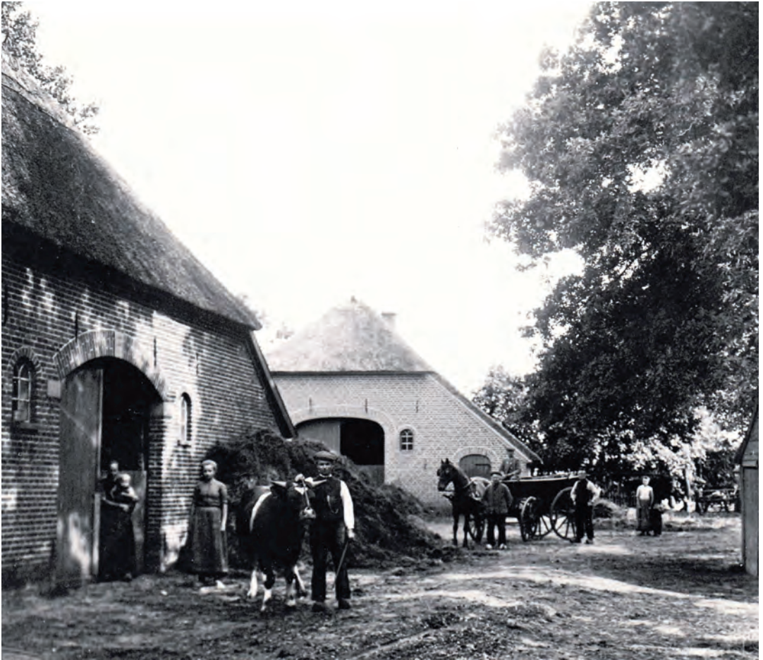
Voorzijde boerderij Blauwhand in Oolde in 1914