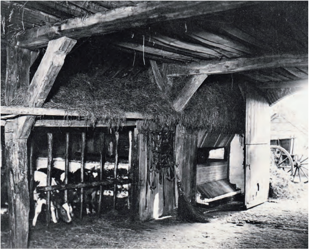
Stal Blauwhand in Oolde

Zwartenkot op de korrel nemen. Niet uit te sluiten valt dat bij de klompenmaker zijn eigen geloofstwijfel begint baan te breken.