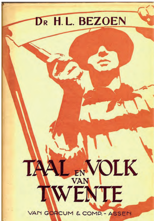
Taal en Volk van Twente

verwacht en omdat het hun gemak dient. Zou het hun belet worden, zij zouden het onder elkaar toch blijven doen, omdat het ook een behoefte des harten, van deemoed en vertrouwelijkheid zou blijken te zijn". Het is natuurlijk wel een uitspraak uit het pre-televisie tijdperk.