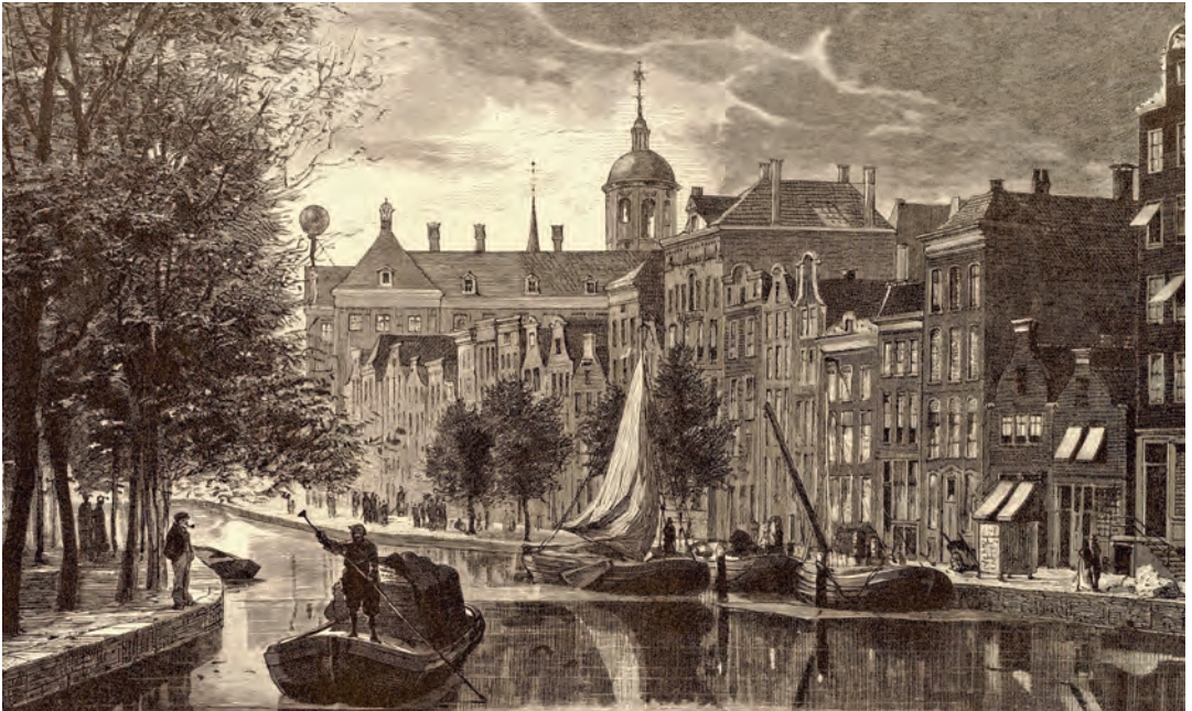
Gravure Pijpenmarkt

[6]. Drie heren uit Amsterdam krijgen vanuit Twente de volmacht om de zaken ter plekke af te handelen. Interessant is de vermelding in Penninks akte dat er een boedelinventaris is opge maakt van Elizabeths bezittingen. Die blijkt in het archief van een Amsterdamse notaris be waard te zijn gebleven en geeft een mooie in druk van haar aanzienlijke rijkdom [7]. Ze had die opgebouwd in twee eerdere huwelijken met vermogende mannen, die beiden waren overleden.