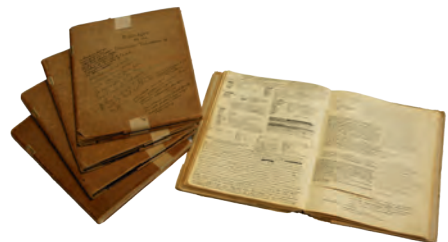
Vijf van de zes notitieboeken Idioticon

Nederlands aan de Gemeentelijke Universiteit van Amsterdam. Al vrij snel hierna begin hij in aantekenboekjes taalbijzonderheden te noteren, met name betreffende het Twents. Hij noemt zijn aantekeningen "Bijdragen tot een Idioticon Tubantum" . Het woord idioticon (dialectwoordenboek) is evenals idiotisme (taaleigenaardigheid, i.h.b. 'van eenen tongval', Kramers, 1847)