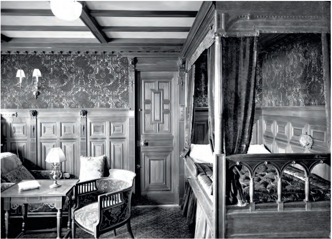
Luxe hut B-59 in de beroemde oceanstomer Titanic

maart 1946 plannen klaar voor de nieuw in te richten fabriek. Eind 1948 vindt de officiële opening plaats en draait de trijpfabriek weer op volle toeren. Midden jaren zeventig nadert het einde. Zoals vele textielbedrijven in Twente krijgt ook de trijpfabriek moeite met het binnenhalen van orders. De reorganisatie die volgt is niet voldoende om het bedrijf te redden. In februari 1981 wordt faillissement aangevraagd. Het fabrieksterrein en de gebouwen komen in handen van de gemeente Hengelo. Aan de Veloursstraat verrijst woningbouw. De trijpfabriek maakt een