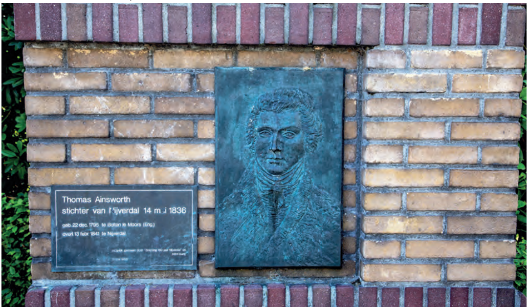
Monument Thomas Ainsworth

andere monumentale delen van het complex aan de Stamstraat behoren de ververij, het ketelhuis en de smederij. Vergeet ook niet het torengedouw, het droogdoekmagazijn en het op het binnenterrein gelegen laboratorium. Bovendien zijn enkele kunstwerken te bewaren.