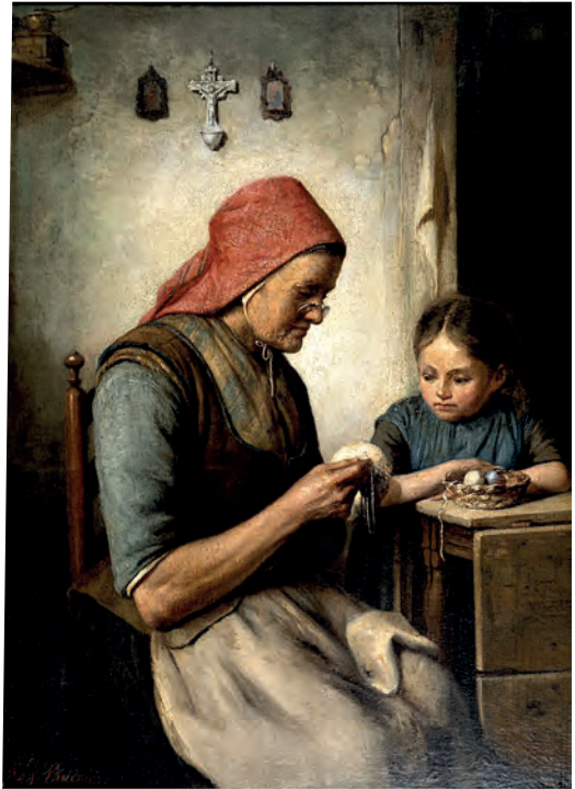
Vrouw met verstelwerk in collectie Oudheidkamer