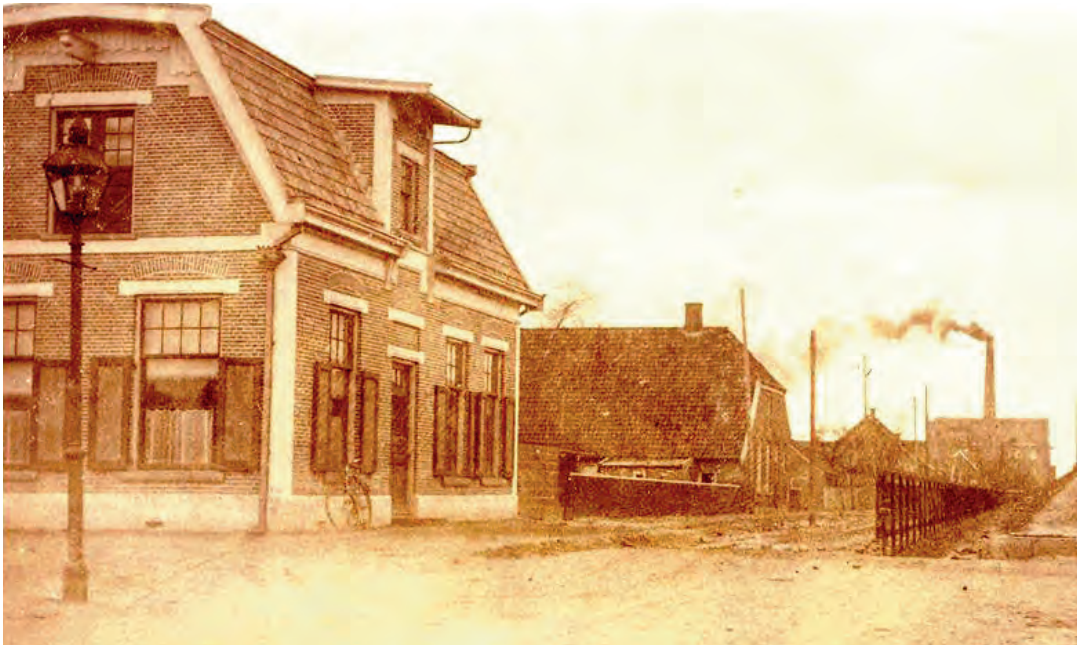
De start aan de Parallelweg SS rond 1900

wordt als meubelbekleding, voor wandbekleding en soms voor galakleding; rond 1900 kostte een meter trijp van 64 cm breed al 4 gulden. Er zijn ware kunstwerken van dit materiaal vervaardigd die in diverse musea en kastelen te bewonderen zijn. De meest aansprekende toepassing staat beschreven in Exodus 36:14. "Verder maakte hij gordijnen van geitenhaar, tot een tent over den tabernakel, van elf gordijnen maakte hij ze".