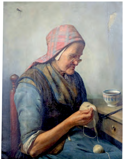
Een Twentsche Boerin, kousen stoppende. In een lichte versie

probeert te verzamelen. Het werkje werd in Utrecht te koop aangeboden en in dit geval lukte dat. In heel Twente lijken er maar twee verzamelaars te bestaan van dergelijk Twents erfgoed. Dat lijkt me niet overdreven veel. Is de rest van Twente cultuurbaar of houdt kunst- minnend Twente meer van hedendaagse kunst? Een paar jaar geleden ontdekte ik zelf op inter- net een mij nog onbekend schilderij van Bruna, dat te koop is bij een kunsthandelaar in Zuid- Limburg. Het stelt een vrouw in Twentse dracht voor, die sokken aan het stoppen is. Het dateert uit 1876 en werd in 1877 geëxposeerd in de Koninklijke Academie voor Beeldende Kunsten te Amsterdam op de “Tentoonstelling van Schilder- en andere werken van levende kunstenaars” als ‘Een Twentsche Boerin, kousen stoppende’ [1]. Opvallend aan dit werk is dat het