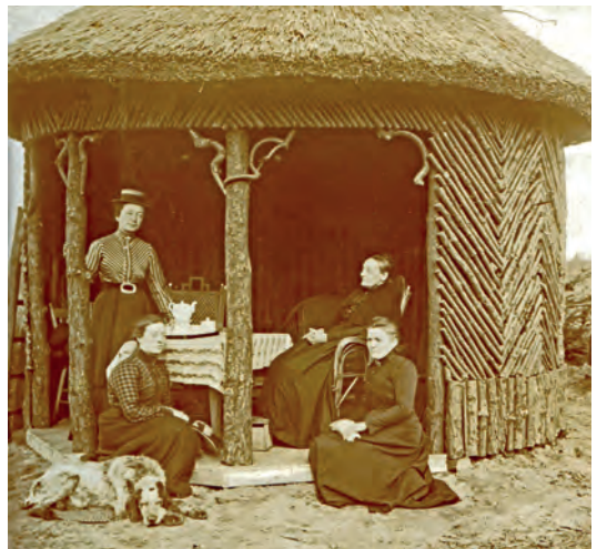
Met moeder en zussen in het prieel op 't Nijenhuis

Verpleegkundige in Amsterdam en Enschede Rond 1890 is ze op kostschool in Hannover. In 1892 – ze is dan 21 – kiest ze voor de verpleging. Ze had daar al wat ervaring mee, vanwege haar moeder, een levendige en intelligente vrouw, maar ook ziekelijk, die vaak kurde en verzorging nodig had. Ze begint haar opleiding in het oude Buitengasthuis aan de Overtoom in Amsterdam. Ze schrijft aan haar moeder, wat ze moet doen als ze nachtdienst heeft. Dat is heel wat. Van temperaturen, verbedden, grote ketels water aan de kook