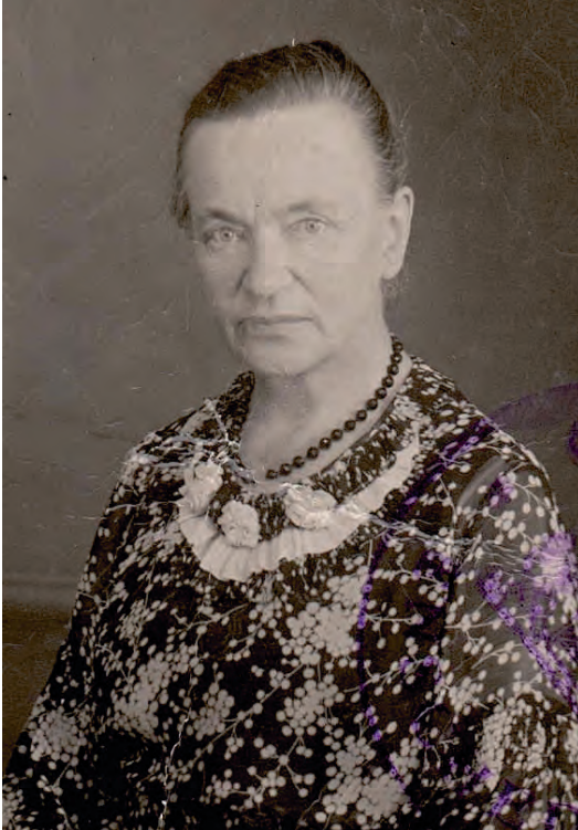
Cato komt als zeventigjarige ten val met de fiets en overlijdt uiteindelijk aan de complicaties.

Der zit in 't bosch 'nen oalen wal Knoestige wortels oaveral ... En ik weet het zo weinig as zee Wat mi-j hier vasthölt an dusse stee.