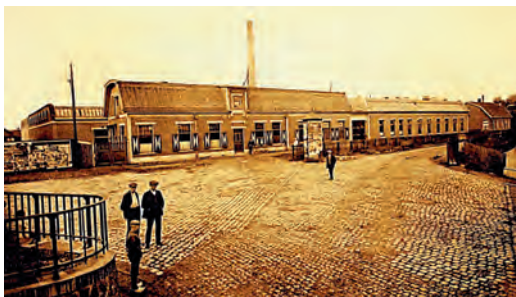
De trijpfabriek in 1914

Velen hebben jaren op Hengelose Trijp gezeten, zoals leden van de Staten Generaal, rechters van het Vredespaleis en koningin Juliana tijdens haar kroning in 1948. In de burcht van Praag zaten achtereenvolgens de Tsjechische president Benesj en de dictators Hitler en Stalin op trijp uit Hengelo.