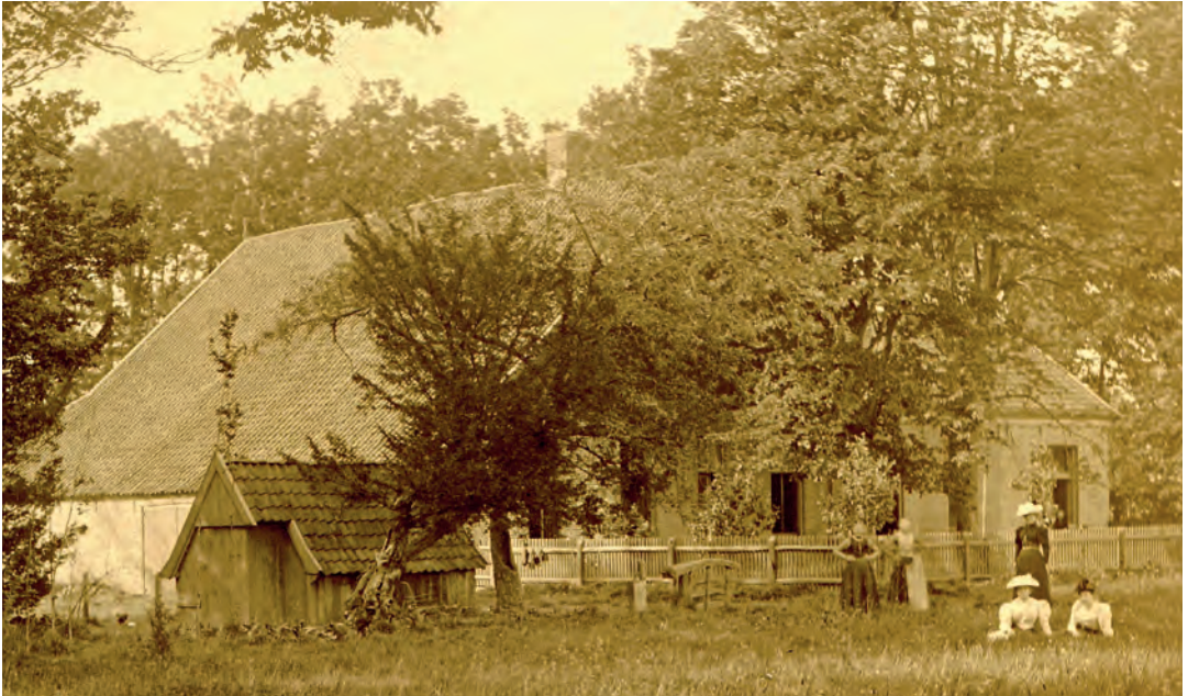
Boerderij 't Nijenhuis te Buurse, omstreeks 1900

dienst en politiek. Het gezinsleven en de familieliebanden stonden hoog aangeschreven. De Blijdensteins waren, zoals ook andere (doopsgezinde) fabrikantenfamilies, patriotten. Maar ze werden verschrikkelijk teleurgesteld in de Franse politiek. Ook over plaatselijke en regionale gebeurtenissen wordt in de brieven geschreven. J.B.B. is o.a. 'mairé' (1810) en burgemeester (1813) van Enschede geweest, maar heeft ook zijn steentje bijgedragen aan 's lands politiek ten tijde van de Bataafse Republiek. In huize Blijdenstein, waar eens koning Lodewijk Napoleon ontvangen was, bezat men een zeer uitgebreide 'boekery' met banden in velerlei talen.