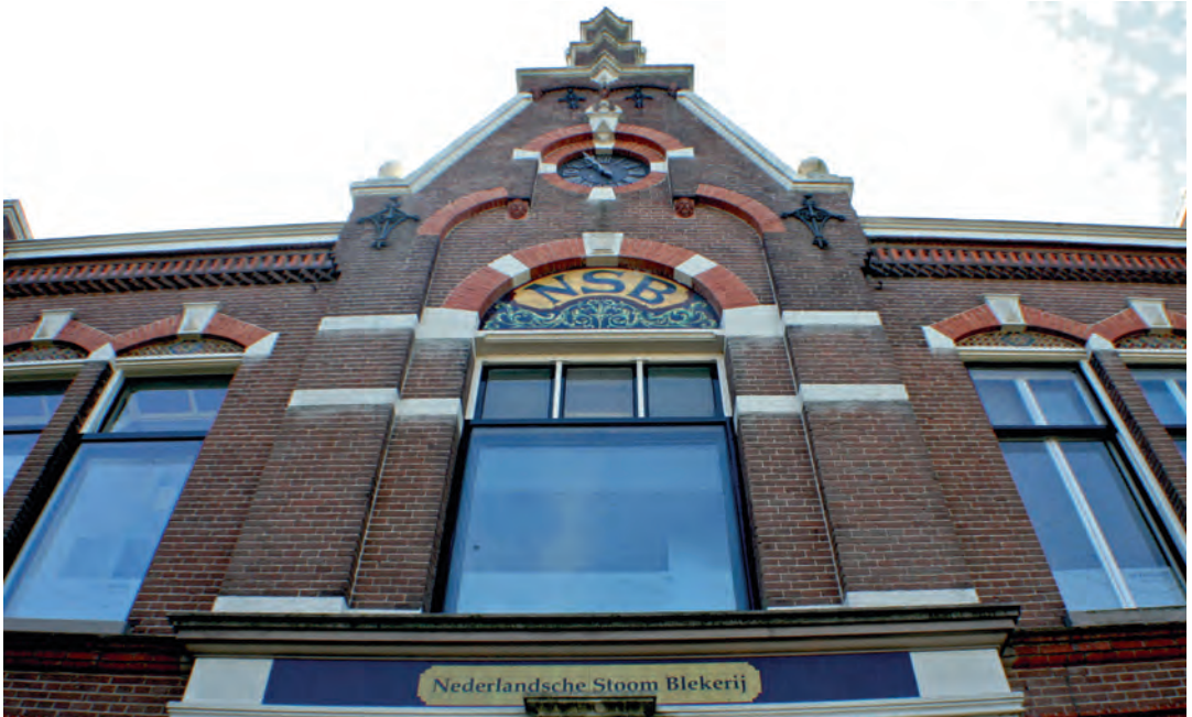
Gevel Nederlandsche Stoomblekerij

omvat twaalf aandachtspunten. De watertoren met zijn opengewerkte betonconstructie wordt een zeldzaam gaaf voorbeeld van een fabriekswatertoren genoemd. Status: rijksmonument. Wat de Nijverdallers betreft krijgt ook het kantoorgebouw aan de overkant van de straat het etiket rijksmonument. Tot de