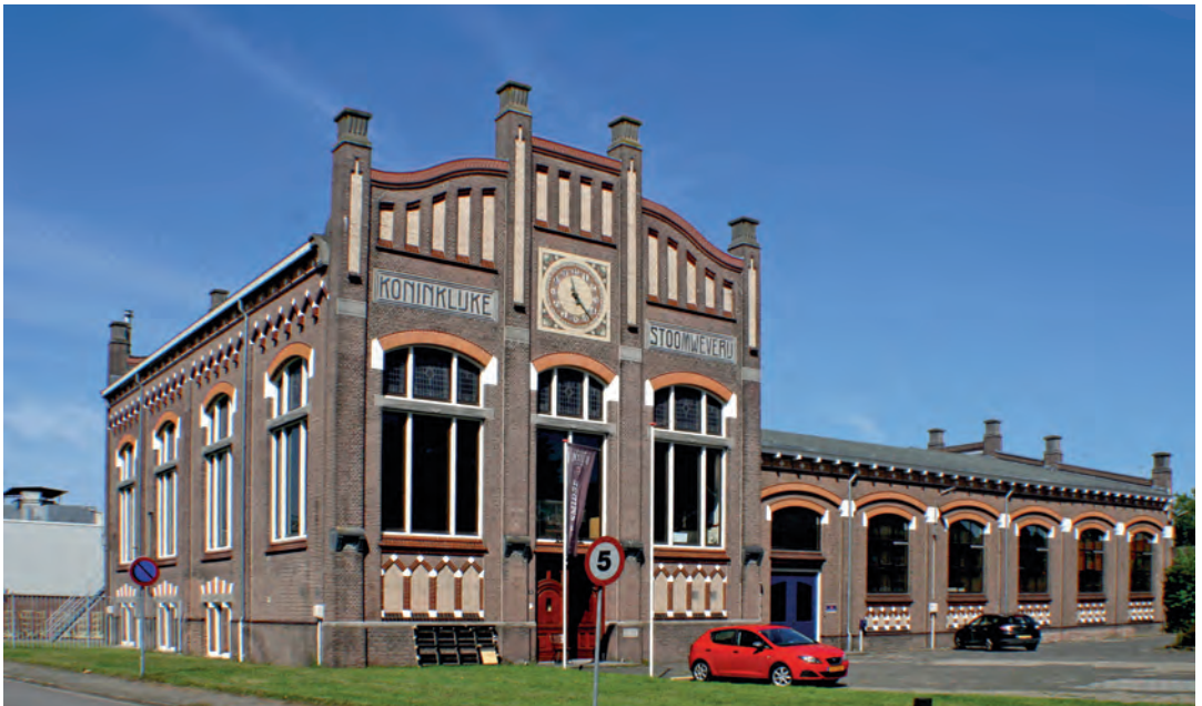
Het ketelhuis van de Koninklijke Stoomweverij

Het pleidooi voor de fabriek aan de Stamstraat