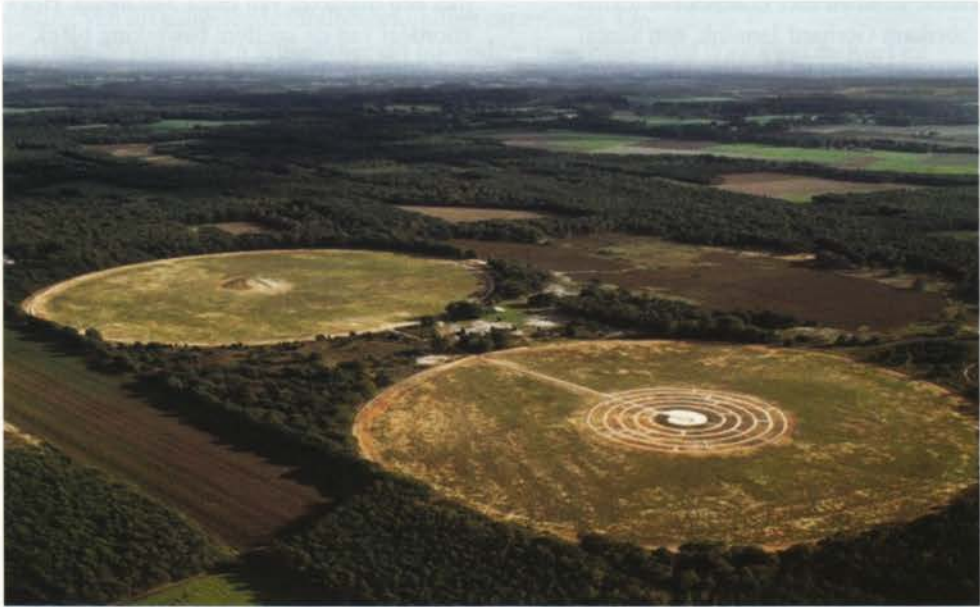
Luchtfoto cirkels van Mander