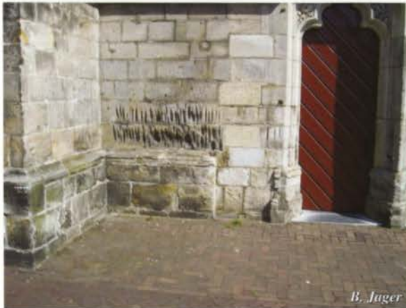
Groeven in de muur van de Plechelmus

Allereerst werd rekening gehouden met een mogelijke verwerking in de zandsteen. Ook werd de mogelijkheid geopperd dat de verticale gleuven in relatie zouden staan met het verplaatsen en optakelen van de zware steenblokken. De mogelijkheid dat de gleuven ontstaan zouden zijn t.g.v. het slijpen van wapens, zoals lansen, speren, dolken of messen kwam ook als hypothese naar voren. Er werd zelfs geopperd dat de wapens vroeger zouden zijn gewet om ze