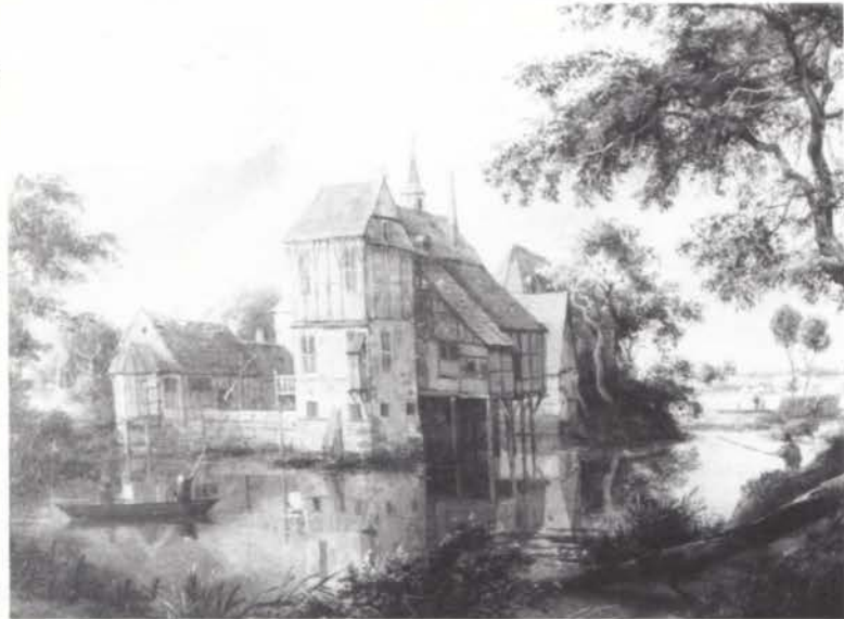
Huis Ootmarsum van Meyndert Hobbema

Laatstgenoemde kunstenaar had een uitgesproken voorkeur voor watermolens als hoofdmotief van de voorstelling. Een omvangrijke molengroep als die van Singraven bij Denekamp, waarvan de