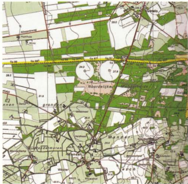
Kaart met in het midden de cirkels

Gerhard begon met de aanleg van één cirkel met een diameter van circa 340 meter. Het voordeel van de snellere bewerking bleek een goede keus en het plan werd gemaakt om nog drie cirkels met een oppervlak tussen de 10 en 12 hectare te gaan aanleggen. Dit aantal is door interventie van zijn moeder niet doorgegaan. Zij vond