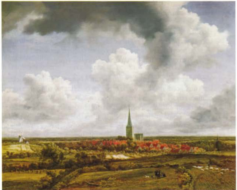
Gezicht op Ootmarsum van Jacob van Ruisdael

een werk uit de jaren zestig. Hij ziet het als een voorbode van de grote panorama's, die deze schilder in de jaren zeventig van de zeventiende eeuw heeft vervaardigd. De compositie is bijna volledig open. De horizon ligt op nog geen éénderde van de hoogte van het beeldvlak. Dit in de