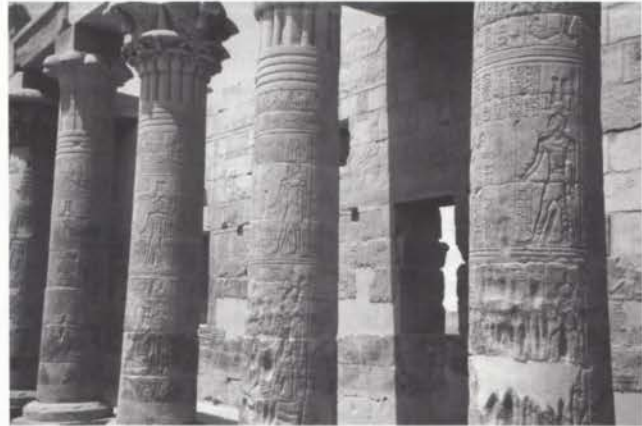
Zuilen van de Isis tempel met glieven

Ptolemaeus III. De Isistempel is de best bewaard gebleven tempel van Egypte. Dit heiligdom werd gewijd aan de geboorte van de god Horus, waarvan op de wanden verschillende scènes van de Horuscultus zijn te zien, terwijl het heiligdom gezien wordt als het geboortehuis van de god Horus. Horus was de god van zwangeren en barenden.