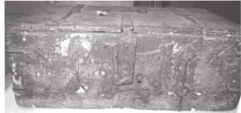
Voor de restauratie

florale versieringen in zwart tevoorschijn. Op het deksel waren nog maar enkele sporen van deze polychromie te vinden. Het kistje is nu weer, voor zover mogelijk, in zijn oorspronkelijk staat en mag weer gezien worden.