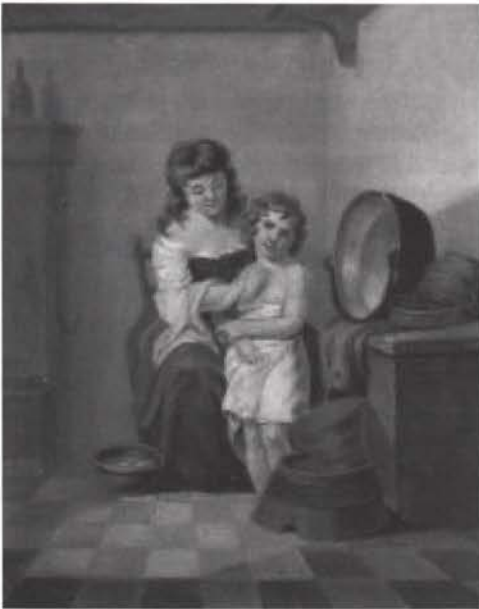
Moeder met kind