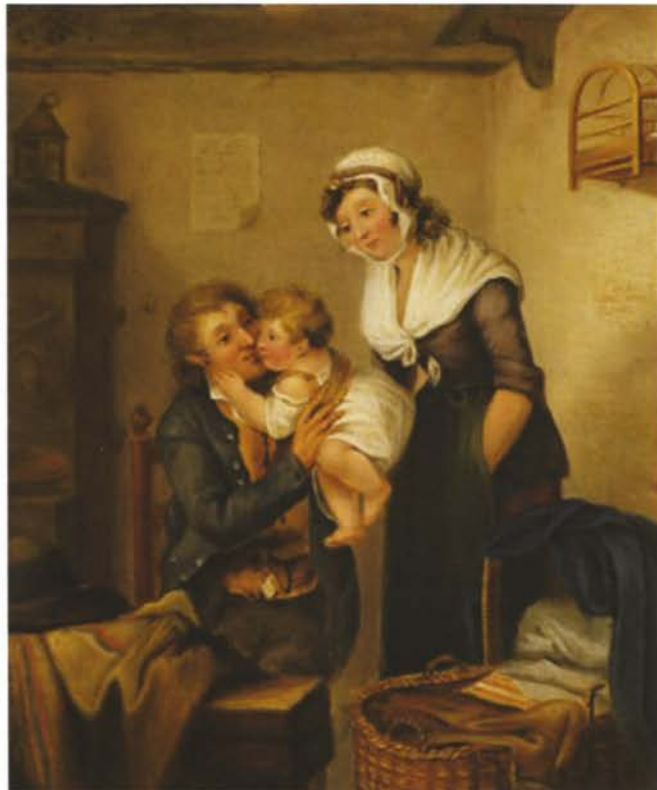
Vader, moeder en kind

zich na de stormen van de Revolutie en van Napoleon (1799-1815) aan zijn zaken te wijden of in behaaglijke rust van zijn bezit te genieten. Na zoveel schokken krijgt men