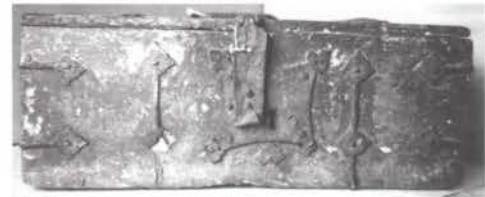
Tijdens de restauratie