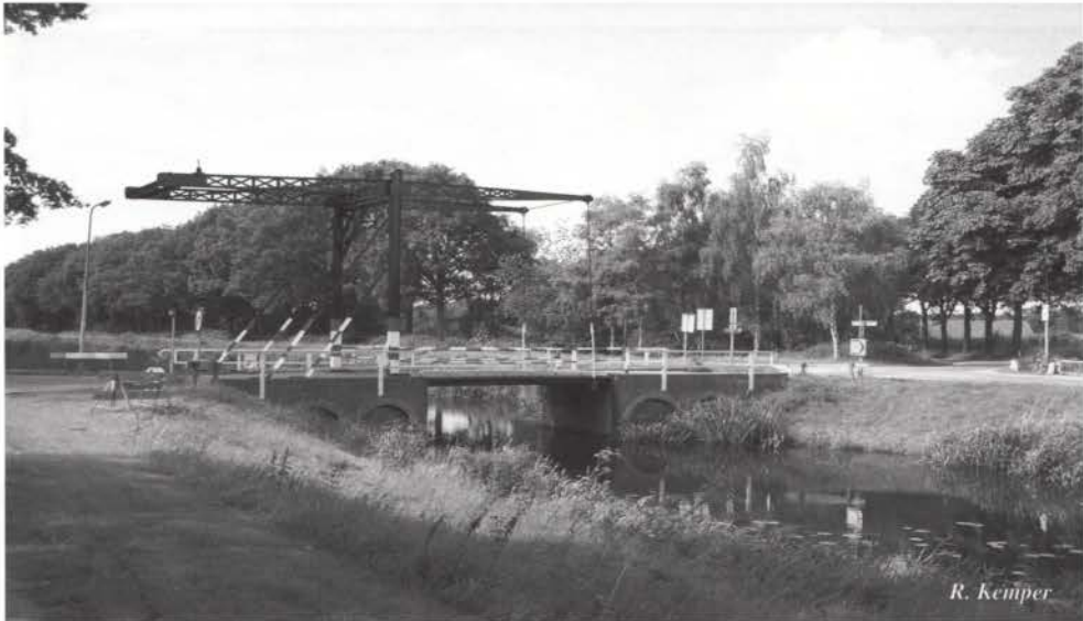
Brug op de weg Ootmarsum - Rossum

oude ophaalbrug vervangen door een afgesloten stuw. Ten noordwesten van Denekamp gaat de rivier de Dinkel onder het kanaal door. In Duitsland is er maar één sluis en wel bij de Frensdorfer Haar. Er zijn veel plannen geweest het kanaal een toeristische bestemming te geven. Bijvoorbeeld als een kano-kanaal maar zonder 'klunen' is dat nu niet meer mogelijk.