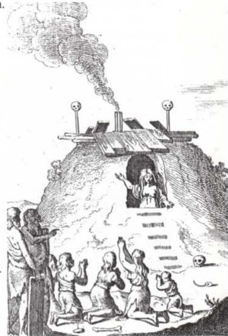
Illustratie uit Antiquiteiten van J. Picardt

om het lijk te kleden (hennekleed = doodspleed) en naar de brandstapel of grafveld te begeleiden als klaagvrouw. Van witte wieven wordt gezegd dat zij zijn uitgestorven omdat zij niet getrouwd waren. Dit kan een aanwijzing zijn dat zij maagd waren. Gezien wat er over Germaanse priesters bekend is, zou dit mogelijk zijn. Zij waren eveneens bedreven in de kunst van het sjamanisme. Al hun kunnen maar ook alle hun toegeschreven mogelijkheden duiden hierop. Een sjamaan is een persoon die in staat is zich in een toestand te brengen, waarbij zijn ziel (of geest) het