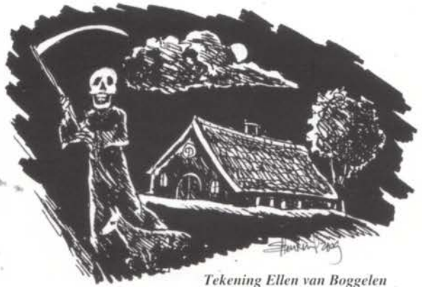
Tekening Ellen van Boggelen

Alles wijst er op, dat de oorsprong van het geloof aan deze vrouwen die geacht werden in grafheuvels te wonen, gezocht moet worden vóór de kerstening van Noord-Europa. Dat dit geloof zolang heeft kunnen standhouden, ondanks de sterke tegenstand van de kerkelijke overheid, rechtvaardigt het vermoeden dat deze vrouwen niet uit de Germaanse mythologie zijn ontsproten, maar werkelijk hebben bestaan en hun optreden zo'n diepe indruk naliet, dat deze na praktisch vijftien eeuwen nog voelbaar