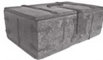
Na de restauratie