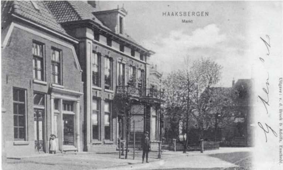
Het Witte Paard is het pand rechts