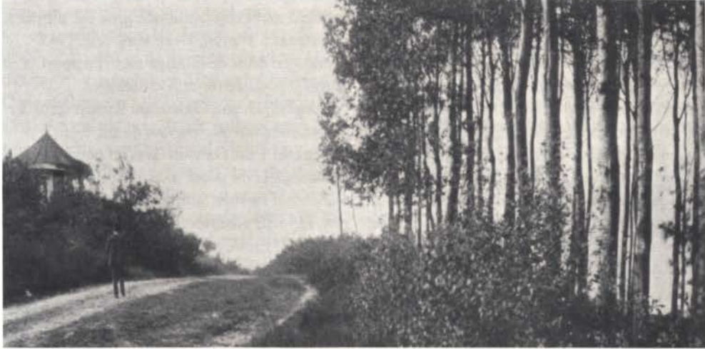
Weg naar de top van de Tankenberg, ca. 1900.

kigen gelukkig zien worden. Niets is blijvend, onophoudelijk wisselt 't getij. Je hebt een heel leven voor je, dacht hij dan en zijn zelfvertrouwen keerde terug als hij bedacht wat hij kende en kon. Ik hoef niet onder te gaan, honderden met minder capaciteit houden zich staande. Er ging