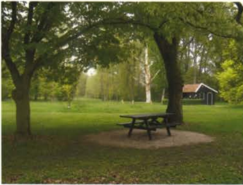
Een blik in het Arboretum Poort-Bulten.