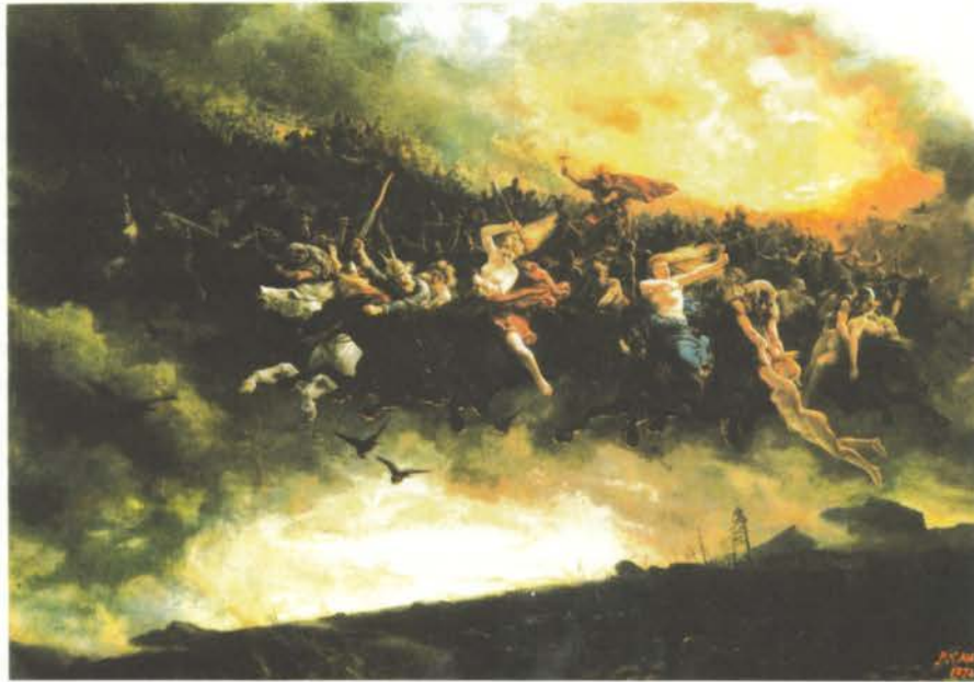
Peter Nicolai Arbo, Asgardsreien (De wilde jacht), 1872.

kerstening opgekomen en het gebruik moet al in de achtste eeuw hebben plaatsgevonden. Het was van groot belang dat de klok gewijd werd en voorzien van een demonenwerende tekst. In de grote (doods)klok in Steenwijk staat gegoten: Daemones fugito (ik verdrijf de duivel). Er bestaan in Nederland (en de rest van Europa) tientallen van dit soort klokken. Het Sint Thomasluiden dat momenteel nog steeds in Friesland gebeurt, (Mildam, Katlijk, Oudehorne) wordt in het Fries pluusluiden genoemd. Pluus betekent zuiver; het luiden van klokken is dan ook eigenlijk niets anders dan een ritueel om de