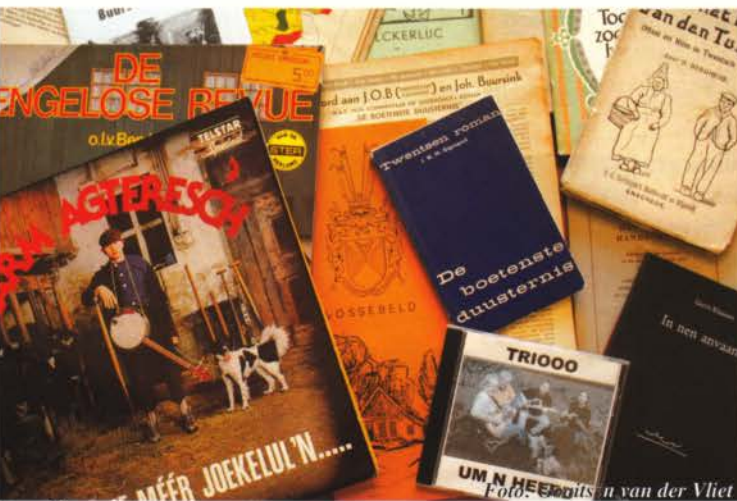
Een bonte verzameling Twentstalige uitgaven.

met Twentstalige uitgaven begon. Een Twents Letterkundig Museum en Documentatiecentrum was er niet. Wel een Vereniging Oudheidkamer Twente die zich toen nog verre van de streektaal hield en een instituut dat zich dan wel Twente Akademie noemde, maar in mijn ogen weinig weg had van de Fryske Akademy in Leeuwarden waar wetenschappelijke ambities en overheidssubsidies elkaar mooi overeind hielden. Het Fries was duidelijk bevoorrecht als tweede landstaal, terwijl er van