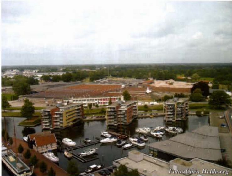
Blik vanaf de Javatoren op het Indiëterrein van Ten Cate in Almelo.

stad of dorp, ook wel van de streek. Af en toe wordt hun boek ook buiten Twente gesignaleerd. Eén deur op deze verdieping – voorzien van het bordje Stad en Land – geeft toegang tot een klein balkon. Daar zetelt op gezette tijden een journalist van het bekende regionale dagblad. We zien hem nogal eens in en uitgaan bij de kantoorhoudende heemkundige verenigingen. Via het balkon Stad en Land – verbonden met genoemd dagblad – wordt de bewoner van Twente wekelijks op de