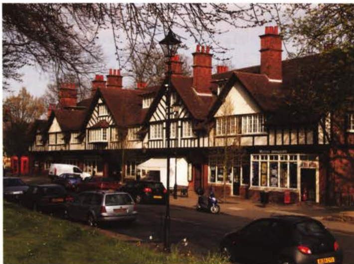
Typische winkelgalerij in tuindorp Bournville, 2005.

door de Engelse industrieel William Hesketh Lever opgerichte Lever Brothers zeepfabriek. Tot 1914 werden er achthonderd huizen gebouwd voor in totaal 3500 inwoners. Daarnaast kwamen er ook