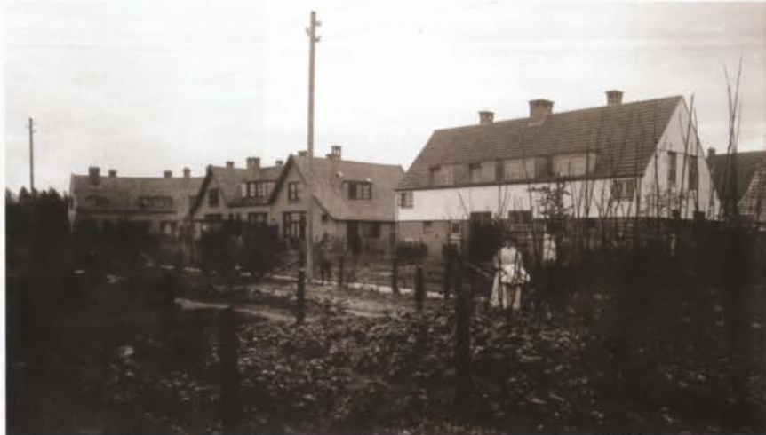
Tuindorp, achteraanzicht huizen aan de Lansinkweg, voorjaar 1913.