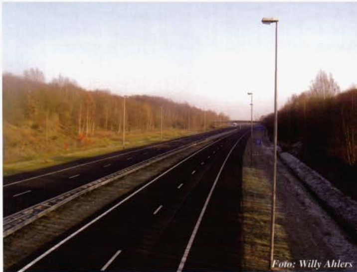
Rijksweg 1 ter hoogte van De Lutte, november 2010.

In de zestiger jaren van de vorige eeuw werden veel initiatieven ontplooid om een goede wegverbinding Twente met het Westen (E8) te verkrijgen. De eerste plannen zijn zelfs al uit 1948. Nog steeds moest het internationale vrachtverkeer zich door de steden wurmen, oa in Markelo Goor, Delden en ook Oldenzaal. In 1985 wordt een nieuwe grensovergang bij De Poppe in gebruik genomen. Op zo'n 20 kilometer na is dan de E8 nu A1 en in