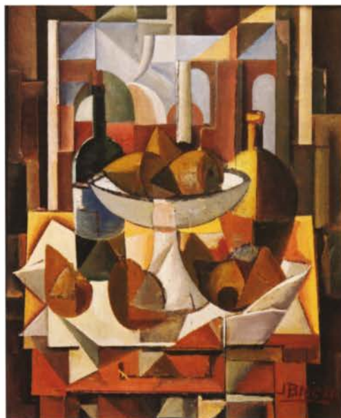
Kubistisch stilleven, zonder jaar