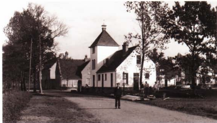
Hoek Julianastraat en C.T. Storkstraat, 1 september 1911.