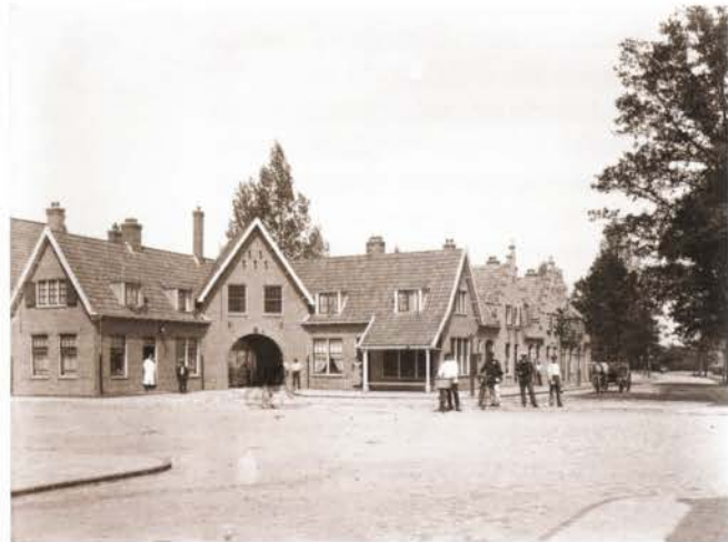
C.T. Storkplein, voorjaar 1913.

tegenwoordig Stork BV zijn er nauwelijks meer te vinden. De oudere gedeelten van de wijk staan sterk in de belangstelling bij woningzoekenden. Prijzen zijn hoger dan in andere wijken van Hengelo, maar dan woont men wel in een bijzondere wijk met een prachtig verhaal. Jaarlijks zet Het Tuindorp zich op de kaart met de jaarlijkse boekenmarkt en kunstmarkt, waarbij bezoekers uit heel Nederland te vinden zijn. Daarnaast draait het Tuindorpbad weer volop. Het buitenzwembad, dat in 1923 in gebruik werd genomen, is langdurig onderwerp van strijd geweest tussen de